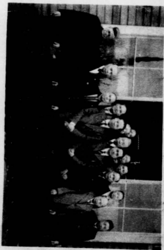
加總支書部記周漢樞二半黨務