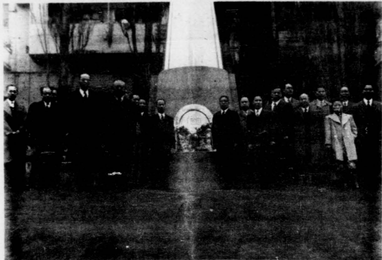
蔣鼎李文漢兩將軍向 國父銅像獻花