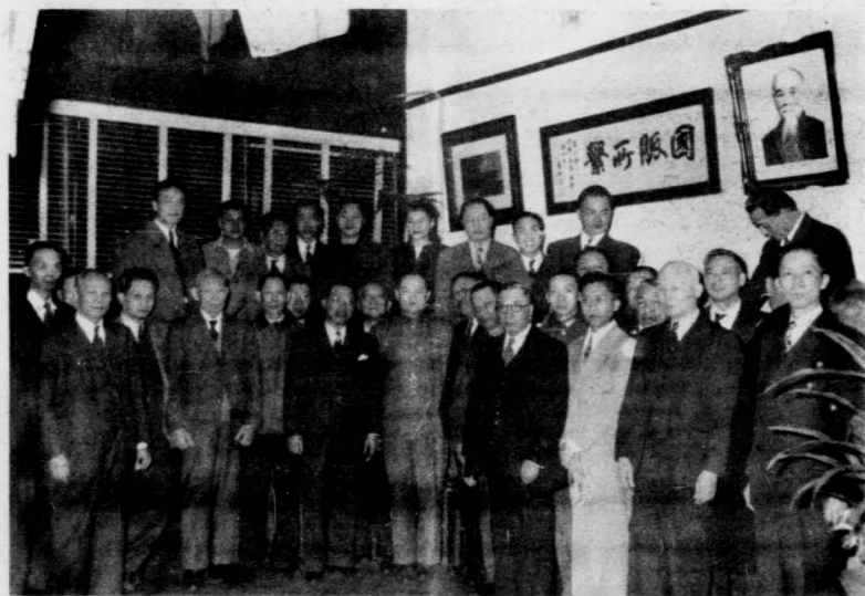
中央委員康澤與美西同志團員合影