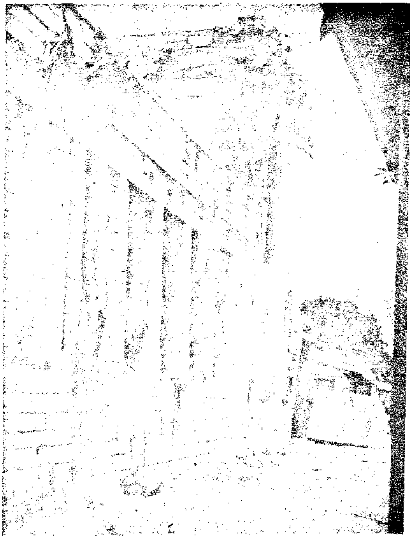
壁殿與門大之存殘寺真清州泉

他和妙世間的銜接，則爲任何時代的人類所未忽略過的。社會科學裏曾載說，上古時代的人們已有了宗教；在古代社會中，找不到沒有「靈魂銜接