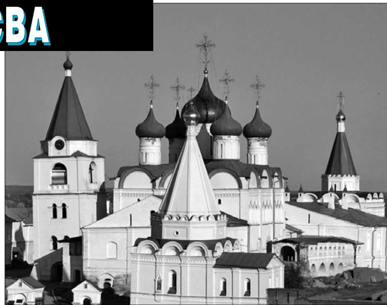
Свято-Вознесенський чоловічий монастир у Нижньому Новгороді

Історія Суздальських земель донесла до нас відомості про те, що в кінці XI ст. вони потрапили під володіння Київського князя Володимира Мономаха. Його син Юрій Долгорукий став першим самостійним князем Ростово-Суздаль-