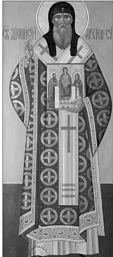
Ікона святителя Діонісія у Вознесенському соборі Печерського монастиря у Нижньому Новгороді

Святитель Діонісій народився близько 1300 року в Києві (можливо, на його околицях), й у Святому Хрещенні отримав ім'я Давид. В юності постригся в ченці Києво-