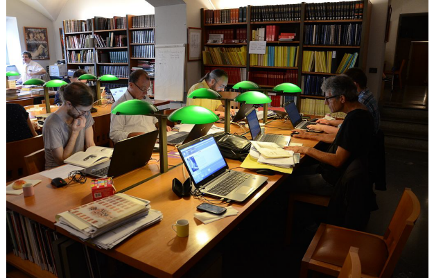
Journée de contribution en juillet 2016 au musée des Beaux-arts de Lyon.