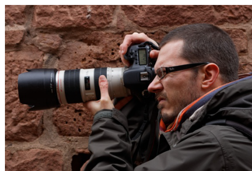
Pyb en plein travail au Château du Haut-Kœnigsbourg , 2014.