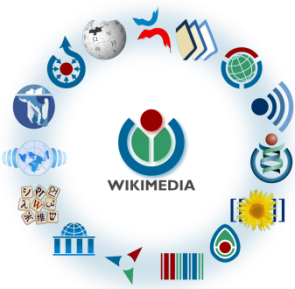
Fig. 1. La galaxie Wikimedia. CC-BY-SA / agrandir

Télécharger la vidéo en qualité : Haute (1080p) / Normale (720p) / Mobile (480p)