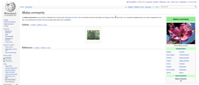
Fig. 10. L'article « Malus coronaria » et son lien avec l'élément Wikidata. (En bas à gauche de l'écran) CC-BY-SA / agrandir

Nous avons fini notre petit tour d'horizon des principaux projets, mais sachez que nous ne les avons pas tous présentés, pour que vous ne vous endormiez pas 😊. Libre à vous de vous renseigner sur Wikivoyage , Wikiquote , Wikiversité , etc.