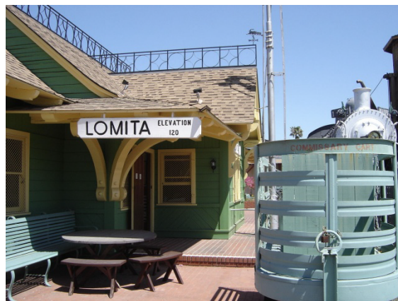
Le musée du chemin de fer de la ville de Lomita, en Californie.