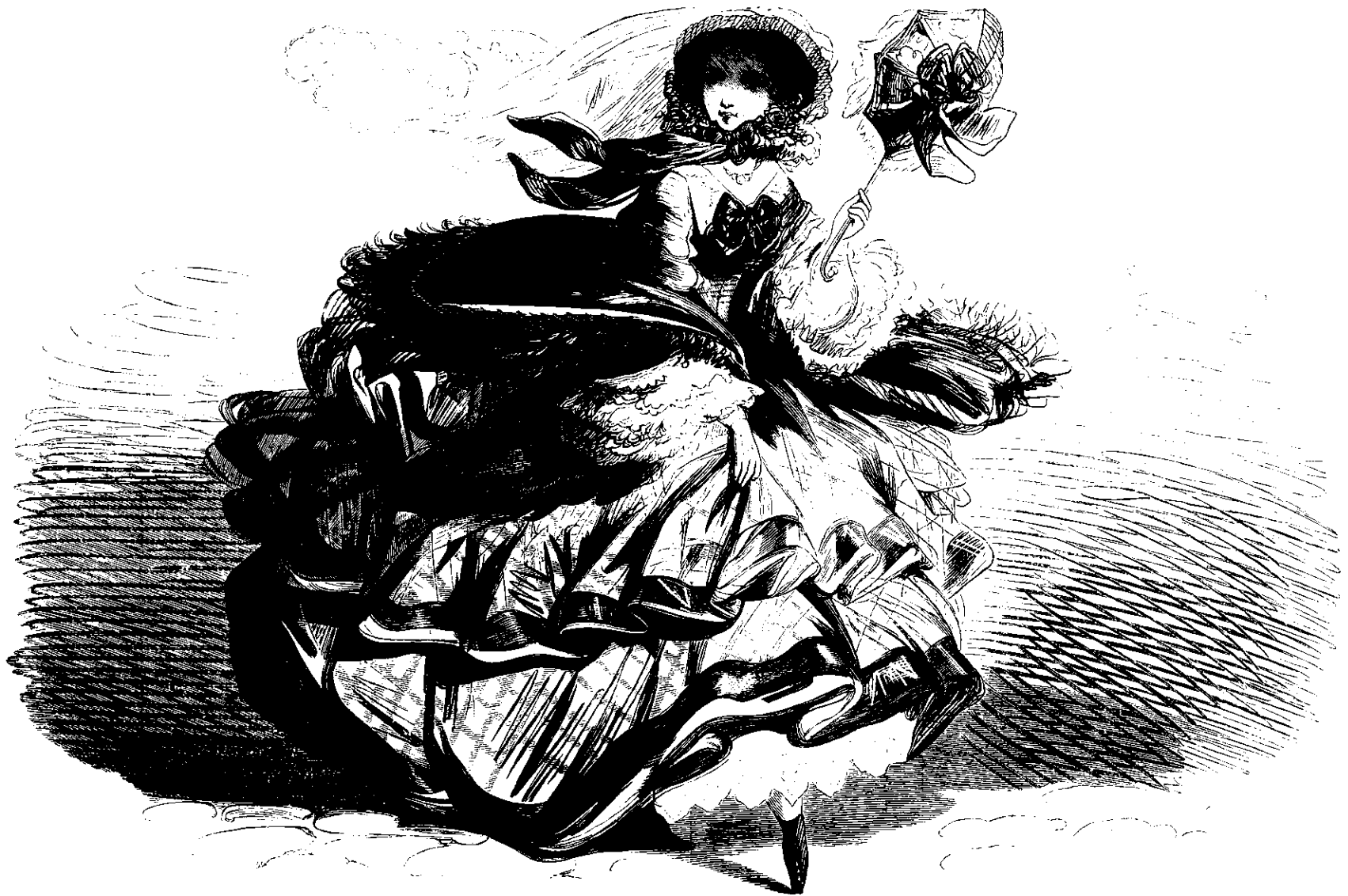
Soroverskibet «la coquette» for fulde Seil.