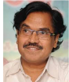
ప్రముఖ సినీ గేయకవి, శ్రీ సుద్దాల అశోకతేజ గారు