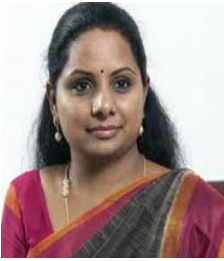
నిజాంబాద్ ఎం.పి శ్రీ కల్వకుంట్ల కవిత గారు