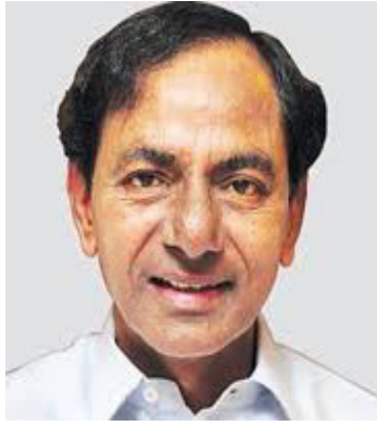
తెలంగాణ తొలి ముఖ్యమంత్రివర్యులు శ్రీ కల్వకుంట్ల చంద్రశేఖర్ రావు గారు