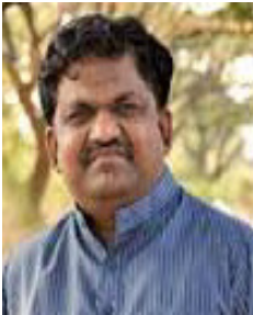
కవి గాయకులు శ్రీ దేశపతి శ్రీనివాస్ గారు