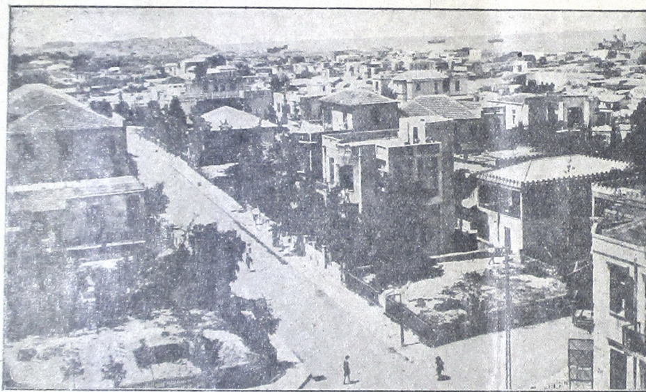
Sesawangan ing kiya „Tel. Aviv” oetawi „Eropah Ketjil” ing Asia. 20 taoen ingkang kepengker panggènan poenika awoedjoed ara-ara, grija 2 dèrèng sapintena kajahipoen. Wekdal samangké sampoen dados telengéng kabodajan Palèstina.

Kinten-kinten taoen 1075 sadèrèngipoen djaman Isa, ingkang angratoni tetijang bangsa Jahoedi, poenika djedjoeloek praboe Saul, ingkang boten watawis dangoe ladjeng pasaelajan kalijan para pangadjenging agami. Ing woesana ingkang djoemeneng nata pandjenenganipoen nabi Dawoed. Inggih kala djamanipoen nabi Dawoed waoe moemboel-moemboelipoen bangsa Jahoedi. Kala samanten nagari Djaroesalam dipoen rebat déning bangsa Jahoedi, lan inggih ing kala poenika anggènipoen tetijang bangsa Jahoedi jasa kadaton wonten ing sapoetjaking redi anakan, ingkang sakalangoeng éndah sarta santosa. Menggah namaning redi anakan waoe: Zion.