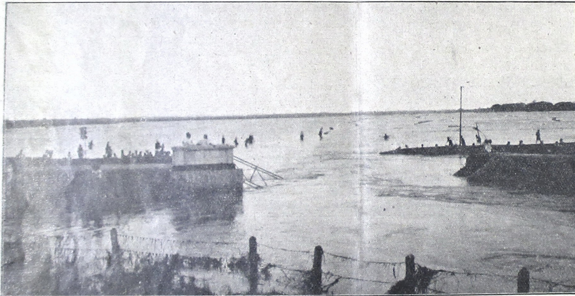
Kreteg satjelakipoen Lemahabang Krawang ingkang laroet djalaran katradjang ing bena.

Bena ing mangsa poenika. Ing mangsa poenika ngoengsoem bena, mitoeroet pawartos, kawontenanipoen bena waoe, ing Trenggalek bena saking lèpèn Ngasinan, toja ngantos mlangkah tanggoel, kañah sabin ingkang keleben, sami risak. Grija ingkang karisakan, ing doesoèn Toegoe 9. Nglongsor toewin Taloen 35, Ngasinan wétan 6. Kadjawi poenika taksih kañah doesoèn-doesoèn ingkang keleben; ing Gending-Kraksaan, bena saking lèpèn wetan peken, kañah grija ingkang kaekoem ing toja; ing Madioen, bena