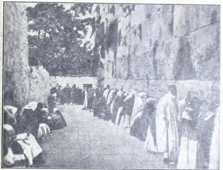
Tetijang bangsa Jahoedi noedjoe sami wonten ing satjelakipoen pager tembok (djidar al makka) satjelaking mesjid al Oemar, ing Djaroesalam

Awit saking lelampahan ingkang makaten poenika, koela ladjeng wangsoel kéngetan dateng pepestèning bangsa koela tetijang Indonésia, kala roemijan nalika taksih lemes, tegesipoen dèrèng gadah nijat njantosak-