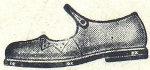
f 2.30 2451-ozdobné