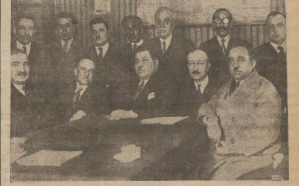
Milli vapurcular içtima halinde..