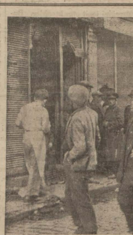
Karaköyde ganan terzihanenin önünde..

lemek için şahsi liyakati, zengin olmak için memba, çok çalışmak için bir çok işleri olan, daima ilerleyecek, daima kuvvet bulacak ve gelecek seneler-