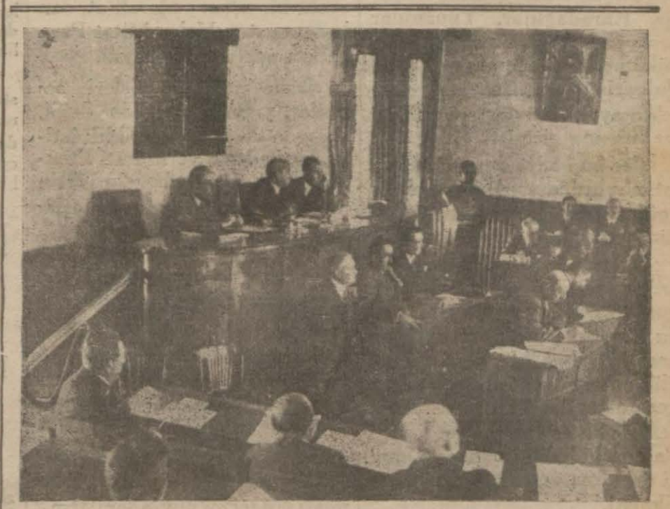
Şehir meclisinin dünkü içtimadan bir intiba

Cinayeti haber alan bir muharirimiz gece geç vakte kadar tahkikatı bulunmuş ve bu korkunç cinayet etrafında şu malûmatı toplamıştır: