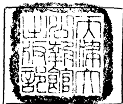
版權所有不許翻印