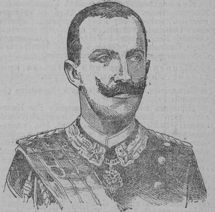
Викторъ-Эммануиль II Король Итальянскій.

Впослѣдствіи Матѳея былъ избранъ Спасителемъ въ число 12-ти апостоловъ. Онъ проповѣдовалъ Евангеліе въ Палестинѣ, Сиріи, Мидіи, Персіи, Индіи и Египціи, благовѣстивъ миръ, жизнь и спасеніе. Св. ап. Матѳея написалъ палестинскимъ христіанамъ Евангеліе. Скончался онъ, по преда-