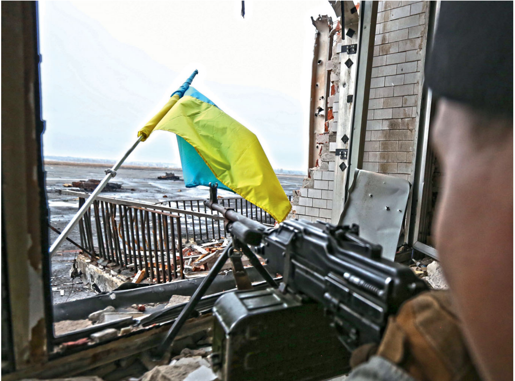
Донецький аеропорт. 2014 рік.