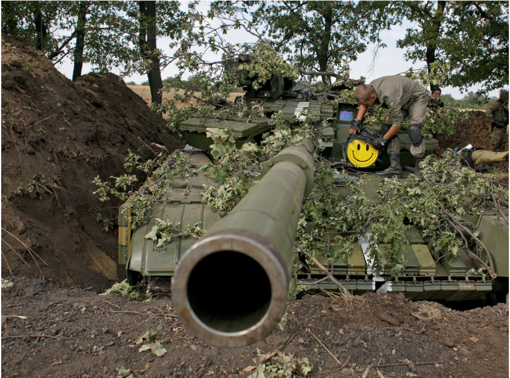
Український солдат на позиціях біля села Жовтого Луганської області. 20 серпня 2014 року.