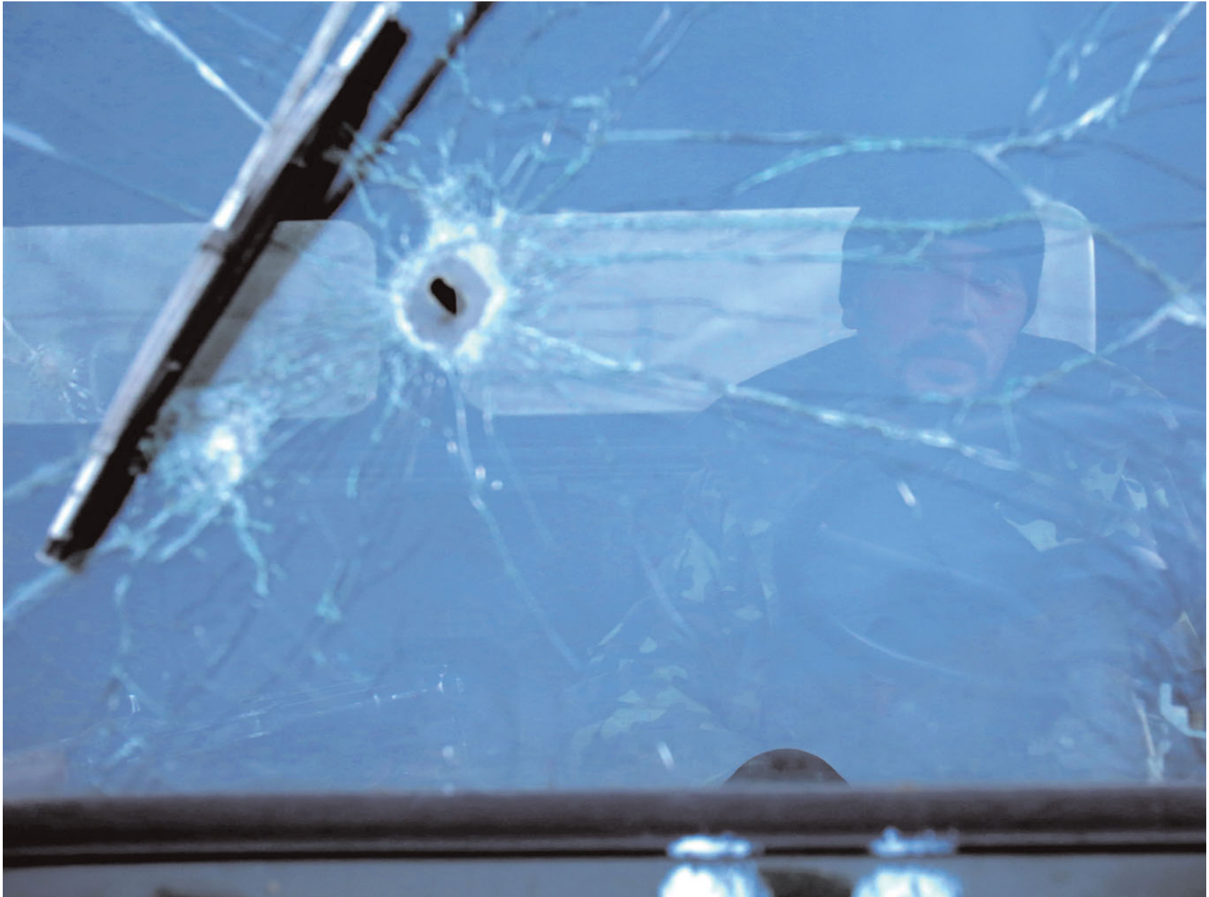
Український солдат дивиться через пробите осколком лобове скло автомобіля в селі Кримському. 29 листопада 2014 року.