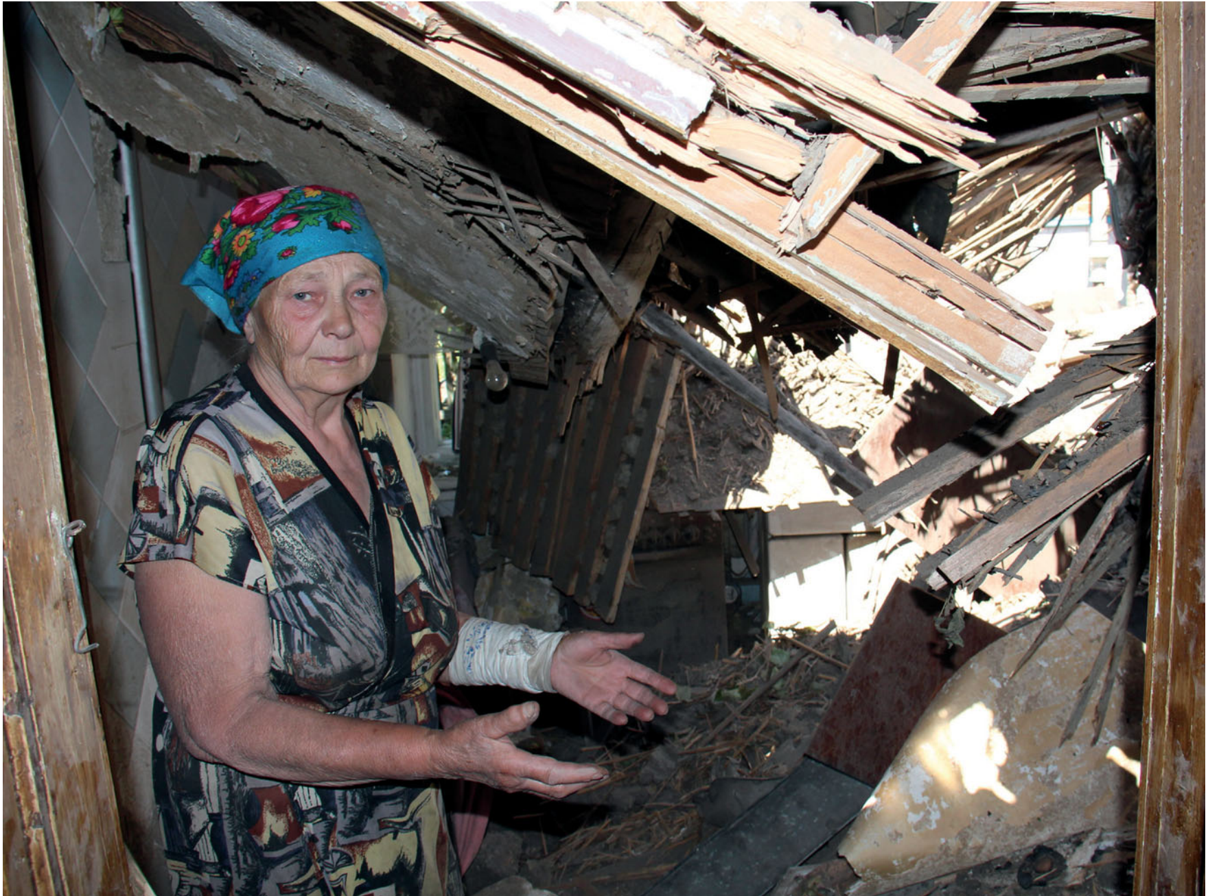
Наслідки обстрілу бойовиками населеного пункту Мар'їнка. Червень 2015 року.

Consequences of militants' firings of Mariinka village. June 2015.