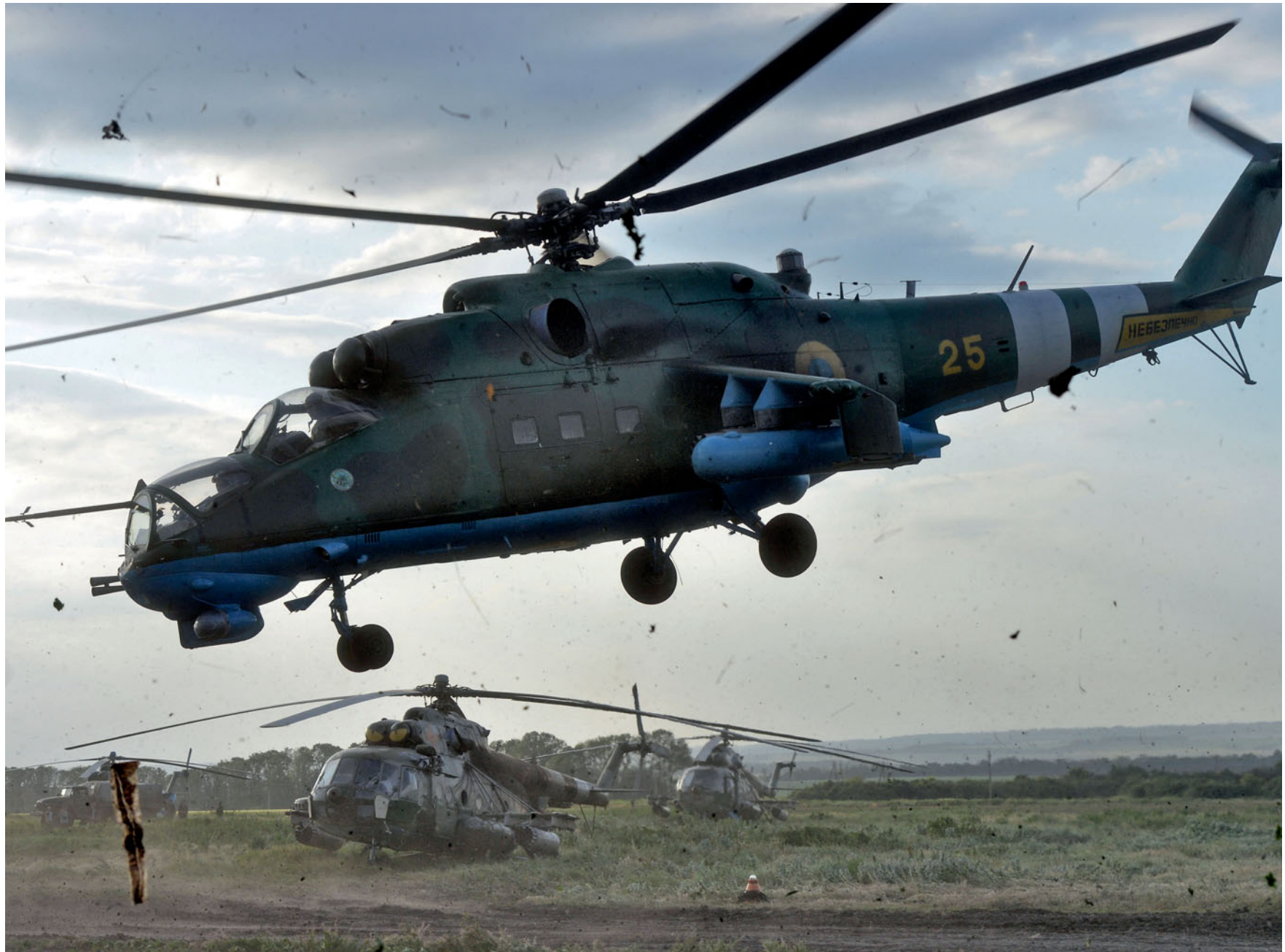
Вертоліт Мі-24 армійської авіації ЗСУ летить на завдання з польового аеродрому біля села Довгеньке. 4 червня 2014 року.

Army aviation Mi-24 helicopter is flying on mission from the field landing area near Dovhenke village. June 4, 2014.