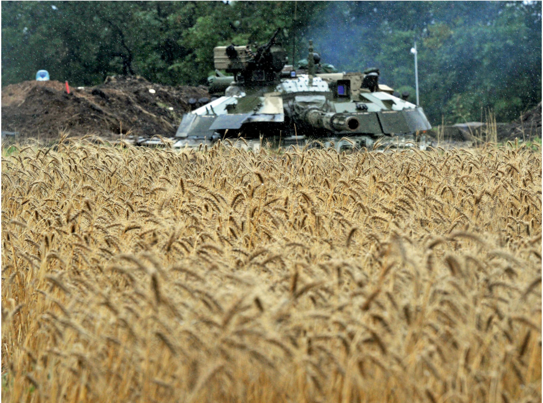
2-й батальйон 30-ї бригади на позиціях біля селища Металіст під Луганськом. 8 липня 2014 року.

The 2nd Battalion of the 30th Brigade at positions near village of Metalist on the outskirts of Luhansk. July 8, 2014.