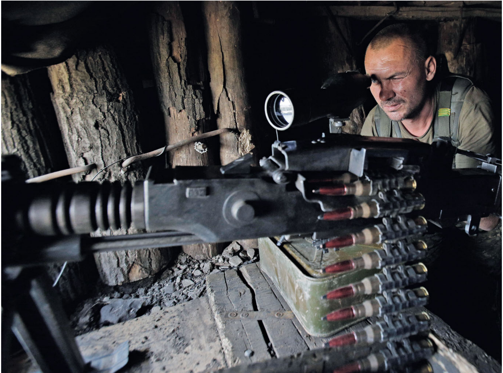
Солдат 54-ї бригади спостерігає за противником на позиціях біля с. Луганського, що на Донеччині. 30 червня 2016 року.