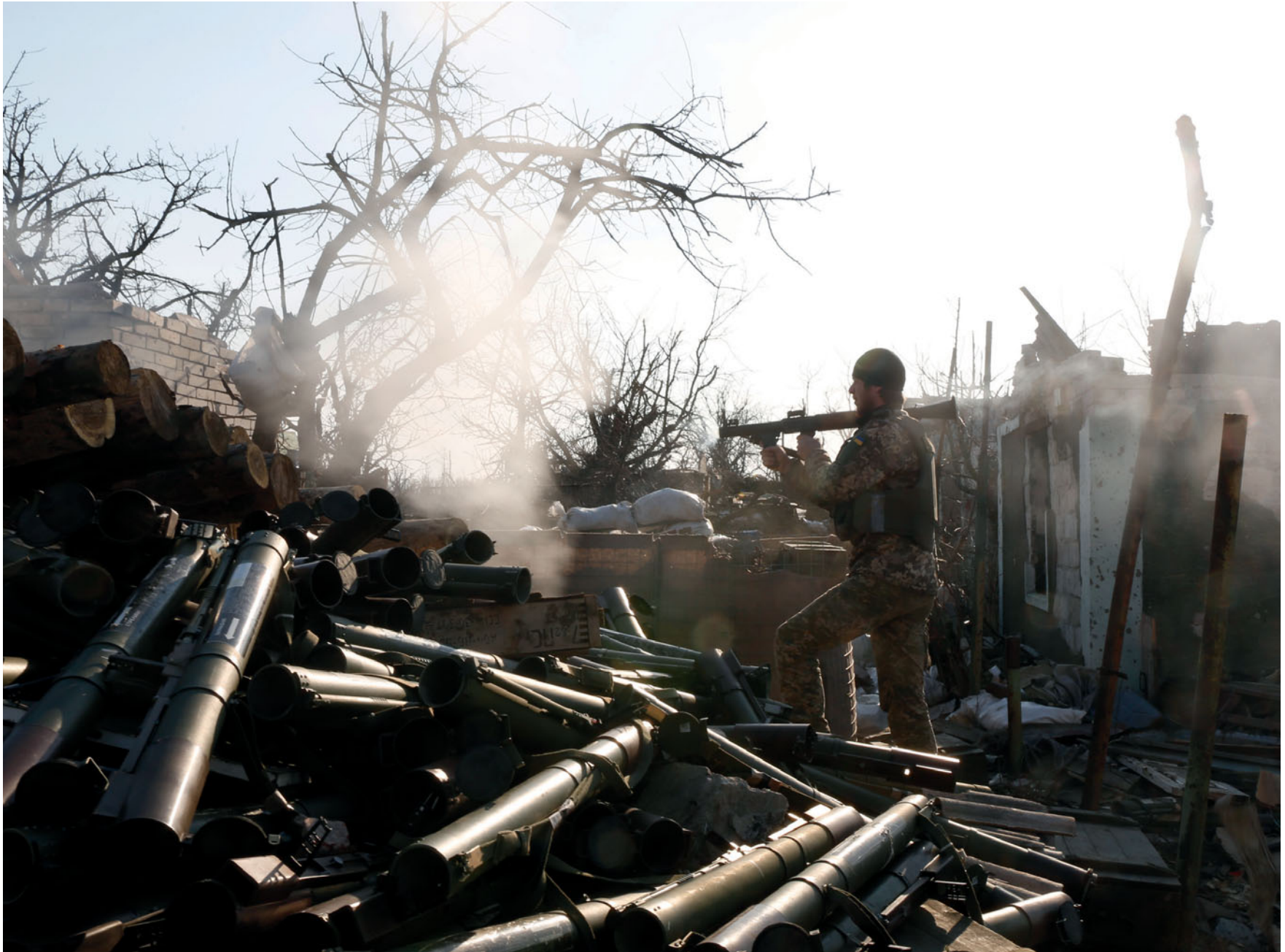
Босць 72-ї бригади веде вогонь із гранатомета під час бою в авдіївській промзоні. 30 березня 2017 року.

A soldier, 72nd brigade, is firing the grenade launcher. Avdiivka industrial area. March 30, 2017.