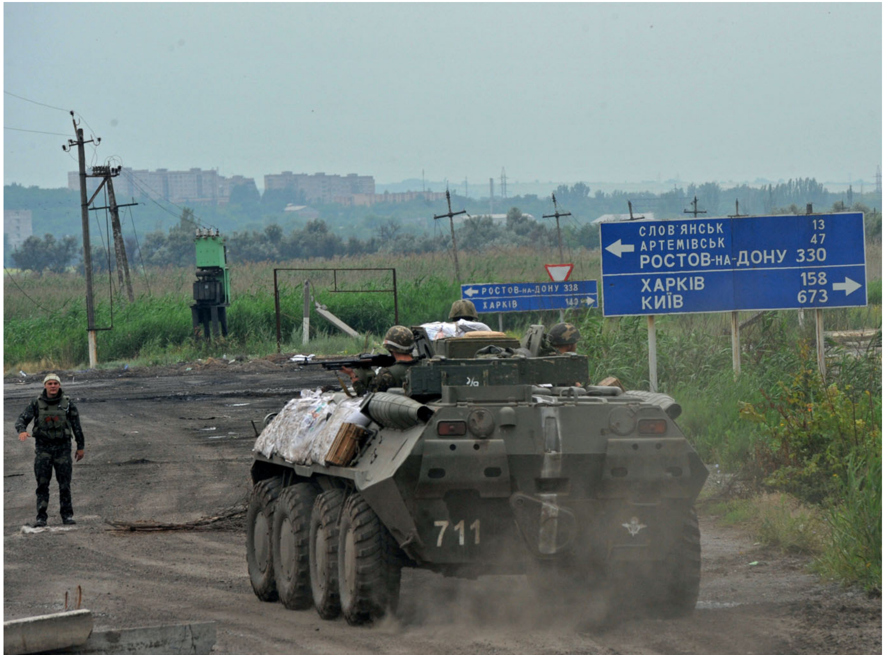
Конвой 95-ї бригади повертається з Кривої Луки. Блокпост біля Слов'янська. 26 червня 2014 року.

The 95th Brigade convoy is coming back from Kryva Luka village. Checkpoint near Sloviansk. June 26, 2014.