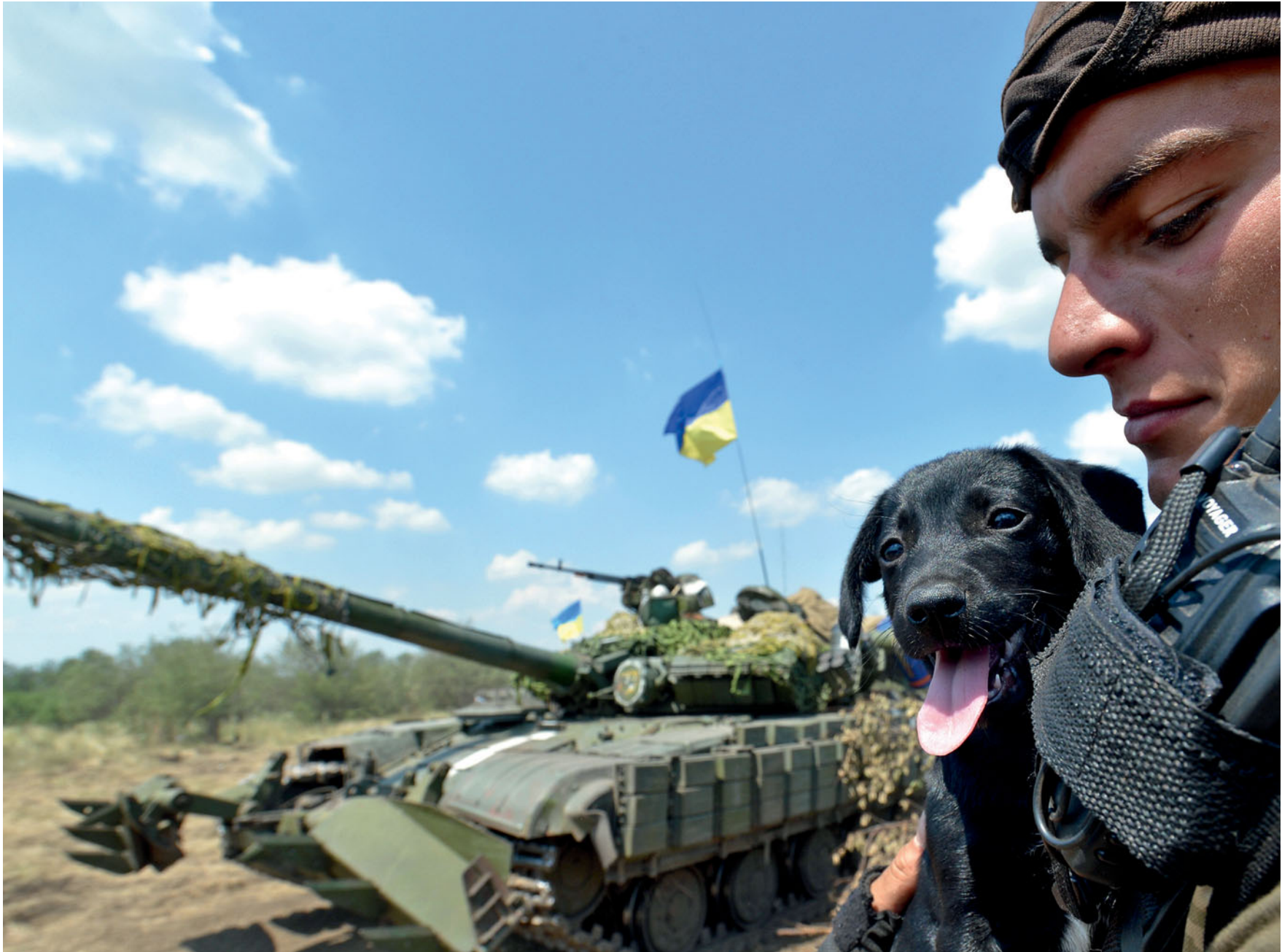
Танкісти 93-ї бригади повертаються з блокпоста на місце базування в саду біля села Михайлівка. 23 липня 2014 року.