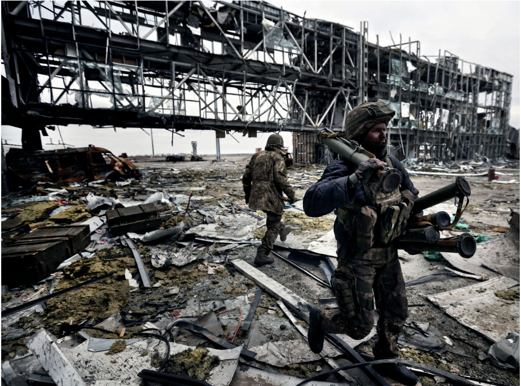
Донецький аеропорт. 2014 рік.