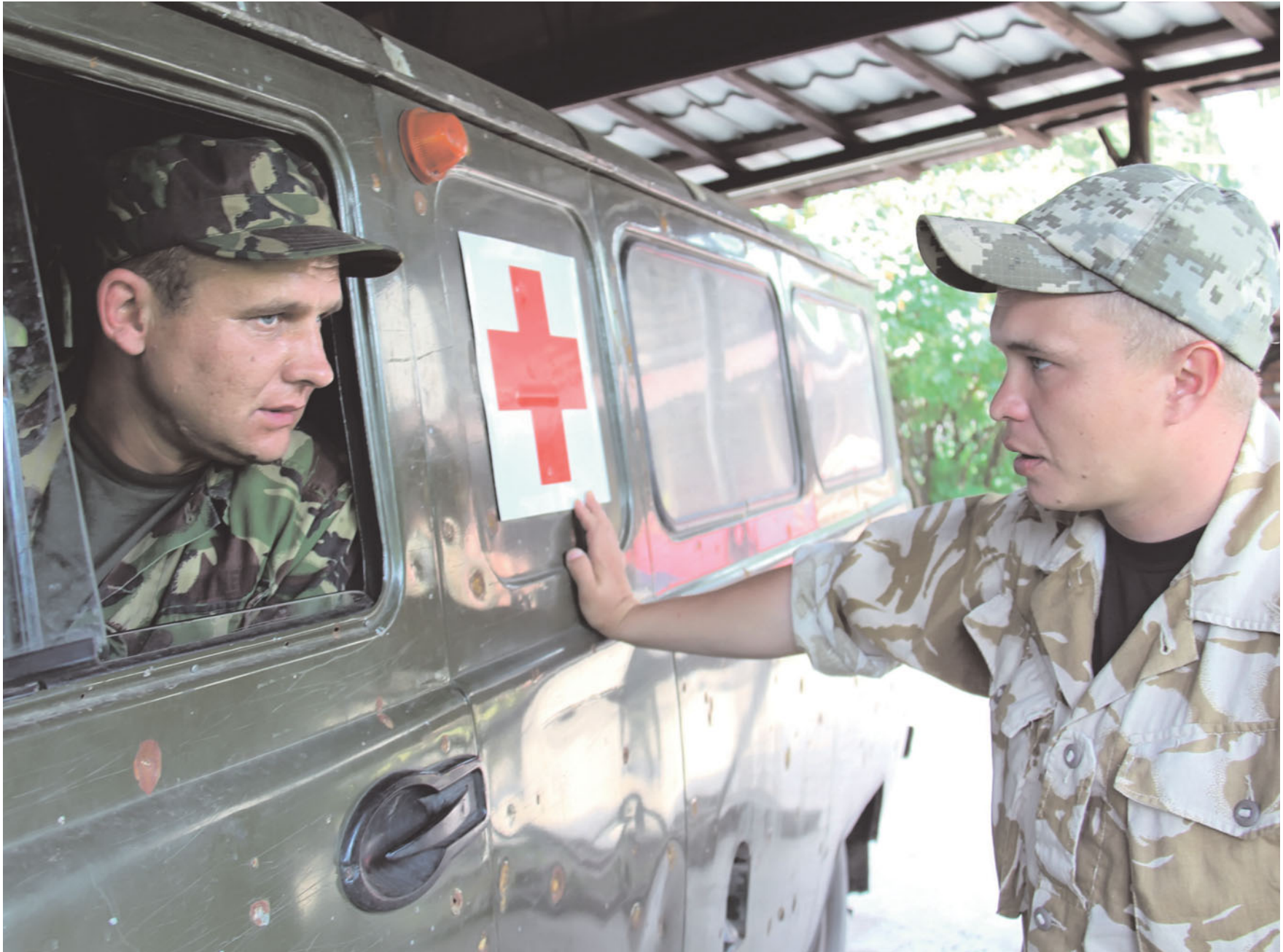
Медики 30-ї бригади. Донецький напрямок. Червень 2015 року.