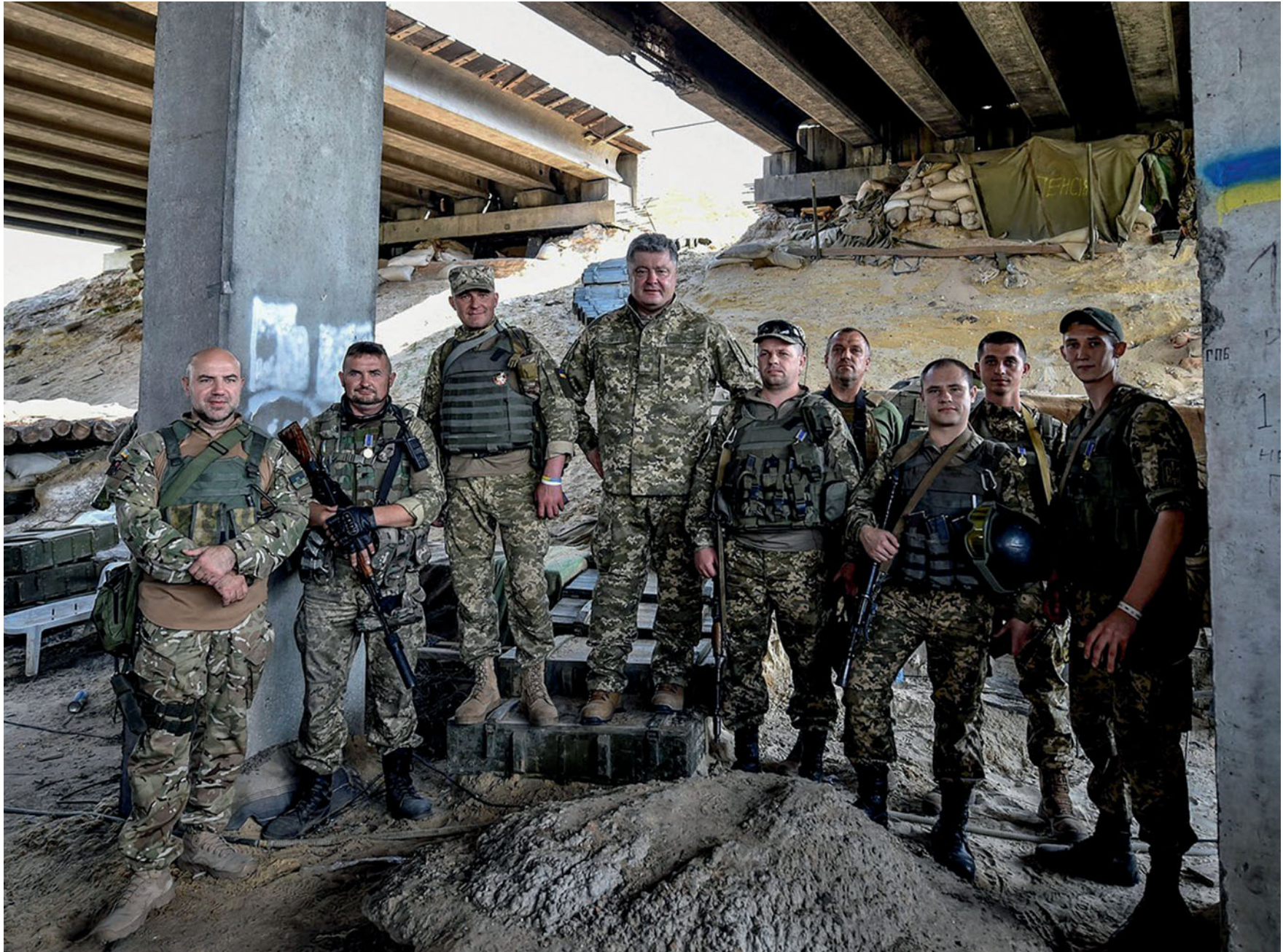
Президент України Петро Порошенко під час інспектування лінії опорних пунктів у районі АТО. Водяне. Червень, 2016 року.