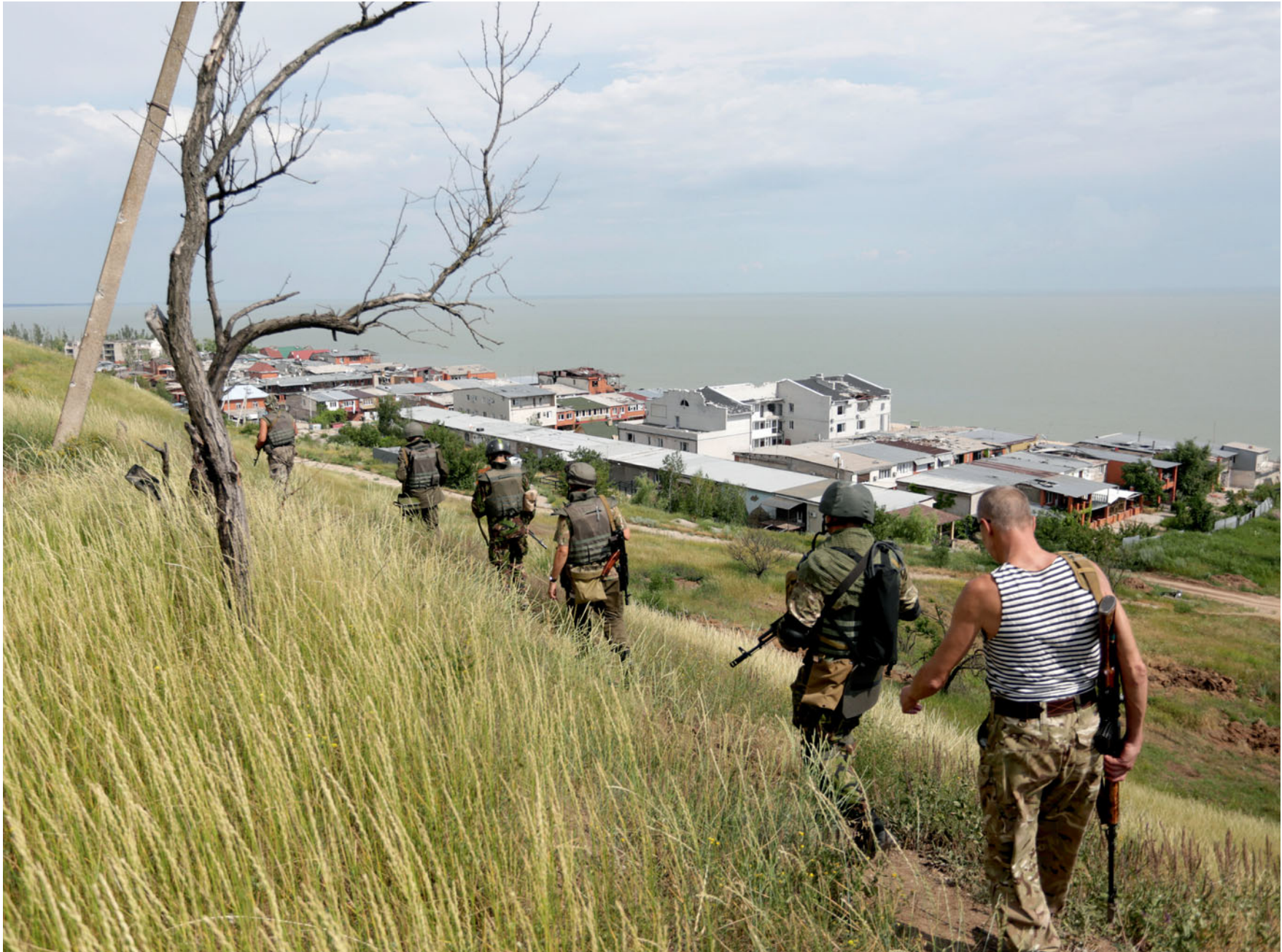
Бійці батальйону «Донбас» ЗСУ виходять на бойові позиції в селі Широкиному, що на Донеччині. 3 липня 2015 року.

Soldiers of 'Donbass' battalion of the Armed Forces of Ukraine are entering combat positions in Shyrokyyno village, Donetsk oblast. July 3, 2015.