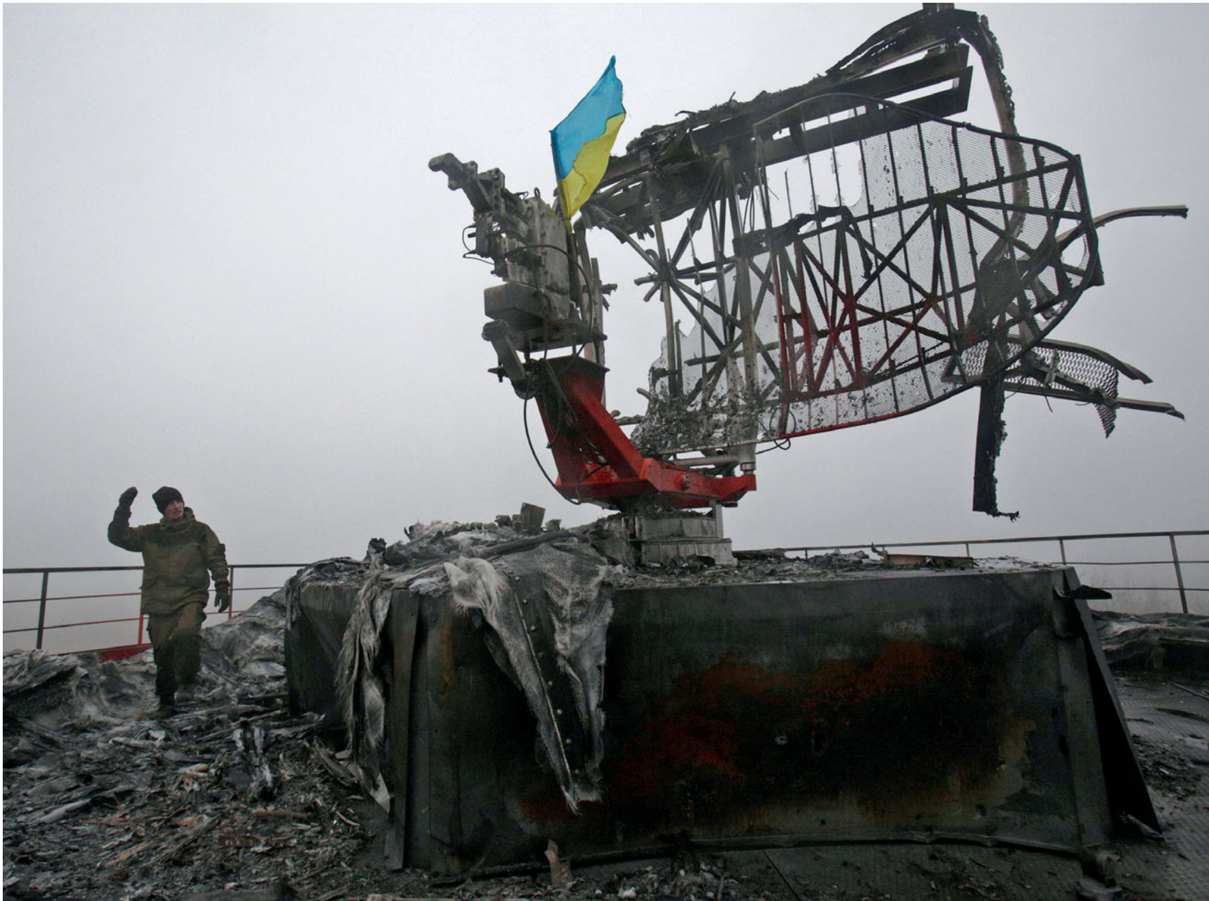
Українського солдата видно на радіолокаційній вишці метеостанції донецького аеропорту. 11 грудня 2014 року.

Ukrainian soldier is showing up at the meteorological station radar tower December 11, 2014.