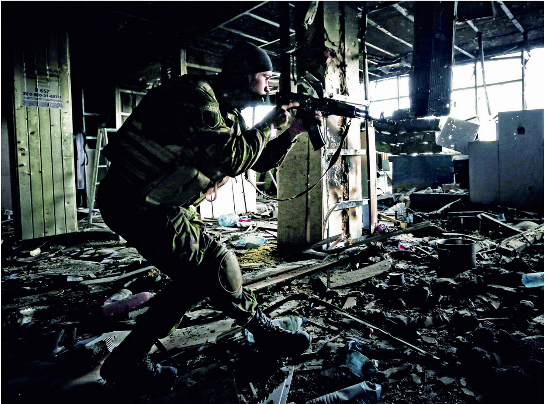
Донецький аеропорт. 2014 рік.