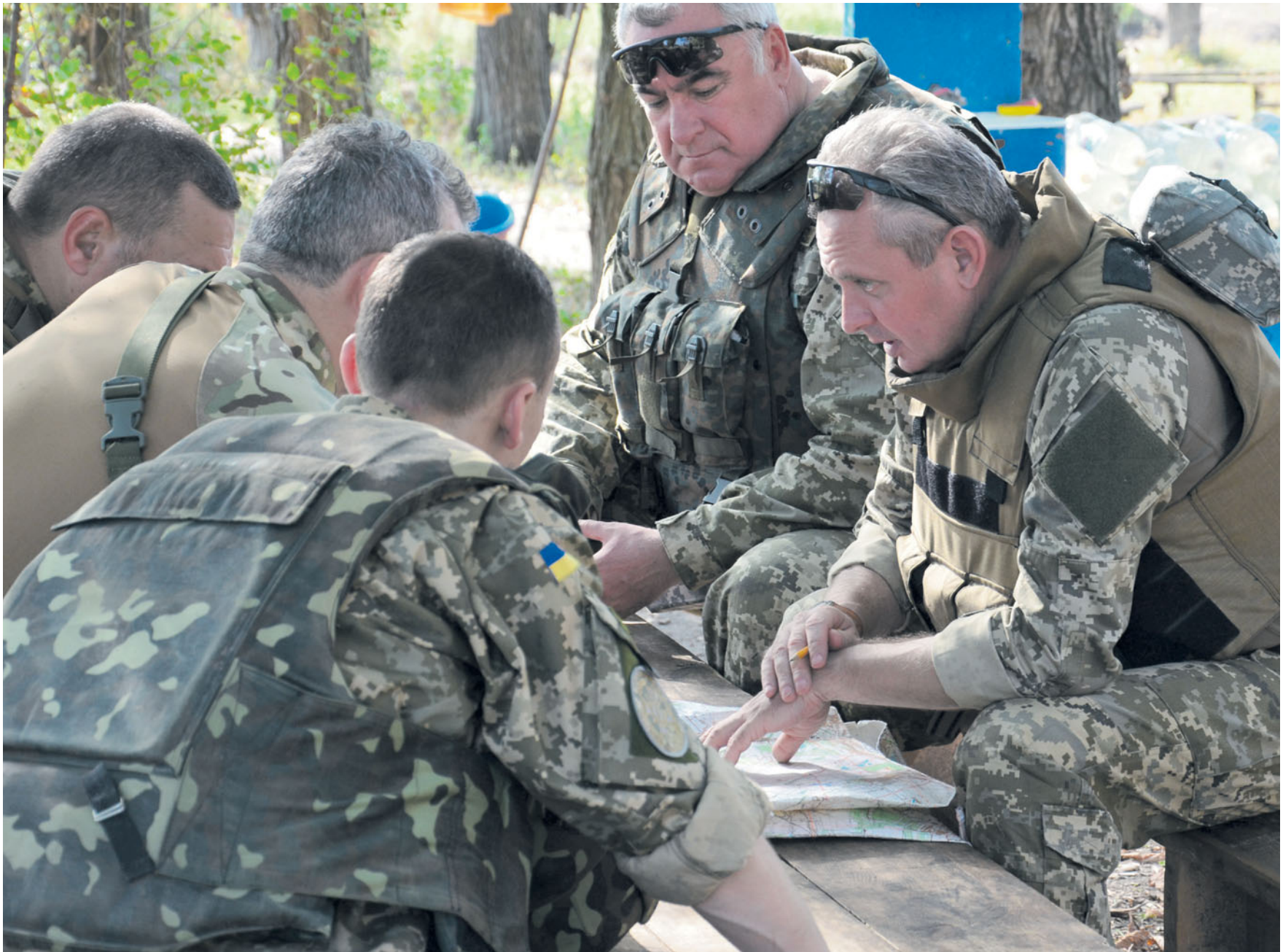
Нарада в районі АТО.