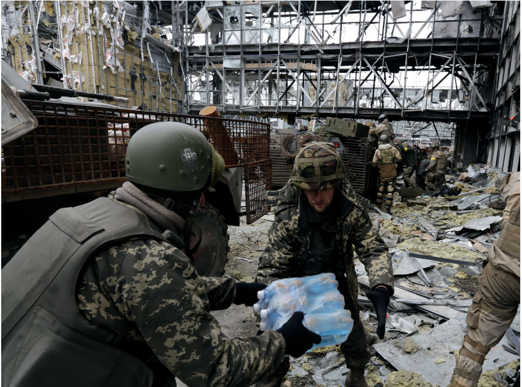
Донецький аеропорт. 2014 рік.