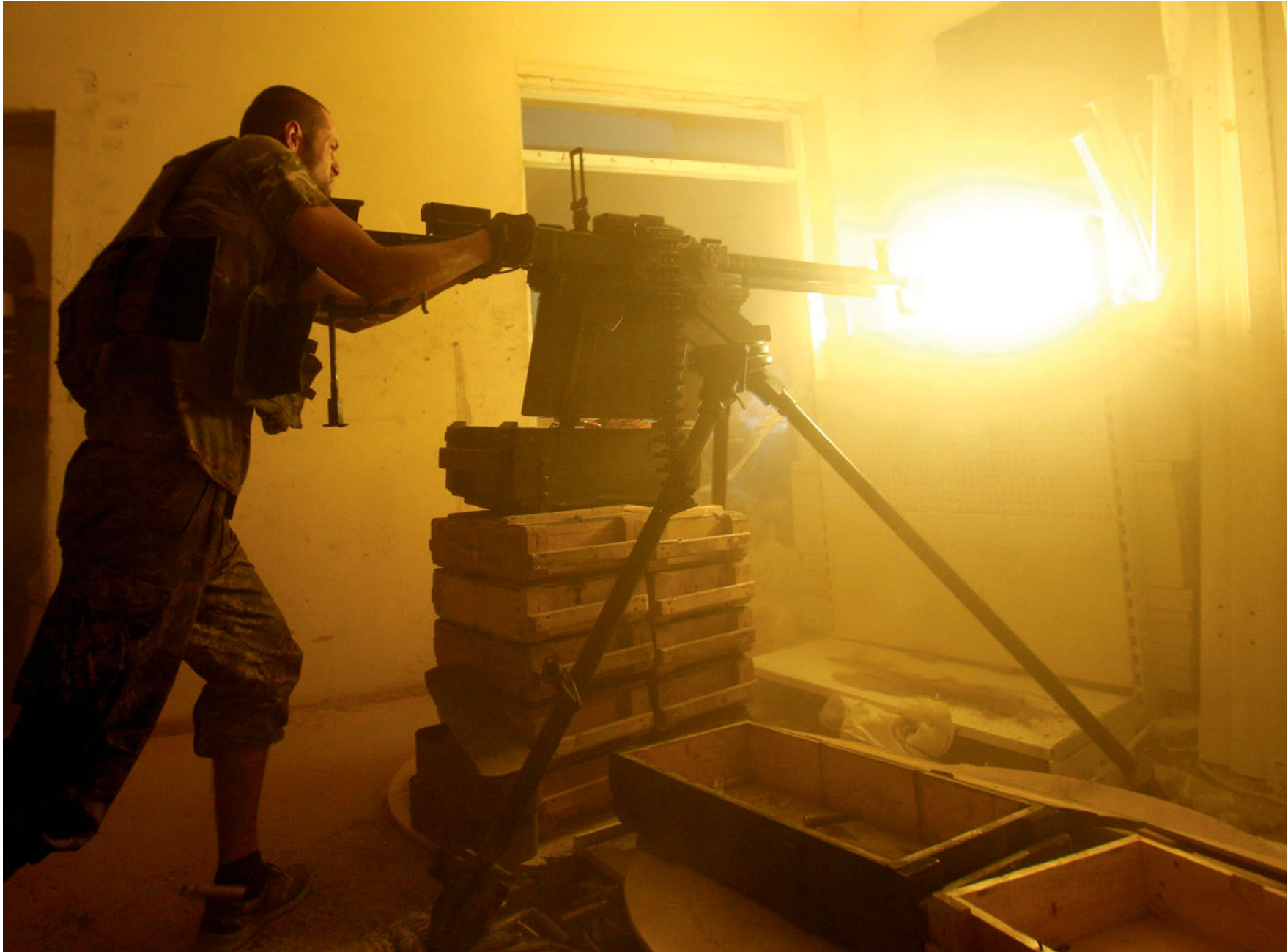
Десантник 122-го батальйону веде вогонь із ДШК під час бою в авдіївській промзоні. 24 червня 2016 року.

A soldier, 112nd battalion, is shooting DShK heavy machine gun, Adviiivka industrial area. June 24, 2016.