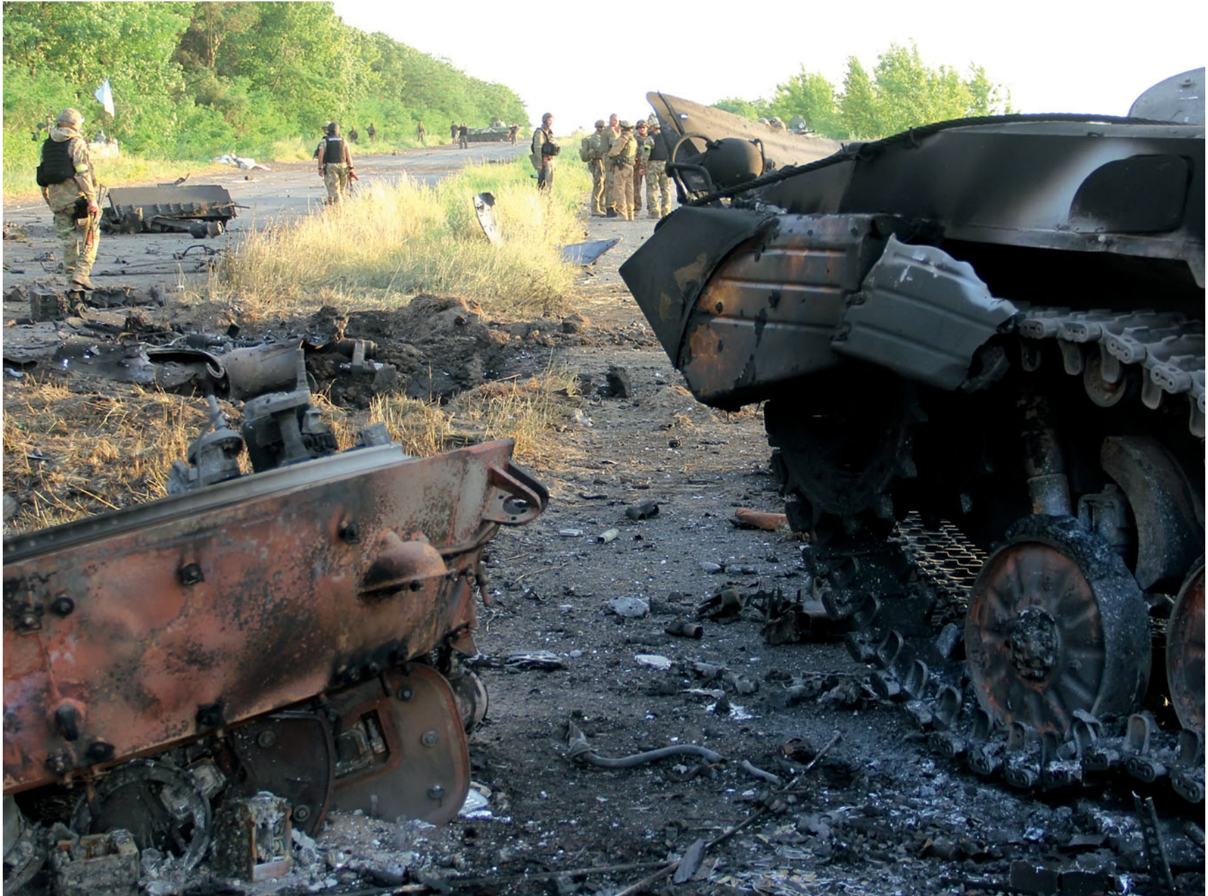
Підбита ворожа техніка на трасі Слов'янськ — Краматорськ. 5 липня 2014 року

Destroyed enemy military equipment on the road Sloviansk — Kramatorsk. July 5, 2014