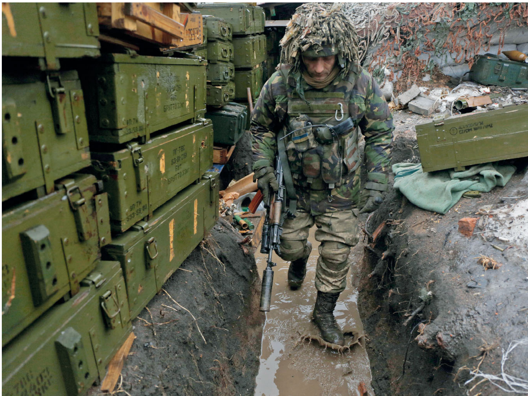
Солдат 72-ї бригади в залитому водою окопі в авдіївській промзоні. 23 лютого 2017 року.

Soldier from the 72nd brigade in waterlogged trench, Avdiivka industrial area. February 23, 2017.