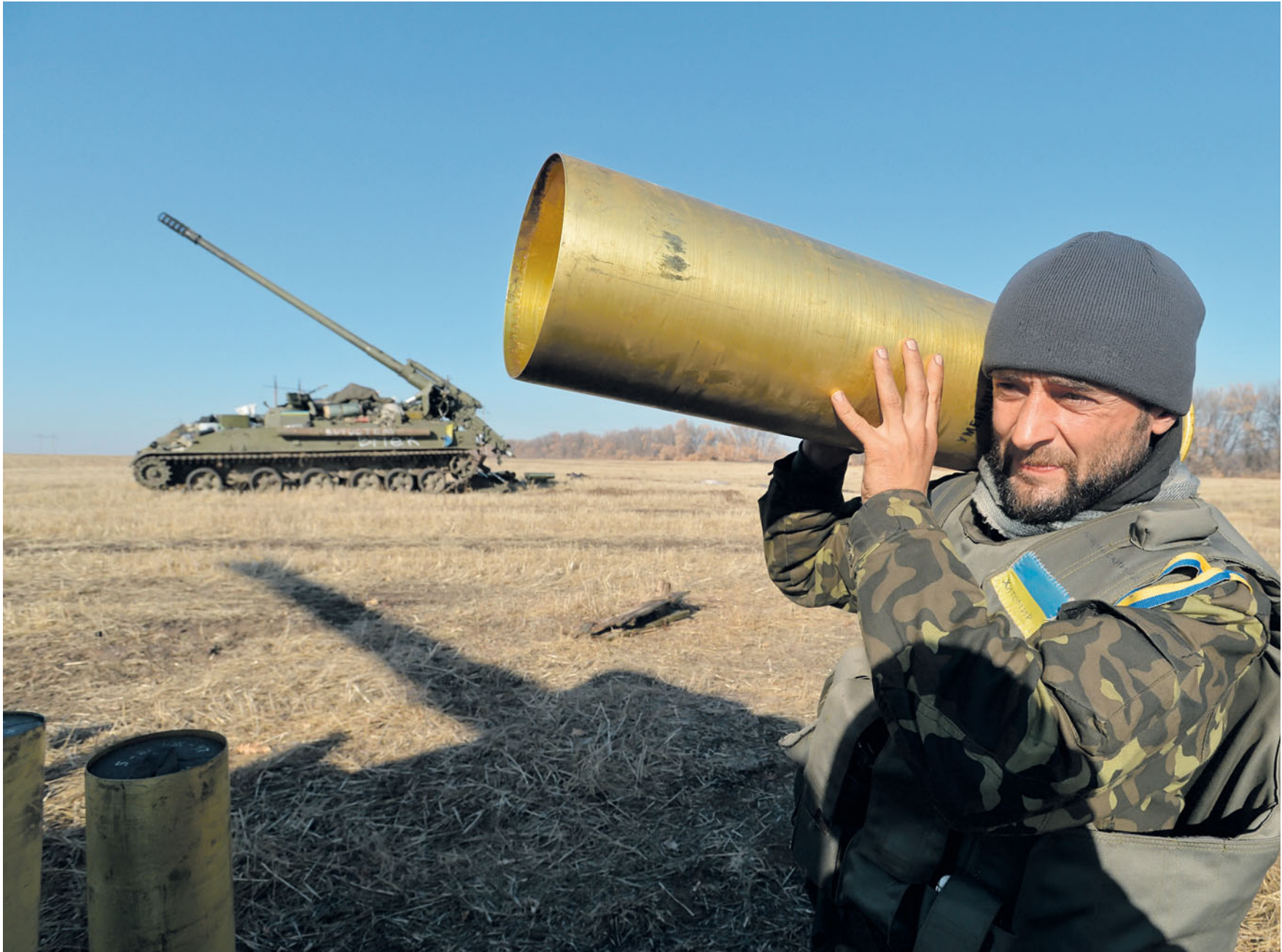
Артилеристи 26-ї бригади готуються до ведення вогню з далекобійних гармат 2С5 «Гіацинт-С» в районі Щастя. 7 листопада 2014 року.

Artillerists from the 26th Brigade are getting ready to fire a long-range gun 2S5 'Giatsynt-C' near Shchastia village. November 7, 2014.