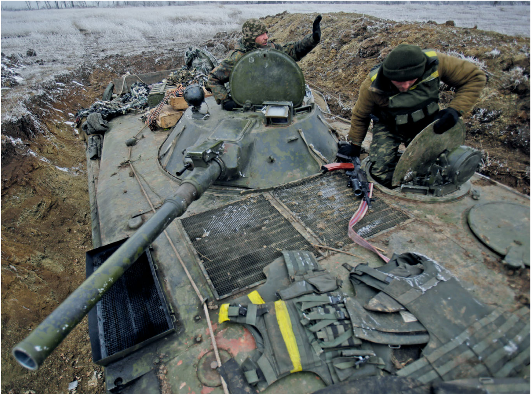
Бійці 30-ї бригади на позиціях біля села Красний Пахар, що на Донеччині. 14 лютого 2015 року.

Soldiers from the 30th brigade, positions near Krasnyi Pakhar, Donetsk oblast. February 14, 2015.