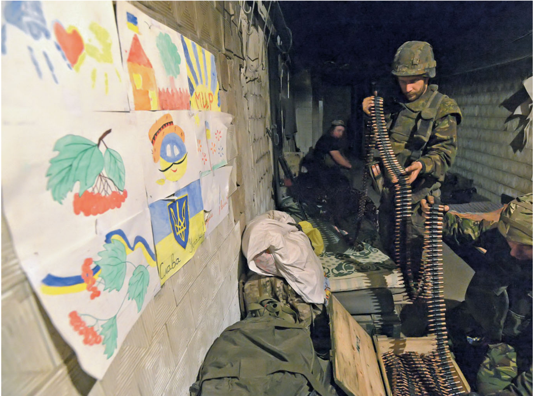
Нічний бій на шахті «Бутовка». Добровольці «Правого сектору». 7 червня 2015 року.

Night combat for Butivka mine. Volunteers of the Right Sector. June 7, 2015.