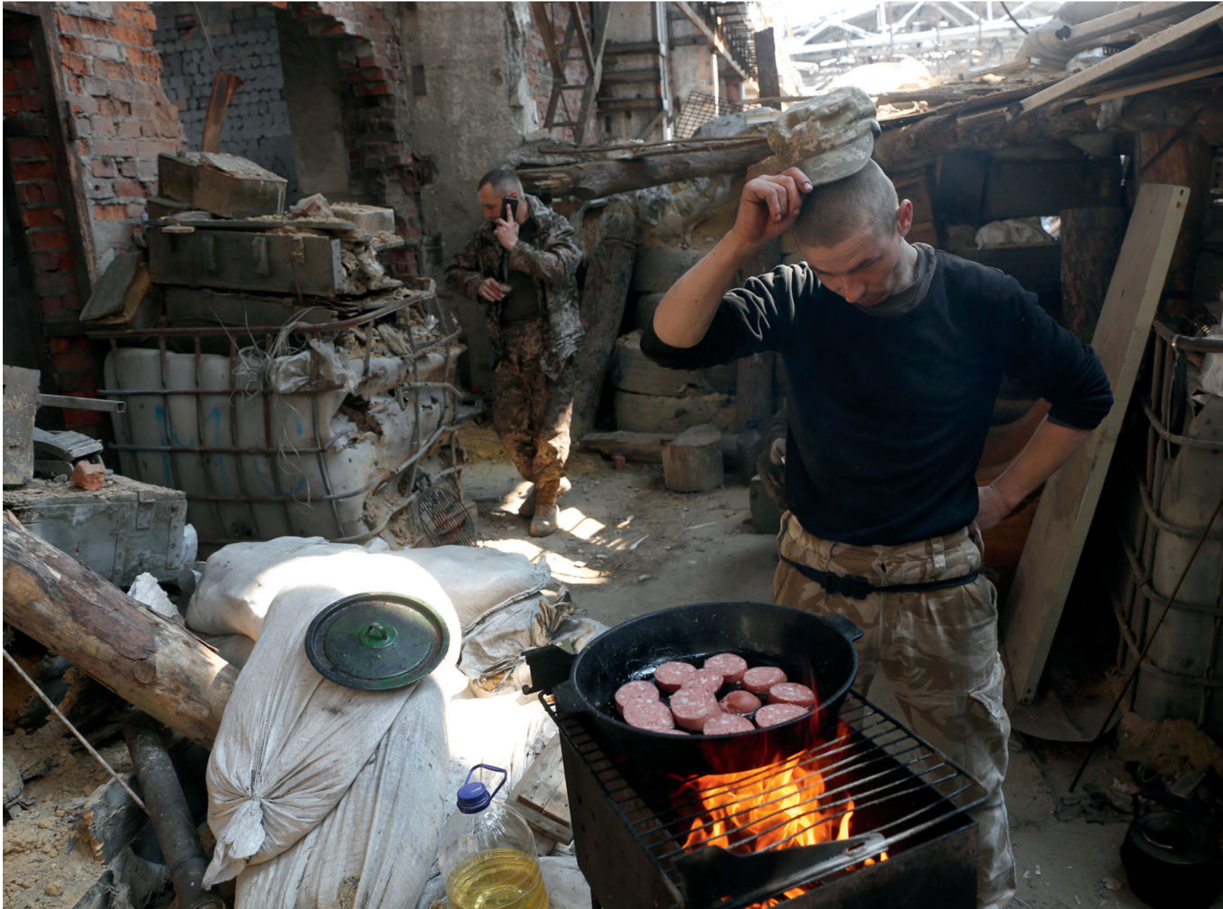
Боець 72-ї бригади готує їжу на позиції «Скелет» в авдіївській промзоні. 4 квітня 2017 року.