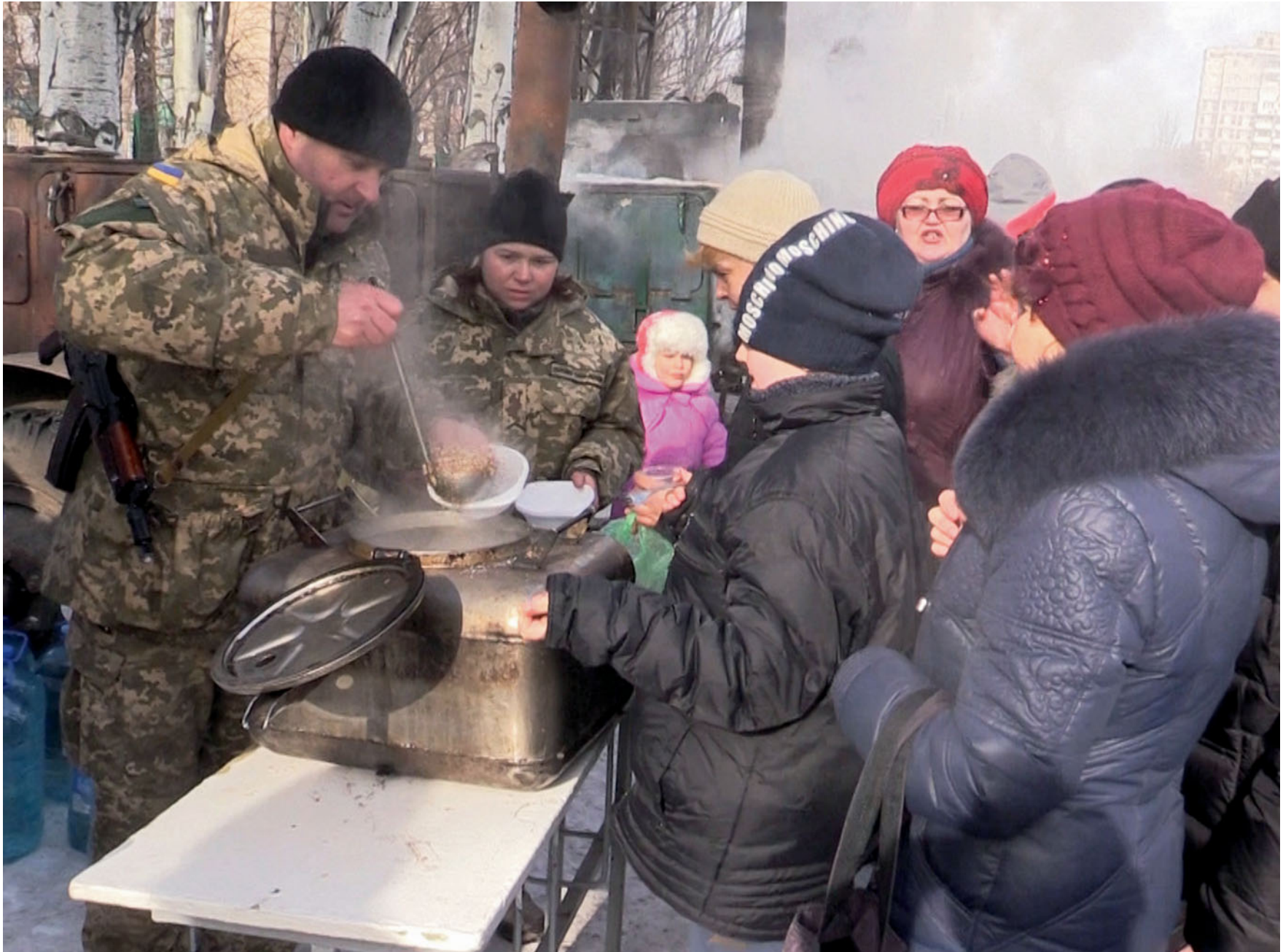
Військовослужбовці ЗС України роздають гарячу їжу мешканцям Авдіївки. Лютий 2017 року.

Representatives of the Armed Forces of Ukraine hand out cooked meal to the locals of Avdiivka. February, 2017.