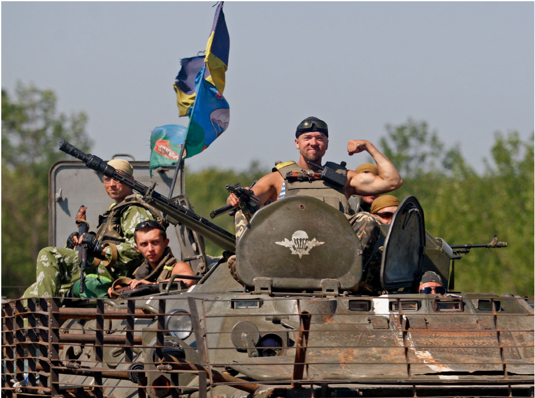
Українські десантники на БТРі перед в'їздом на територію краматорського аеропорту. 9 серпня 2014 року.