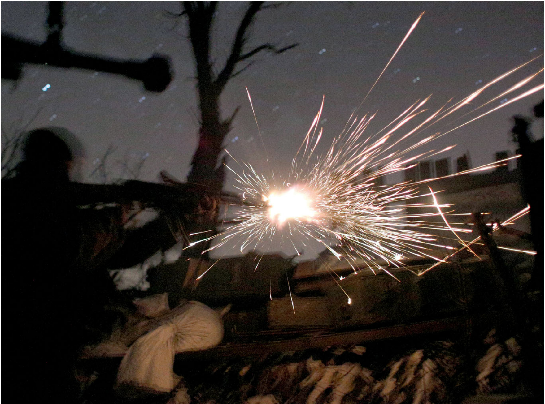
Боєць 72-ї бригади веде вогонь з автомата під час нічного бою в авдіївській промзоні. 31 березня 2017 року.