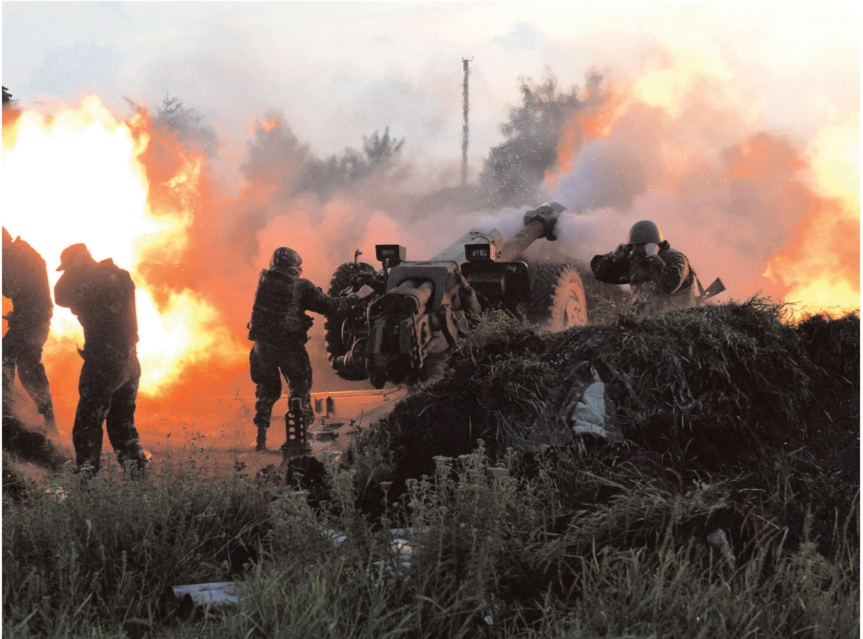
Бій біля села Крива Лука. Артилеристи 95-ї бригади. 25 червня 2014 року.

Combat actions near Kryva Luka village. Artillerists from the 95th Brigade. June 25, 2014.