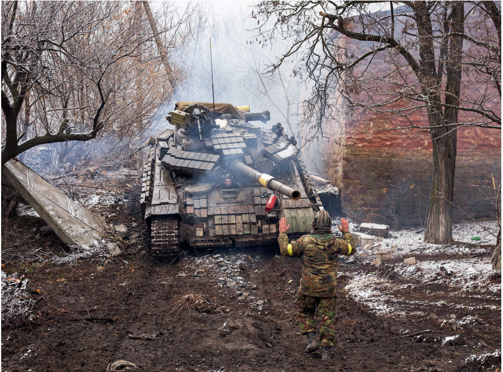
Село Луганське, Донецька область.