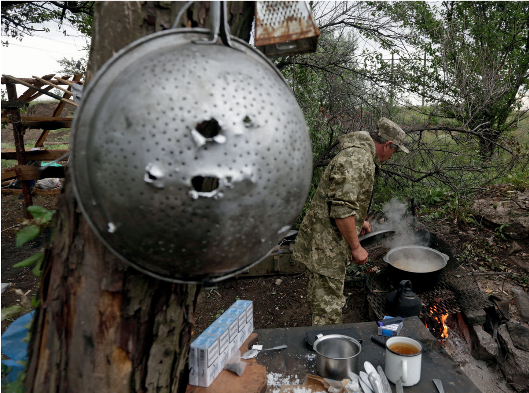
Боець 30-ї бригади з позивним «Батя» готує їжу на позиції поблизу смт Гольмівського Донецької області. 28 липня 2015 року.

A soldier from the 30th brigade, 'Batia' is making meal, position near Holmivske village, Donetsk oblast. July 28, 2015.