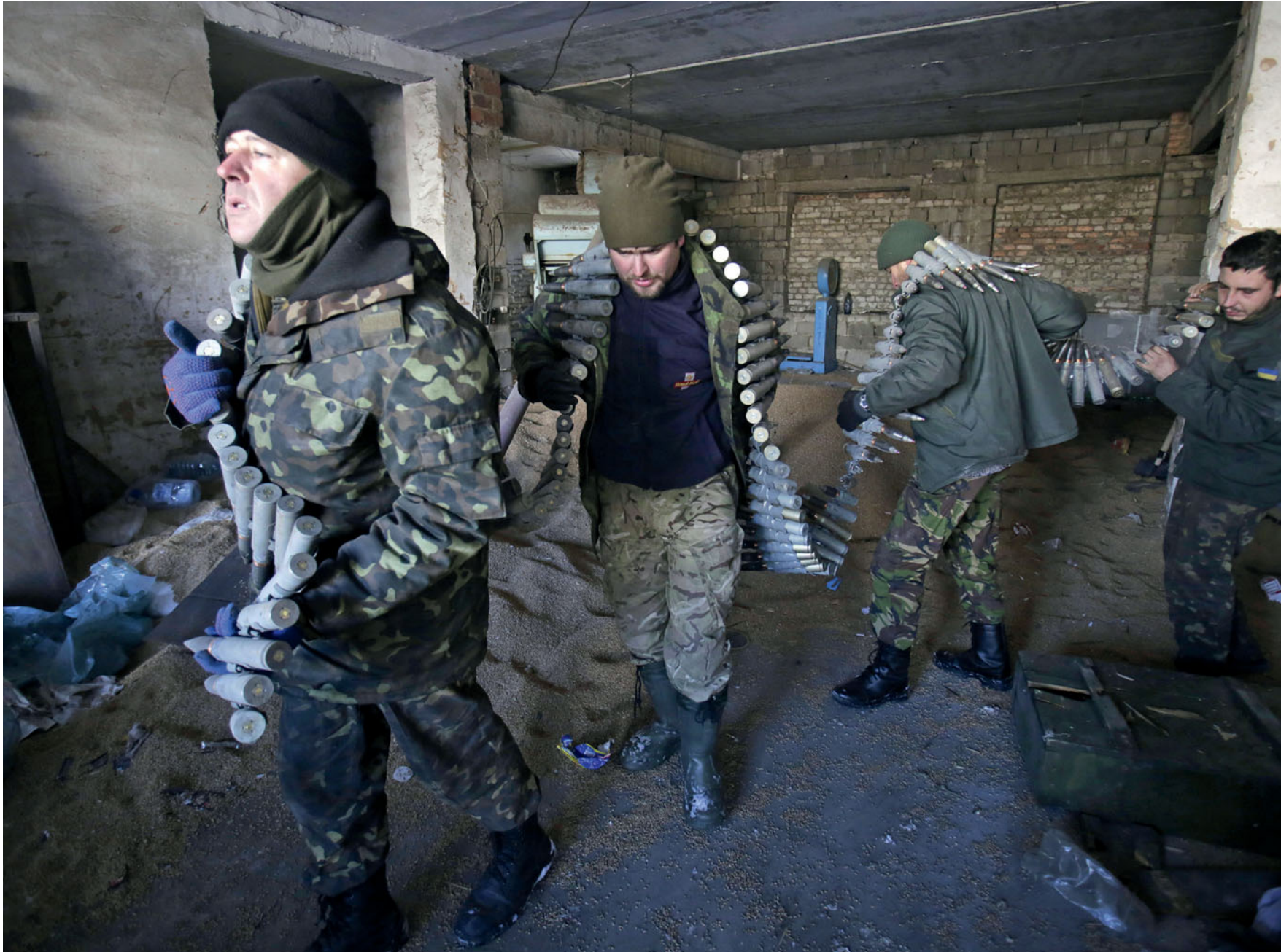
Солдати 93-ї бригади несуть споряджену стрічку для автоматичної гармати БМП-2 в селі Піски, що на Донеччині. 3 грудня 2014 року.

Soldiers from the 93rd Brigade are carrying a loaded ammunition belt of BMP-2 automatic cannon in Pisky village. Donetsk oblast. December 3, 2014.