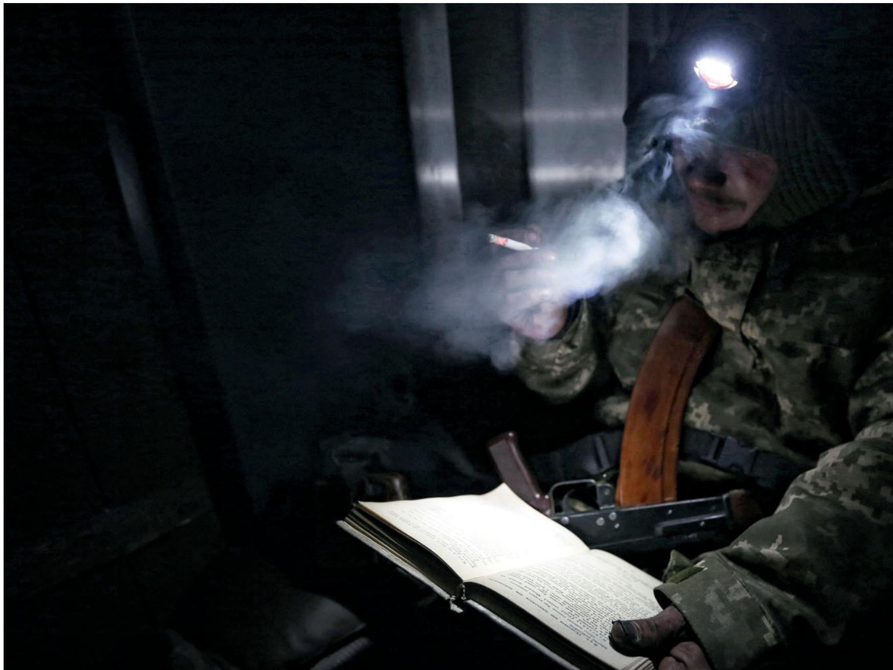
Донецький аеропорт. 2014 рік.