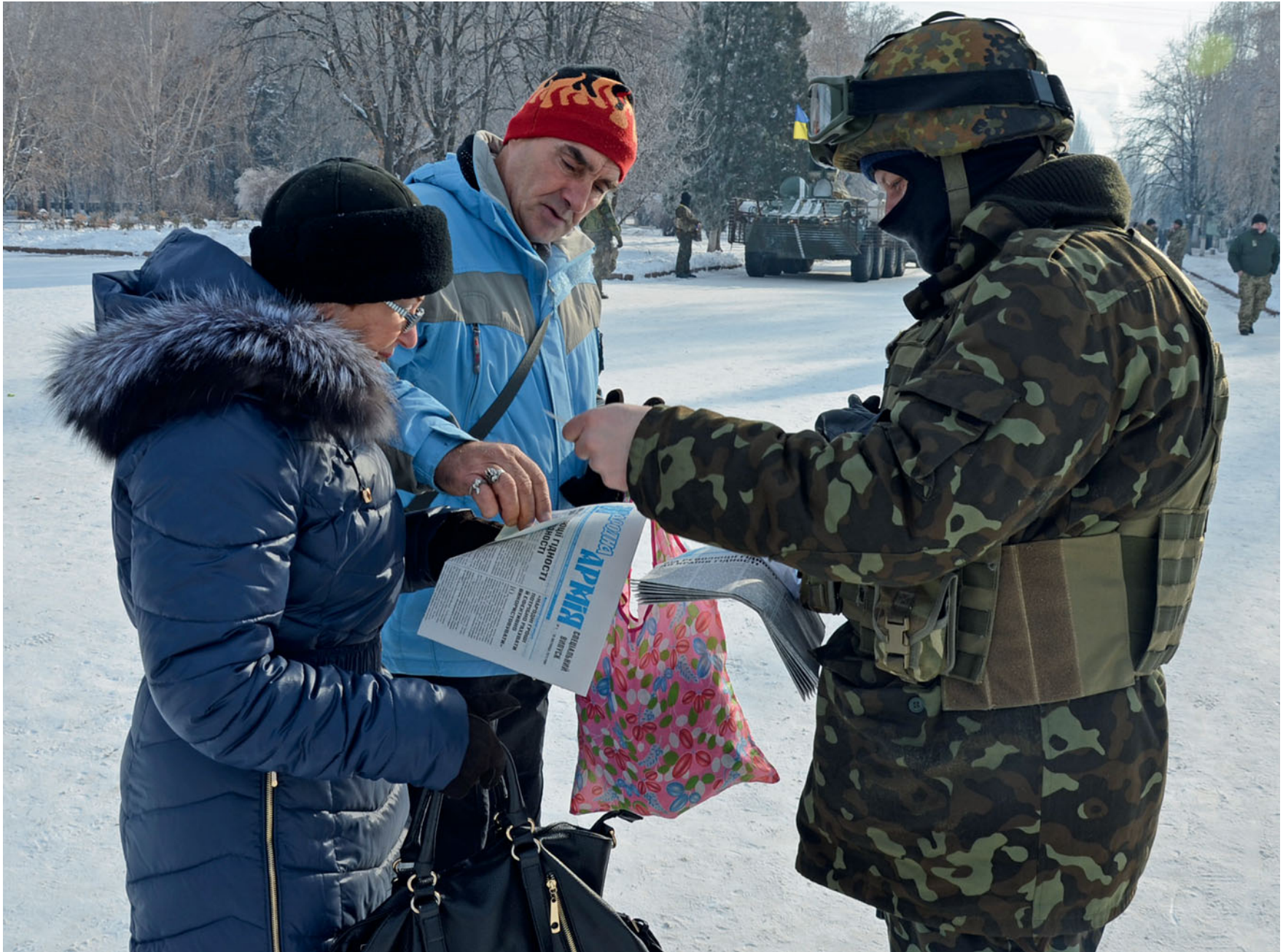
Українські військові роздають газету «Народна армія» мешканцям Слов'янська. Грудень 2014 року.

Ukrainian service members distribute newspaper «Narodna Armiiia» (People's Army) to the locals in Sloviansk. December, 2014.