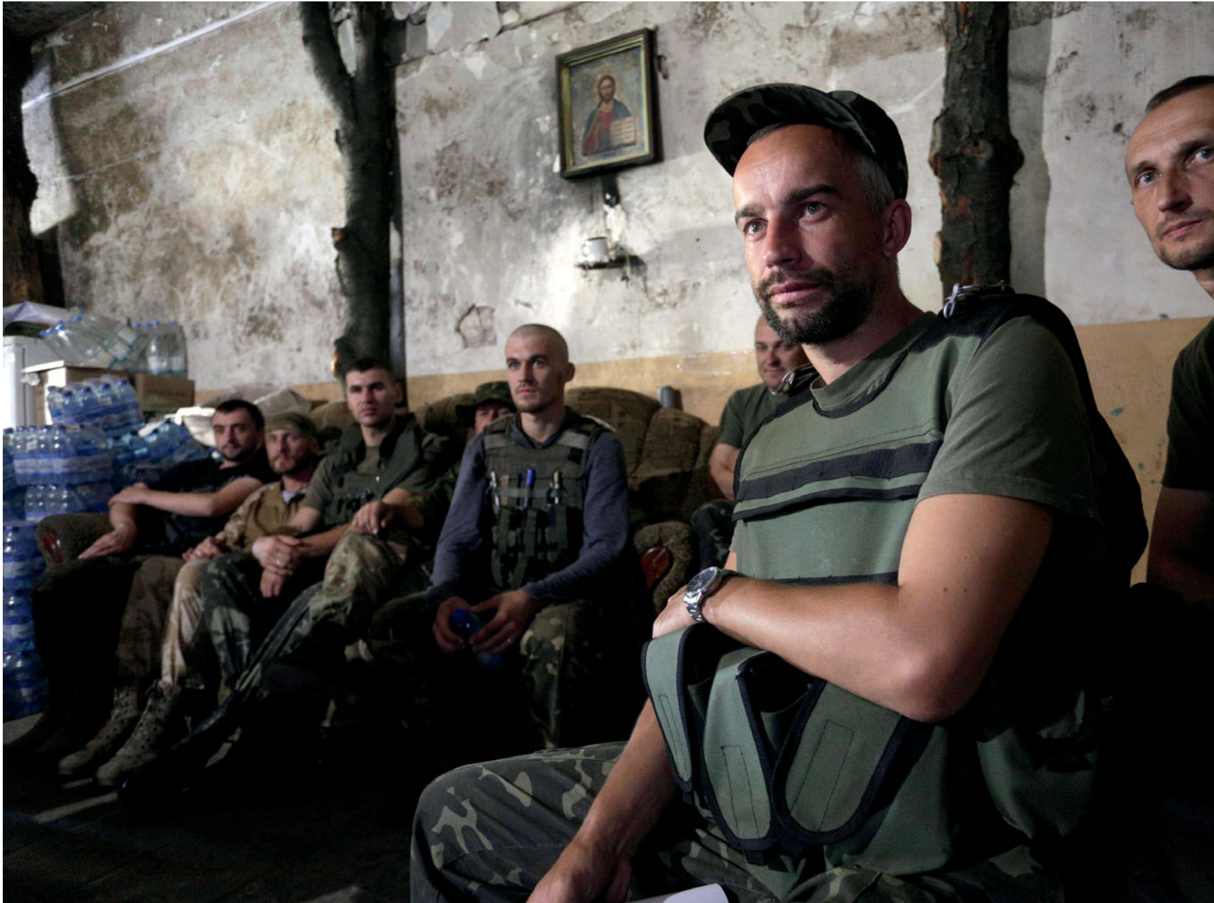
Українські солдати батальйону «Дика качка» на позиції «Зеніт», що поблизу Авдіївки Донецької області, дивляться по телевізору військовий парад до Дня незалежності України. 24 серпня 2015 року.

Ukrainian soldiers of 'Wild Duck' battalion near the memorial to brothers in arms, who have fallen in battle at 'Zenit' position, Avdiivka, Donetsk oblast. August 24, 2015.