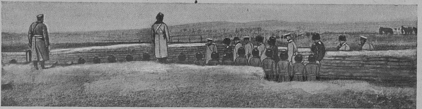
Лѣхота въ передовыхъ окопахъ.

Но вотъ — грянулъ громъ. Севастополь палъ, — и все въ Россіи пережвилось. Цослѣдова-