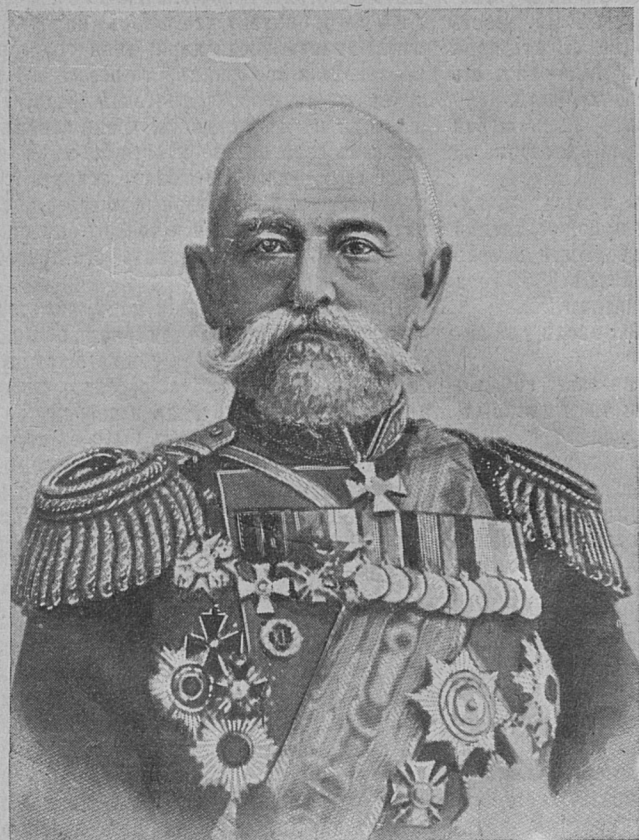
Главномандующій всеми сухопутными и морскими всоруженными силами, дѣйствующими противъ Японіи, генераль отъ-инфантеріи Н. І. Леневиць.