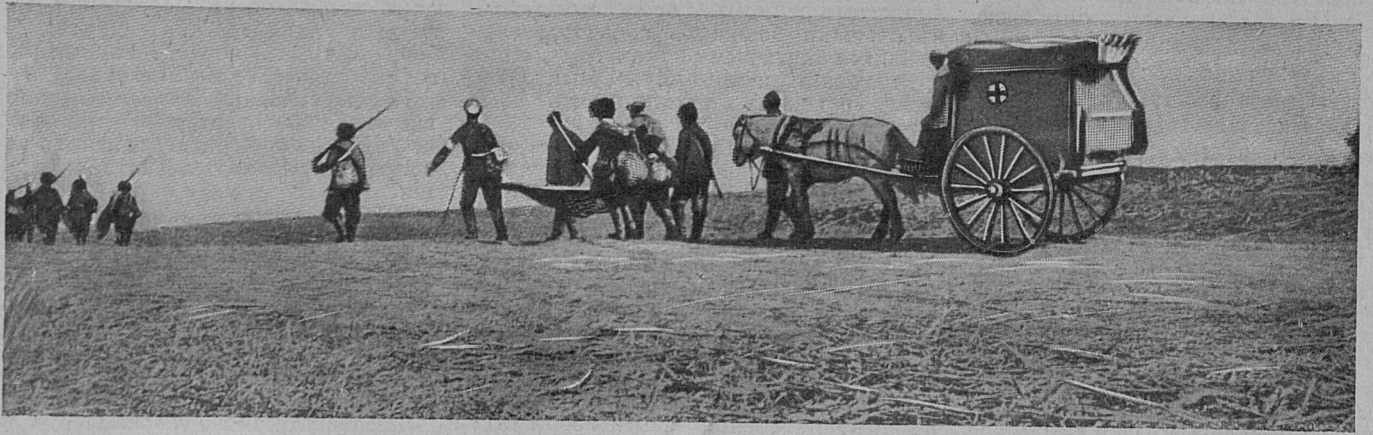
Доставка раненыхъ съ поля битвы.

Но такъ такъ человѣческое сердце, даже если оно обывательское, не всегда способно подчиниться предписаніямъ начальства, то и произошло то, чего ни одинъ кварталный не могъ предвидѣть.