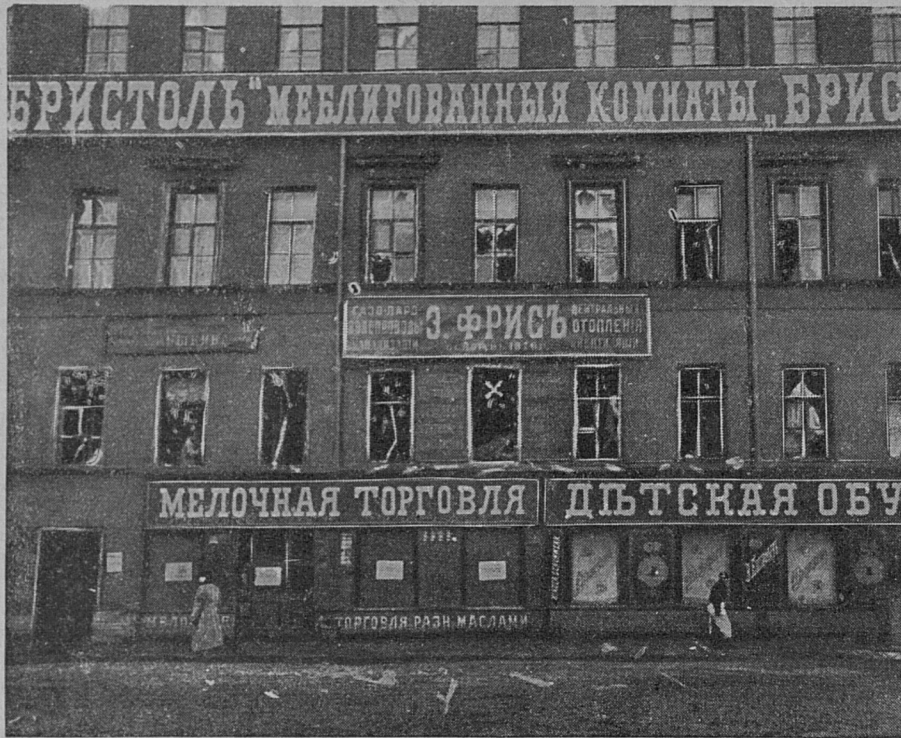
Послѣ взрыва въ гостинницѣ „Бристоль“. Окно комнаты, въ которой произошелъ взрывъ, отмѣчено крестомъ. Со снимка нашего фотографа, автотипія „Биржевыхъ Вѣдомостей“.