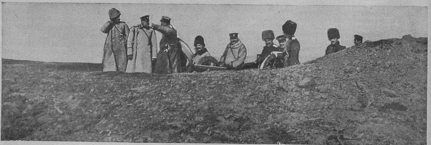
Генераль Леневиць осматриваетъ боевыя позикціи. Къ боямъ подъ Муқденомъ. Съ набросковъ корреспондентовъ, авторшя „Биржевыхъ Вѣдомостей“.

ло освобожденіе крестьянъ, воцарилась правда въ судахъ, введено было самоуправленіе и на первыхъ росткахъ русской гражданственности водворили свое знамя гласность. Но оскорбленіе въ лучшихъ своихъ чувствахъ крѣпостничество тоже не дремало и, возвращаясь мало по-малу къ старымъ позиціямъ, начало окружать себя старымъ испитаннымъ средствомъ — окопами патриотизма. Прошло еще 25 лѣтъ, — и результаты не замедлили сказаться. Знаменитыя хищенія — всѣ