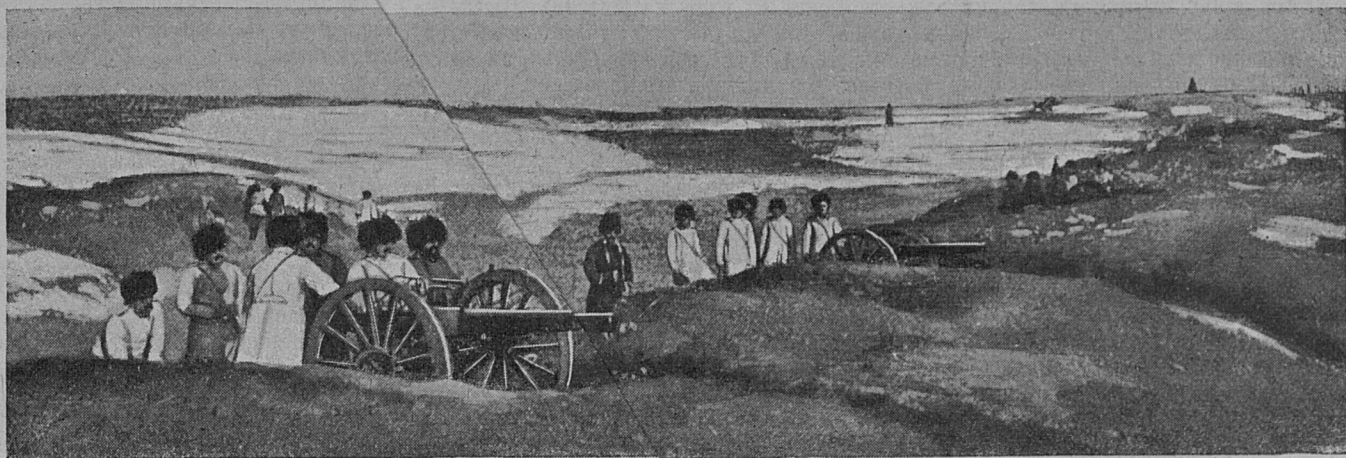
На боевых позиціяхъ на рѣкѣ Шахэ — Артиллерія 1-го сибирскаго корпуса въ ожиданіи атаки.

эти эпопеи съ интендантами, поставщиками, гнилыми подметками и негодными сухарями, — вылившія съ такимъ шумнымъ эффектомъ въ русско-турецкую войну, созрѣли и расцвѣли подъ покровомъ того самаго патріотизма, той самой „благонамѣренности“, которые съ такой ѣдкостью осмѣялъ въ свое время нашъ несравненный сатирикъ.