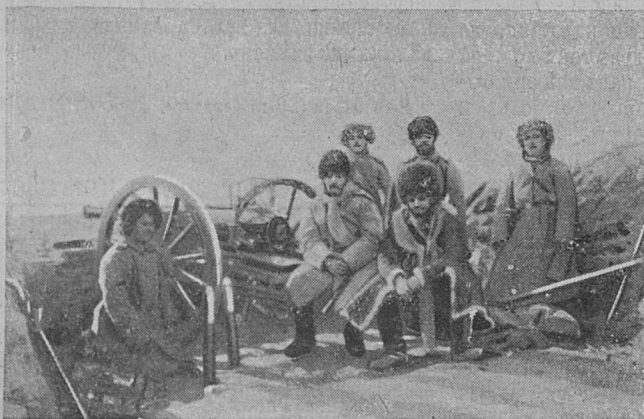
Скорострѣльная батарея въ резервѣ у деревни Кудяза.