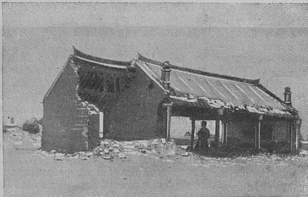
Кумирня, разрушенная японскими шимозами.