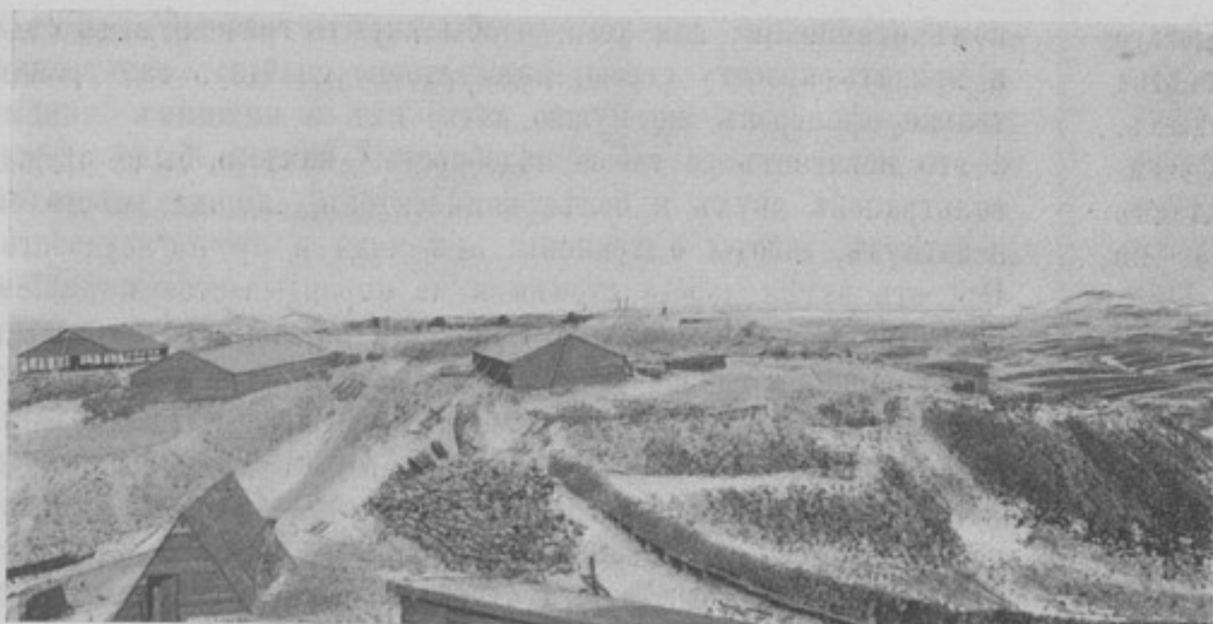
Сухопутный фортъ въ П.-Артурѣ. (Собств. корр.).

съ событіями на театрѣ военныхъ дѣйствій, но съ жизнью западно-европейскихъ государствъ, не говоря уже про Японію. Между тѣмъ, читая газеты, они понимаютъ слишкомъ мало, такъ какъ не знакомы ни съ бытомъ, ни съ нравами иноплеменниковъ, ни съ законами ихъ странъ, а такіе термины, какъ «конституціонная монархія», «парламентъ», «республика», «президентъ» не могутъ не обратить на себя ихъ вниманія и за разъясненіемъ этихъ словъ они обратятся къ лицамъ, которыя сами понимаютъ не совсѣмъ хорошо, а имъ растолкуютъ и того хуже. Обойти этотъ злободневный вопросъ нельзя, такъ какъ каждый день онъ становится все болѣе и болѣе серьезнымъ; поэтому чтенія нижнимъ чинамъ, въ настоящее время, слѣдовало-бы производить почаще, а темы для него выбирать нѣсколько отличныя отъ тѣхъ, какія до сихъ поръ практиковались.