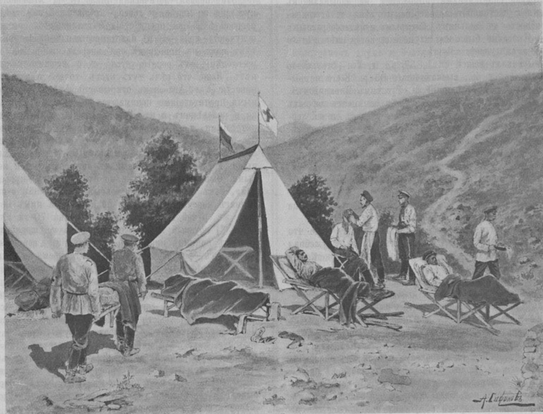
Летучій лазаретъ. Рис. А. Сафонова (собств. корресп.).

водится медицинскій осмотръ, и тѣ изъ нихъ, которые оказались неспособными къ военной службѣ, препровождаются на испытанія въ госпитали или лазареты, гдѣ подвергаются пересвидѣтельствуванію въ особыхъ комиссіяхъ. Въ Циркулярѣ Главнаго Штаба 1886 г. № 85, къ которому приложены правила о порядкѣ пересвидѣтельствуванія подобныхъ новобранцевъ, указано, чтобы войсковые начальники съ особою осторожностью и строгостью относились къ дѣлу отправленія ихъ въ комиссіи. Между тѣмъ изъ практики оказывается, что на испытанія нерѣдко отправляются такіе молодые солдаты, которые, при нѣсколькихъ облегченныхъ занятіяхъ, надлежащемъ отдыхѣ и усиленномъ питаніи, могли бы нести службу. Попадая же въ категорію «опротестованныхъ», такіе молодые солдаты лишаются должной объ нихъ заботливости и затѣмъ, возвращаясь изъ комиссій, остаются неподготовленными.