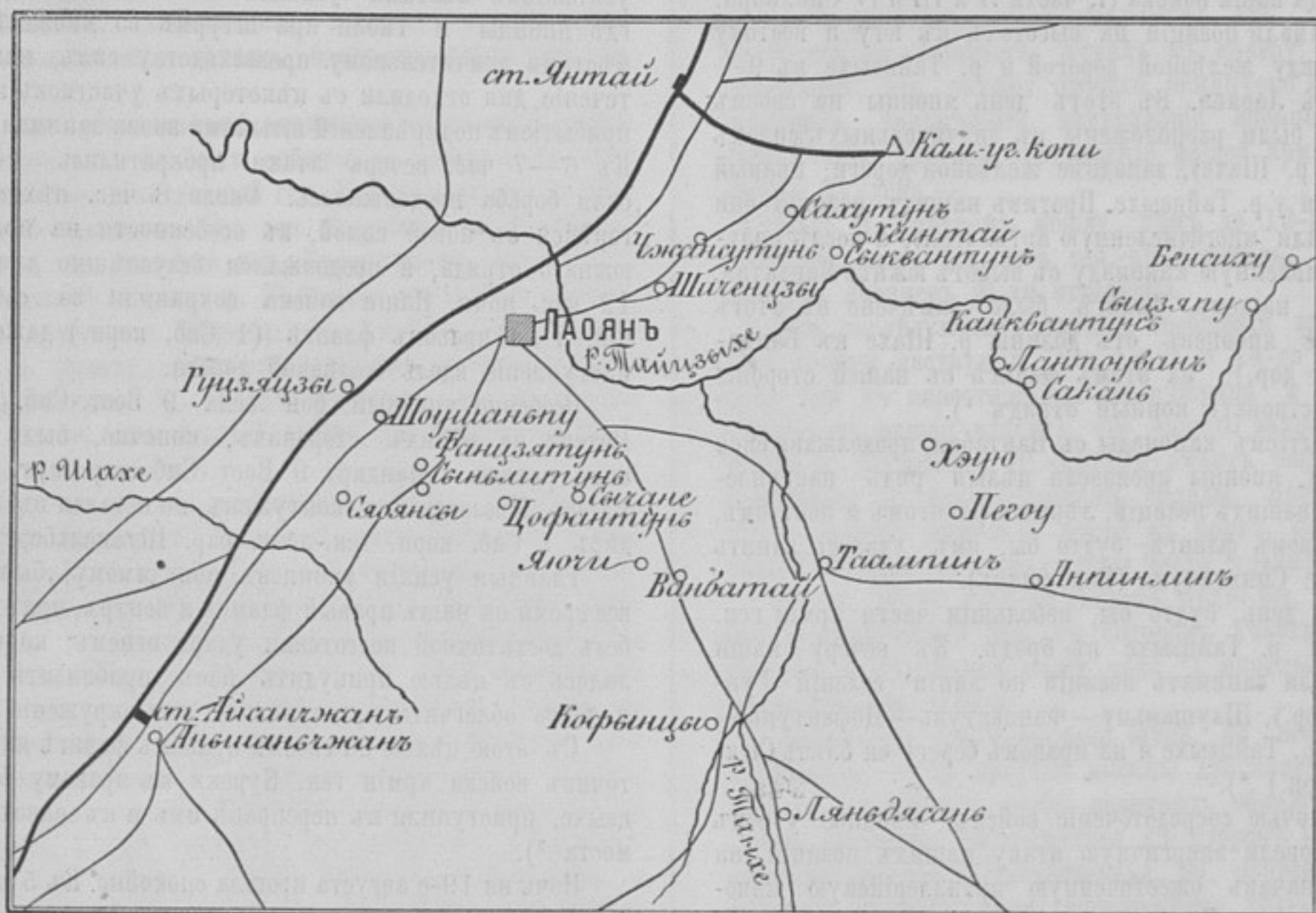
Схема района военных дѣйствій съ 13-го по 21-е августа.

Вотъ при какихъ условіяхъ черезъ 4 мѣсяца послѣ втор-