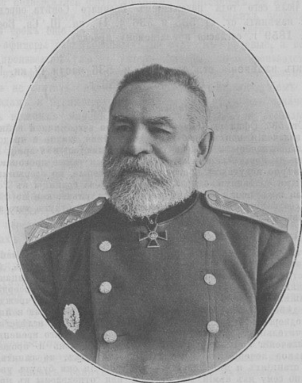
Начальникъ чертежной главнаго инженернаго управленія и завѣдывающій кондукторской школой, военный инженеръ, генераль-маіоръ

Родился 21-го октября 1851 г. Образование получилъ въ Орловской классической гимназіи и въ Константиновскомъ военномъ училищѣ, откуда по окончаніи курса, 11-го августа 1871 г., произведенъ изъ фельдфебелей въ подпоручики, съ прикоманди-