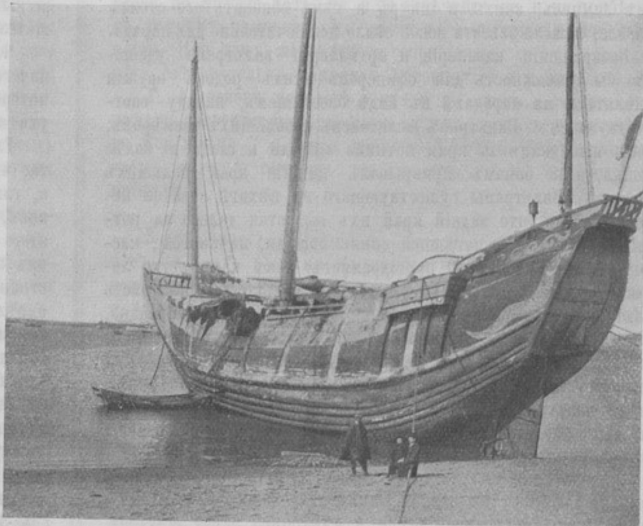
Китайская (нингносна) джонка подъ японскимъ флагомъ, для высадки десанта въ мелкихъ бухтахъ китайскаго побережья (она можетъ выбрасываться на песокъ).