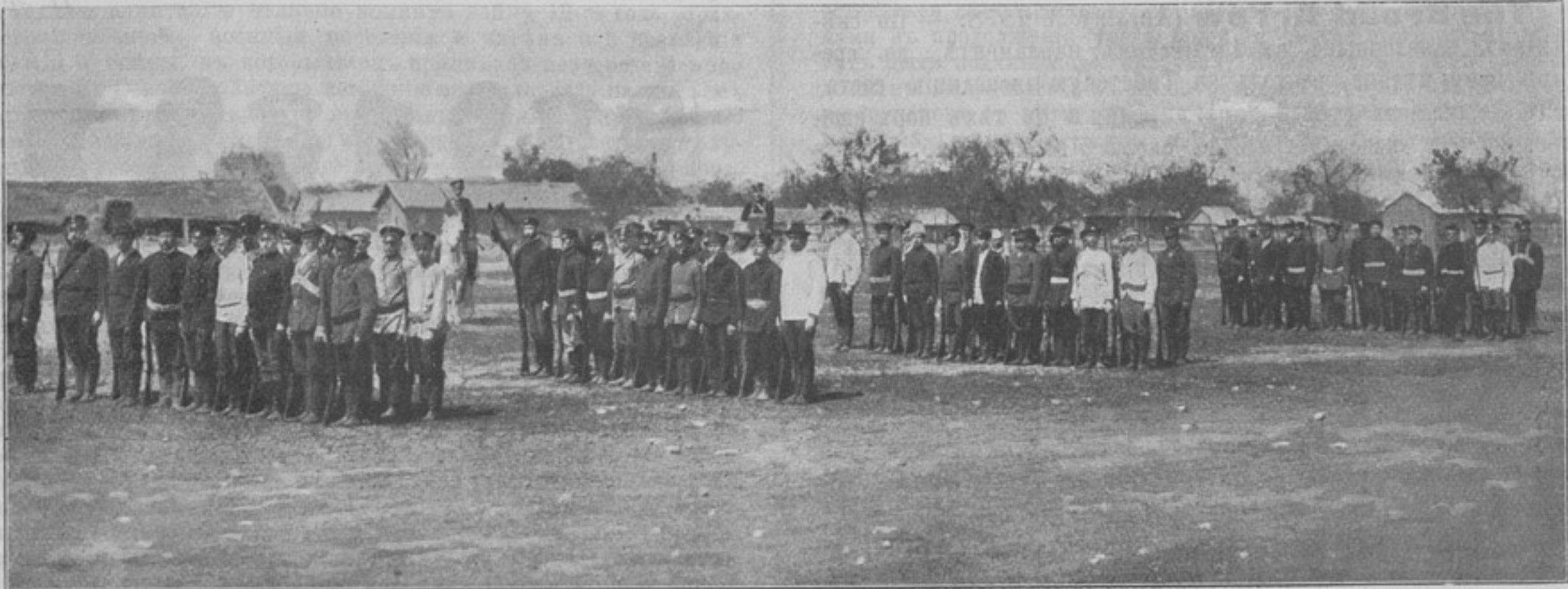
Желантунская вольная дружина (къ корр. «ст. Желантунь», собств. корресп.).

Ст. Желантунь (Кит.-Вост. ж. д.). 12-го юнія наша станція, до сихъ поръ не тревожимая ни японцами,