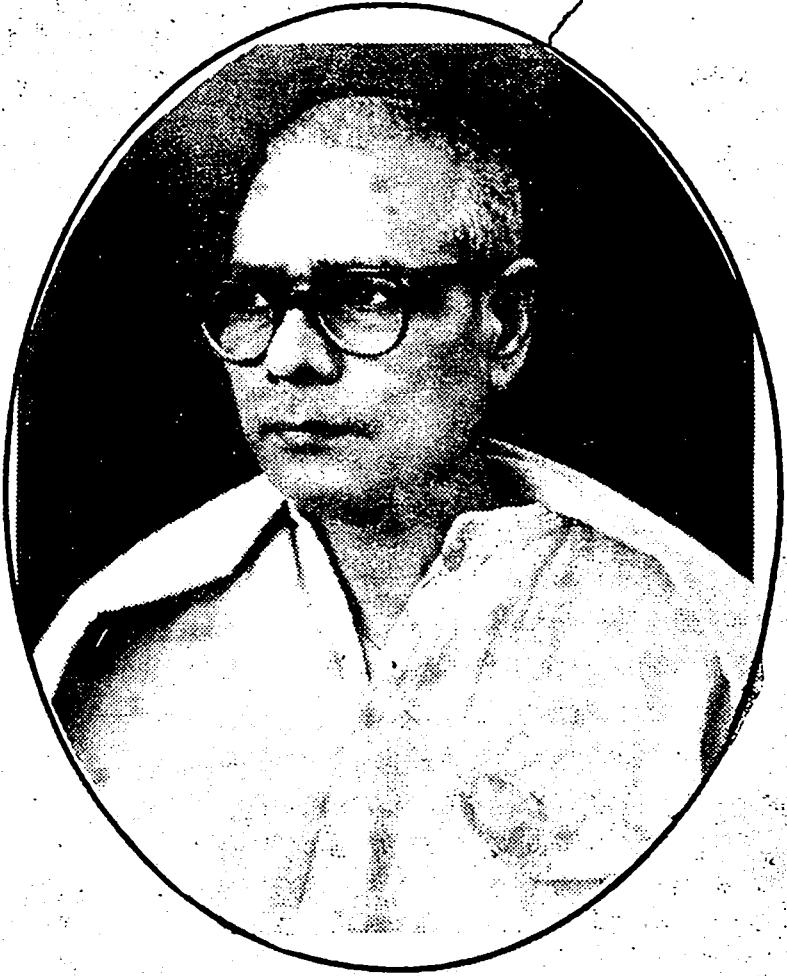
हैदराबाद स्वातंत्र्य संग्रामाचे नेते स्वामी रामानंद तीर्थ