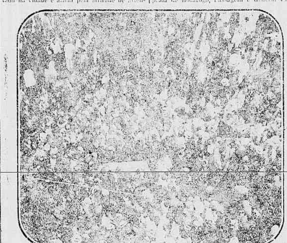
No largo da Carioca, quando o enterro mortuario era conduzido a mão