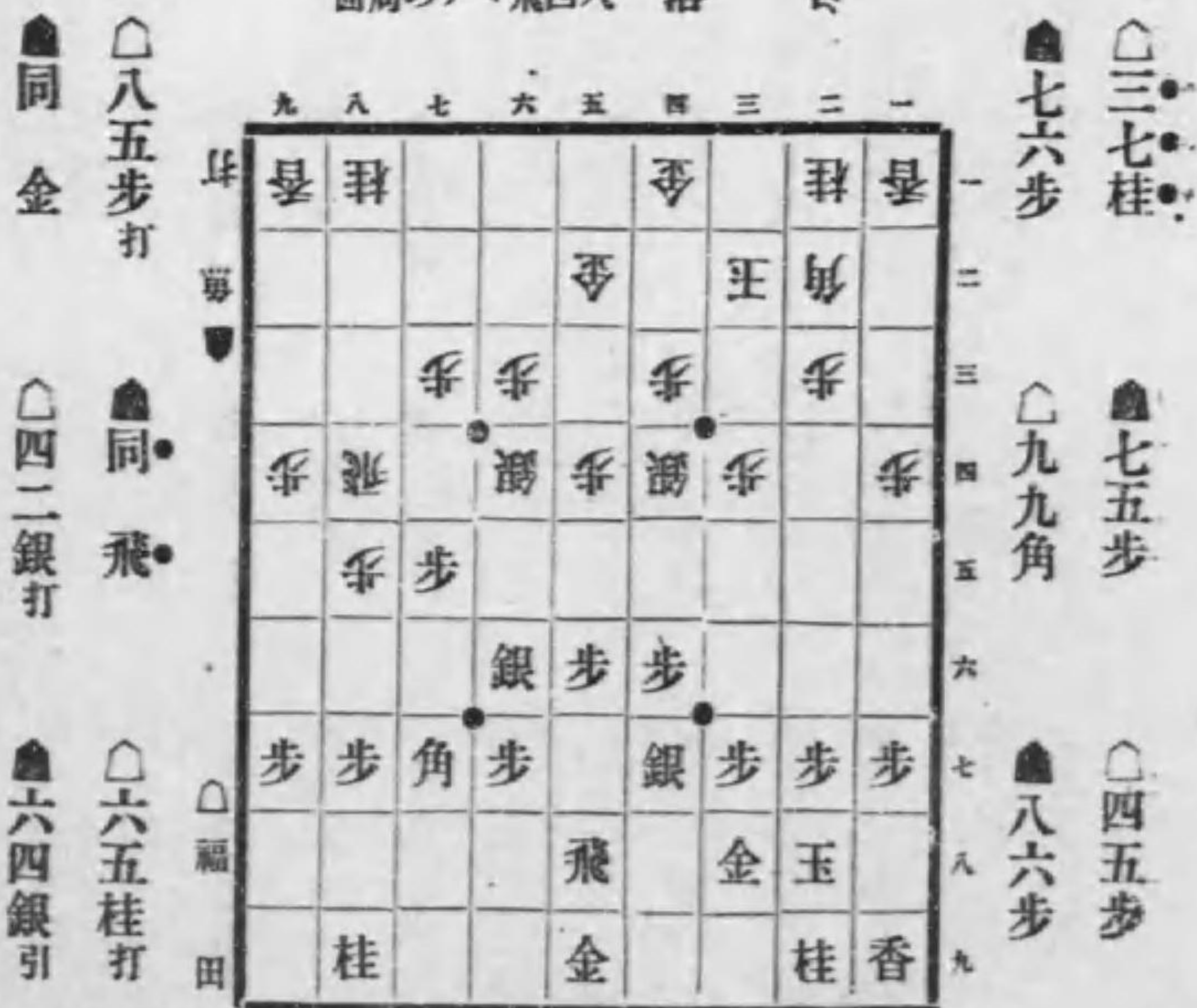
香落 八四飛マテの局面