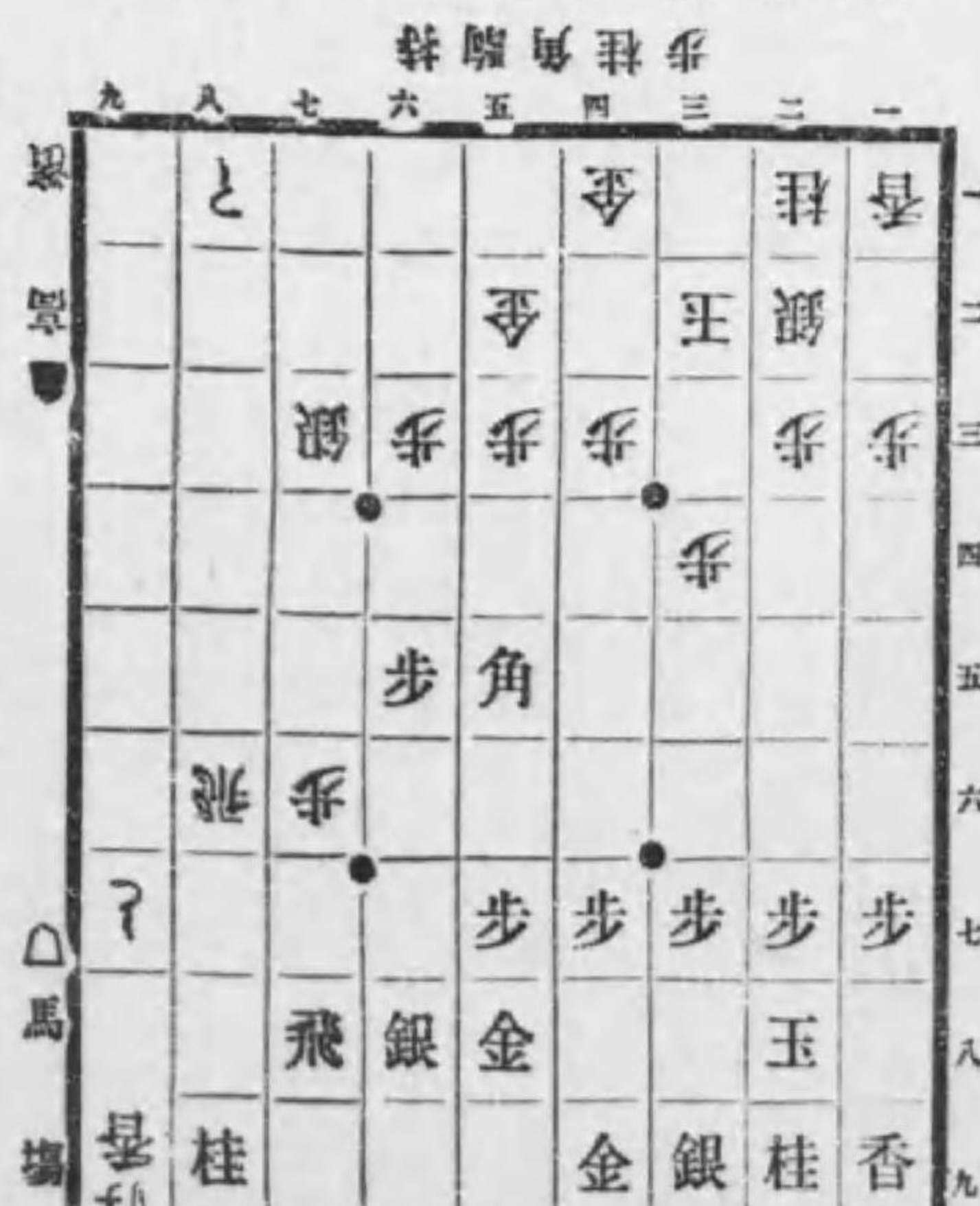
面局のデマるな歩七九落香左