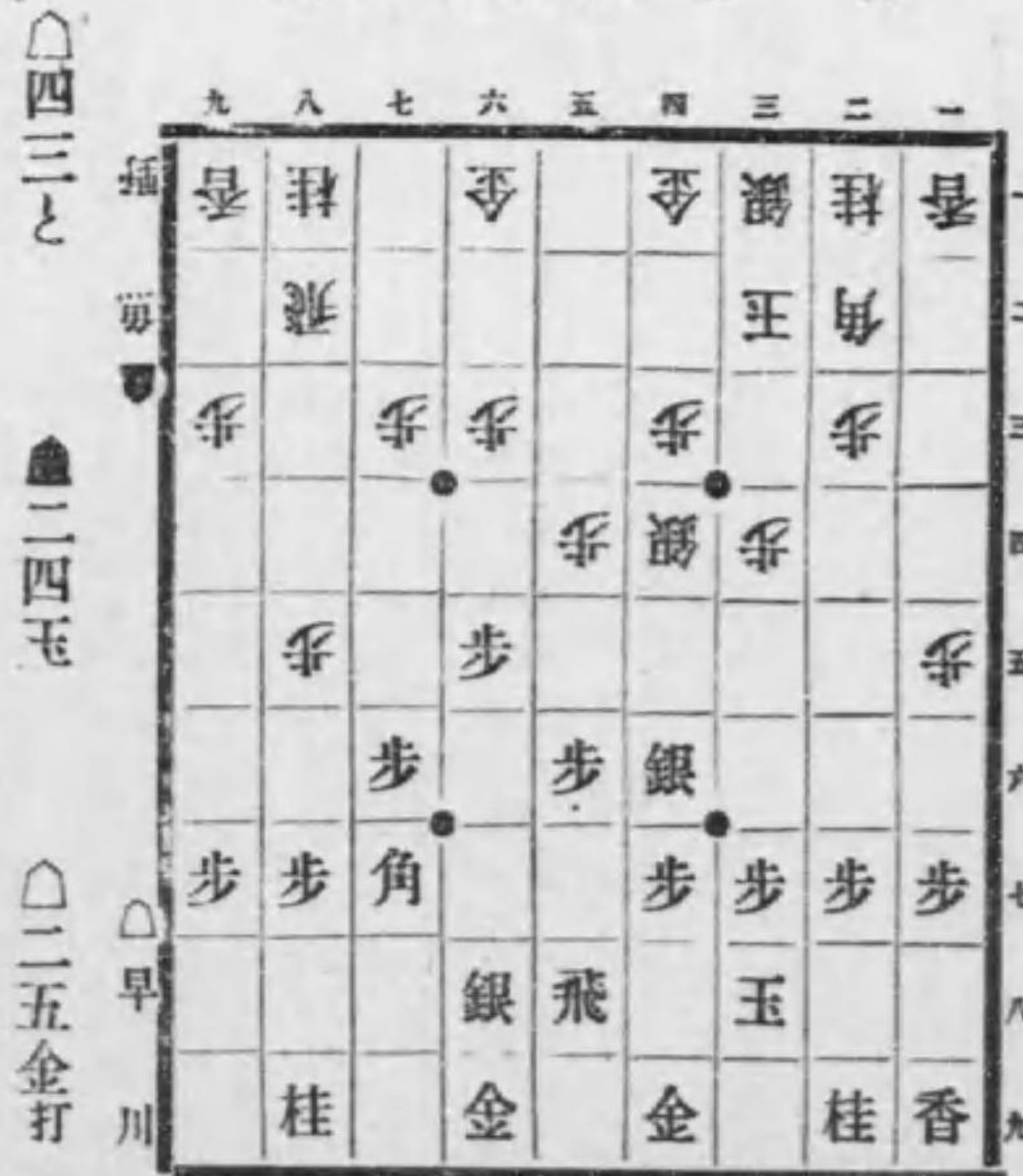
香落 三玉八玉のテマ局面