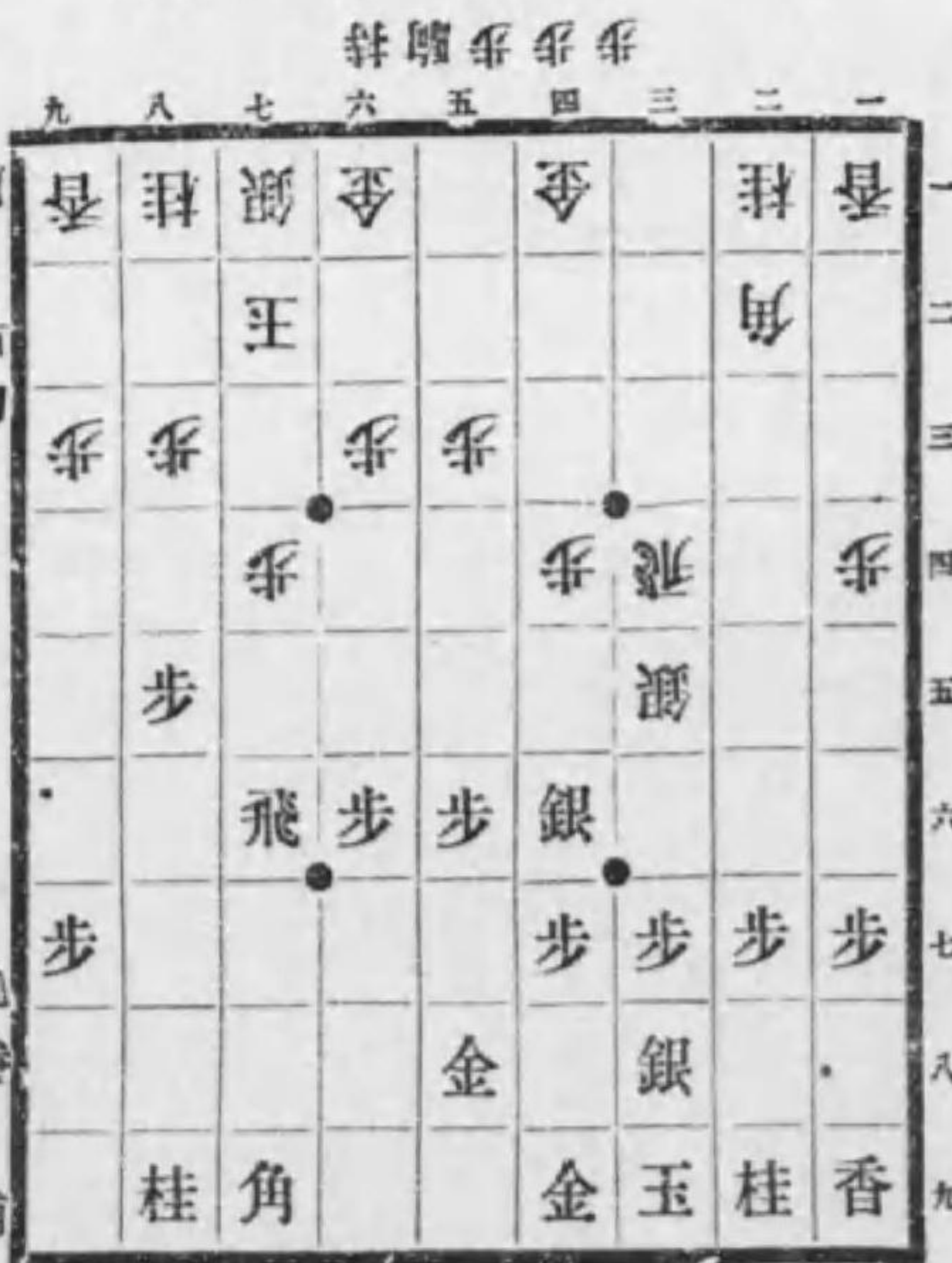
香落 四六銀の局面