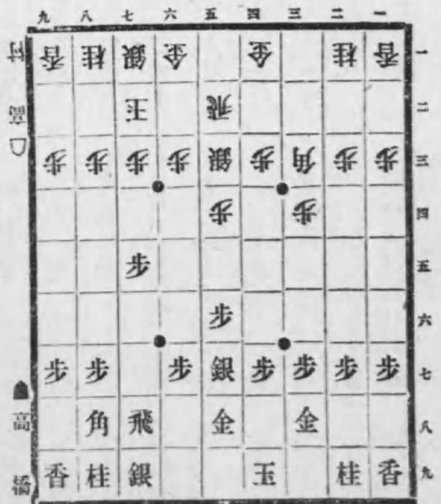
平手 七五歩打マテの局面