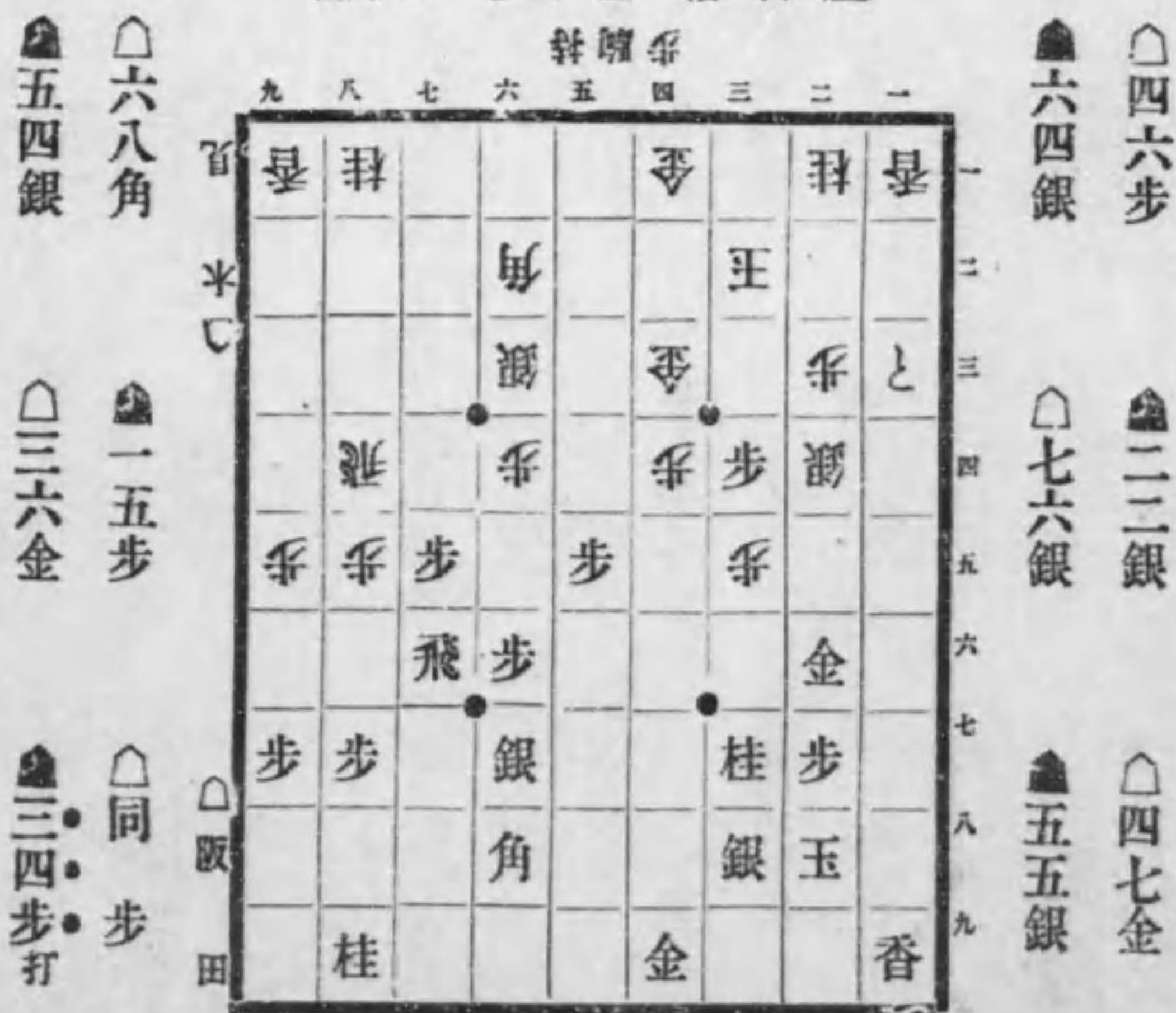
面局のデマ歩三一△落香左