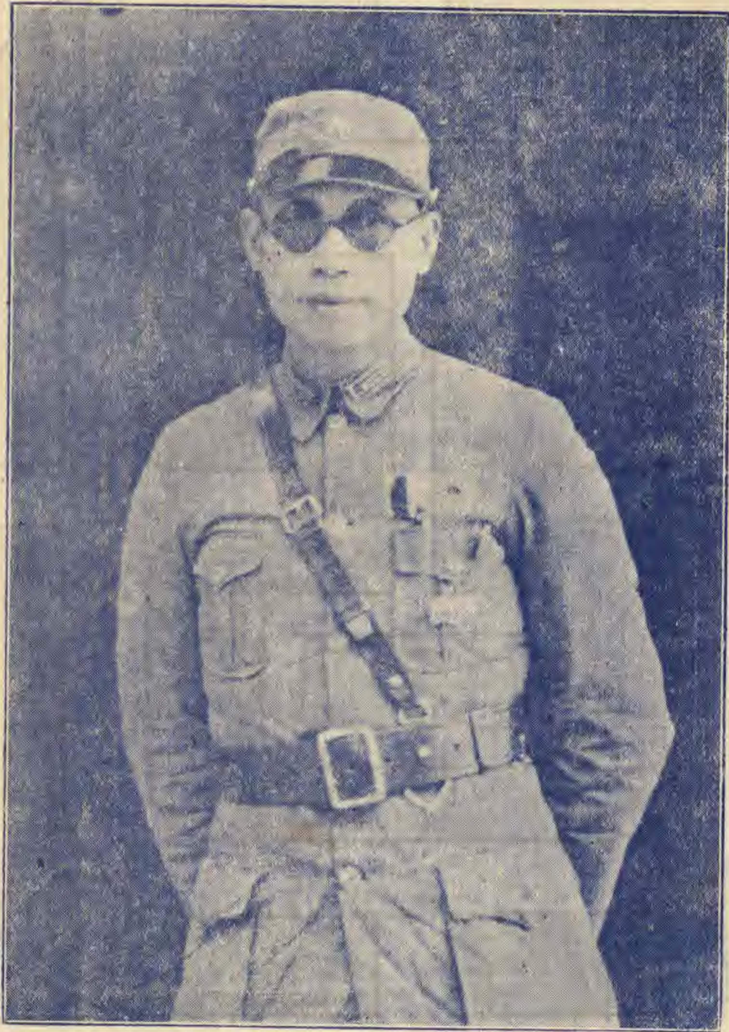
宜北縣縣長李長志肖像