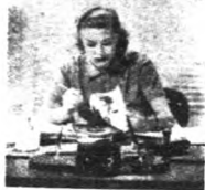
(本文原作者琴·速羅·傑斯)

最奇怪的珍妮對於交女朋友的意思跟我完全相同。她一直只有兩個真正的好朋友，一個是瑪格烈林賽，一個便是我。我們在一起的時候，有說不出的樂趣。在珍妮海邊的別墅中，大家游泳或者是臥在沙上。