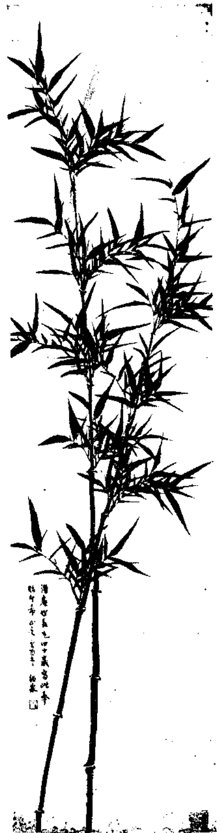
Bamboo in ink by Mr. Yü Yueh Yuan