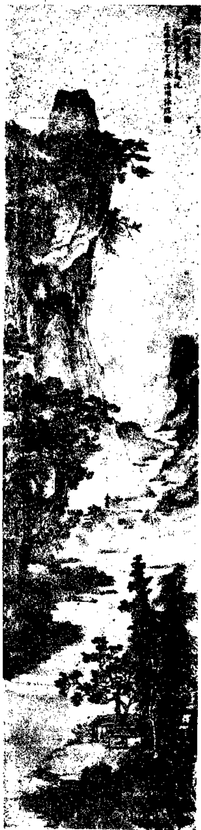
Landscape by Mr. Chang Shan Hu