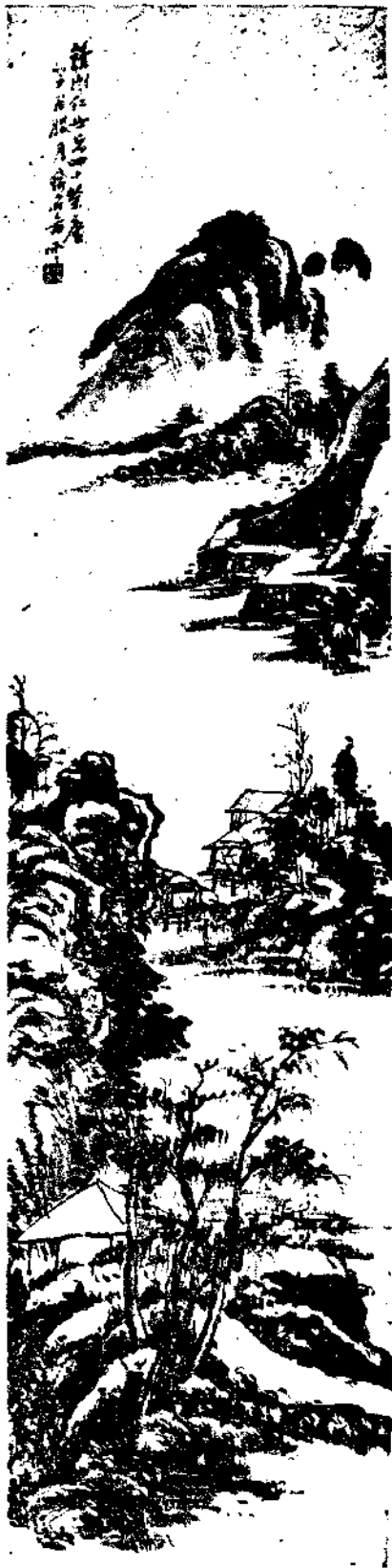
Landscape by Mr. Yü Show Shan