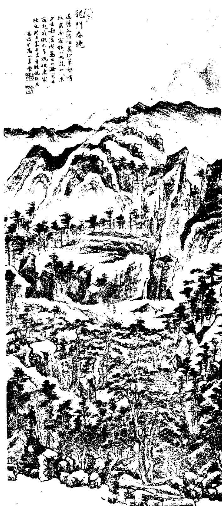
Landscape by Mr. Feng Chao Jan

此畫乃清江先生所畫 以筆蘸墨作山石 之勢 其法與前畫不同 其法與前畫不同 其法與前畫不同