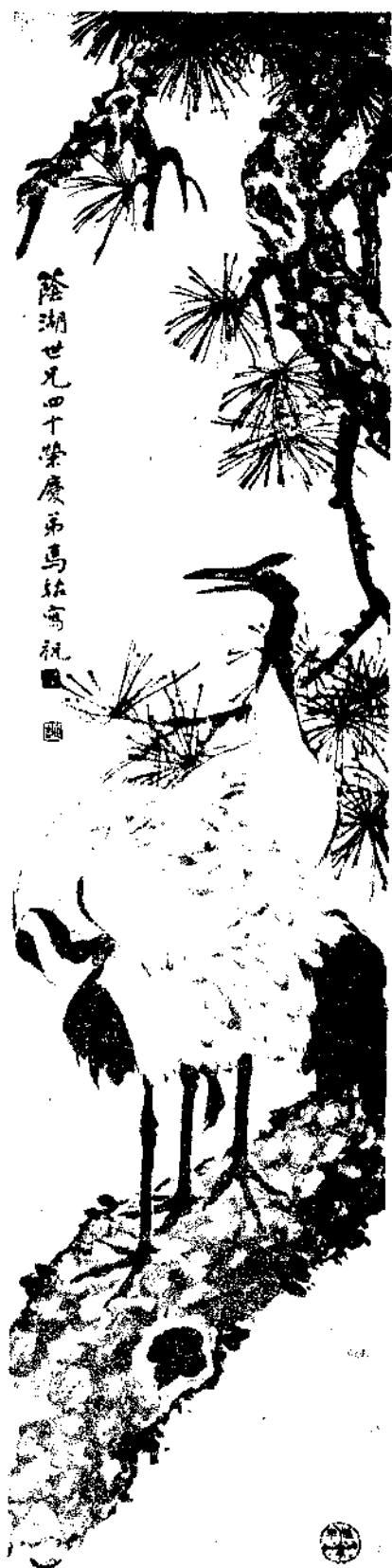
陰湖世兄四十榮慶弟馬企周祝