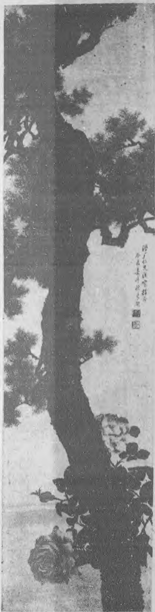
Roses and pine by Mr.