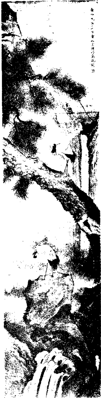
Pine and stork by Mr. Pu Sung Chong