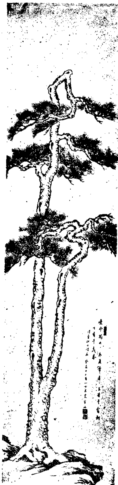
Pines by Mr. Chen Tao An