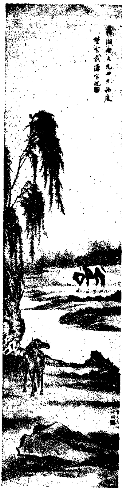
Two horses by Mr. Tai Yeh Yün