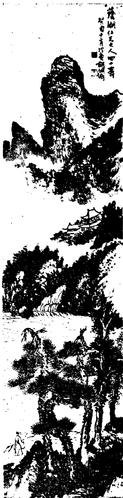
Landscape by Mr.