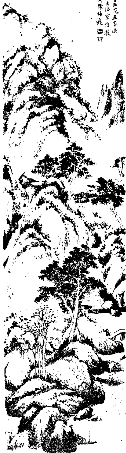
Landscape by Mr. Chen Hui Chi