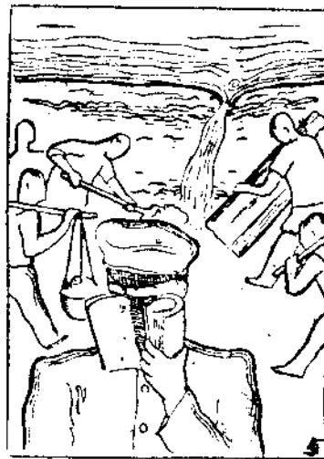
(5) 洪水不築堤—會考更重要。