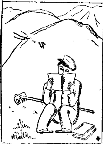
(4) 荒山不種樹—會考更重要。