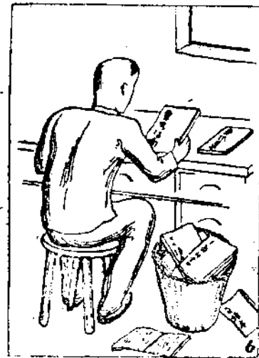
(6) 「會考指南」逼着教科書退位。