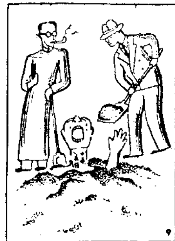
(9) 中華民族活埋在考官手裏!