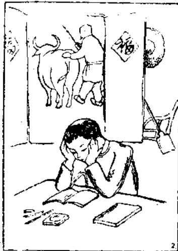
(2) 兒子趕考的旅費—老子賣耕牛。