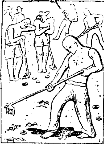
(1) 會考的經費—農人揮血汗。