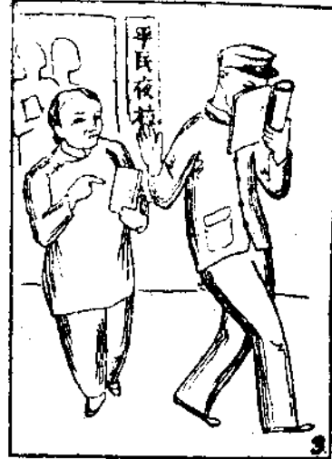
(3) 文盲不掃除—會考更重要。