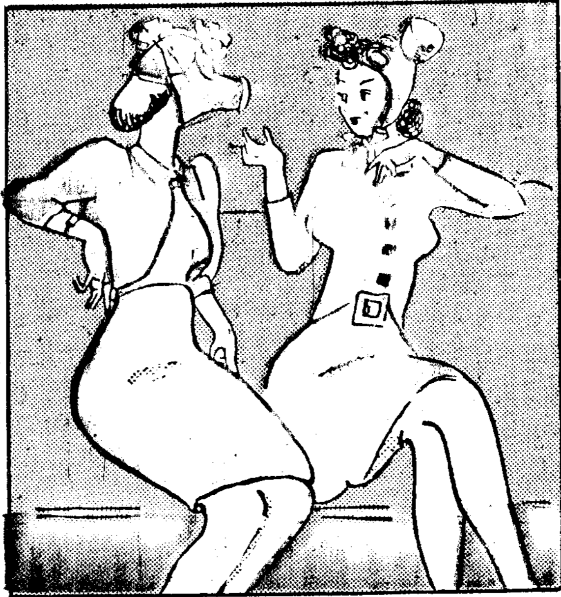
戴防毒面具者：「以我的意思不是反轉來戴，樣子要好些。」