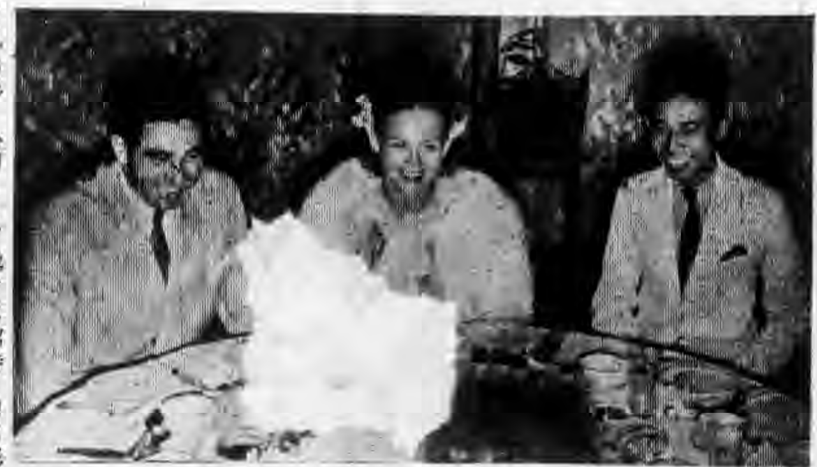
邵氏兄弟影公司十八位男女招待員招待三名合夥人