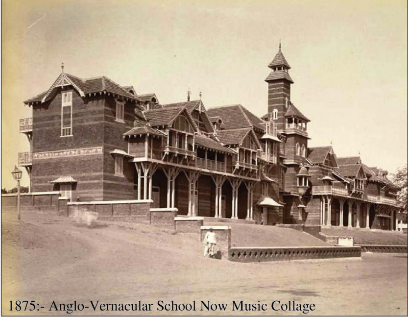
1875:- Anglo-Vernacular School Now Music Collage