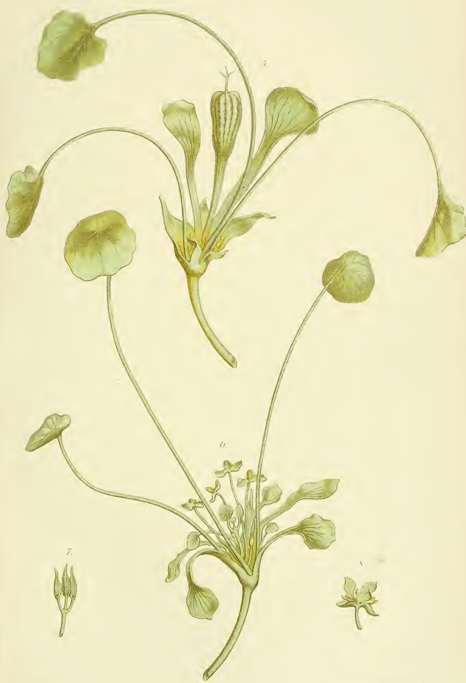
Tropaeolum majus Vergrößerung