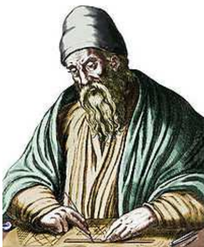
Euklid (4. Jahrhundert v. C.)

Der folgende Satz wird Euklid zugeschrieben.