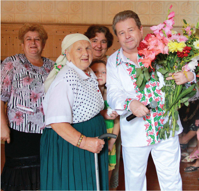
«Жінки України — життя березині! Стаю на коліна, люблю вас незмінно...»