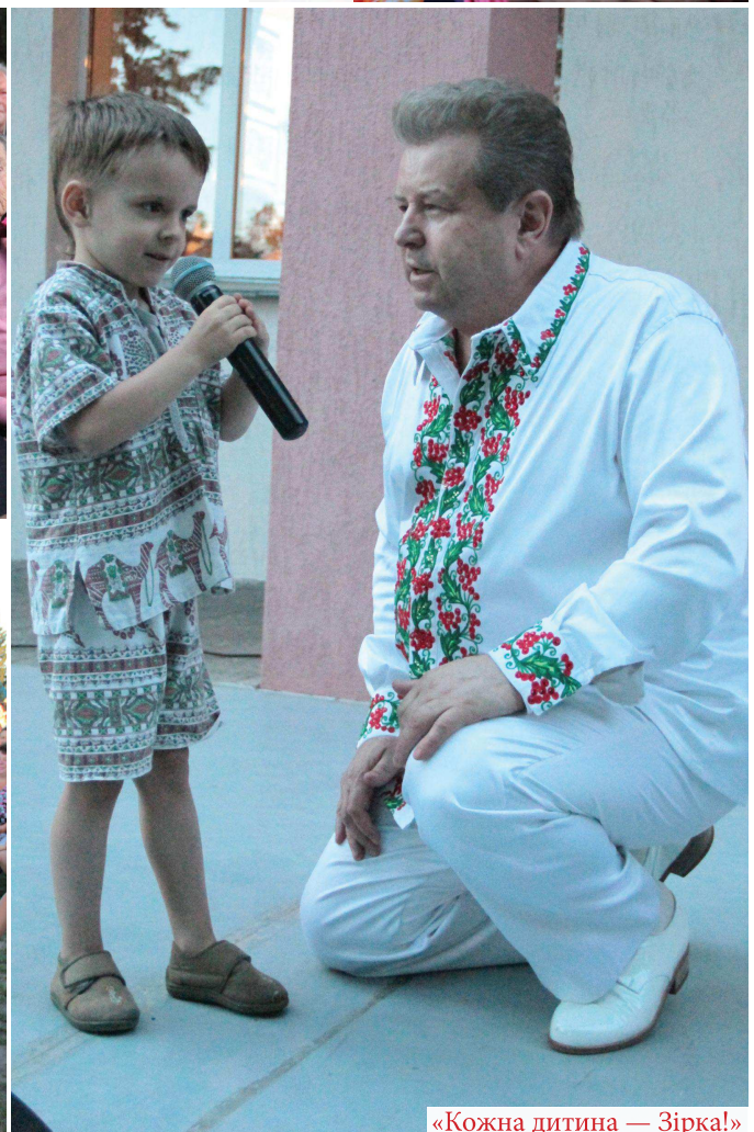
«Кожна дитина — Зірка!»