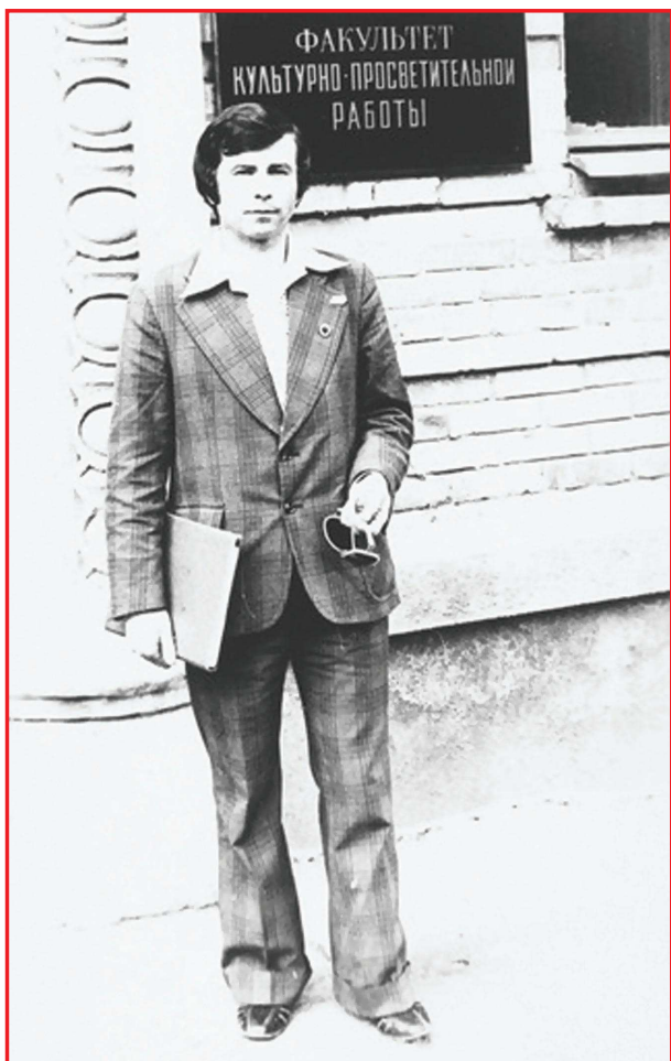
Студент I курсу Київського державного інституту ім. О. Є. Корнійчука

2012 — продюсер, автор ідеї та головний режисер телемарафону української пісні «Пісня об'єднує нас!», який тривав 110 годин, 4 хвилини 30 секунд і ввійшов до Книги рекордів Гіннеса в номінації «Найтриваліший телемарафон української пісні у прямому ефірі».