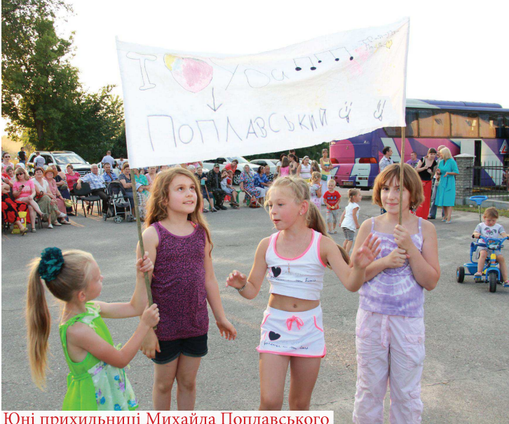
Юні прихильниці Михайла Поплавського