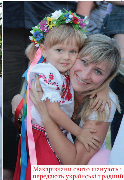
Макарівчани свято шанують і передають українські традиції