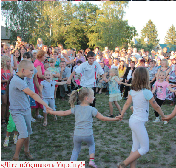
«Діти об'єднують Україну!»