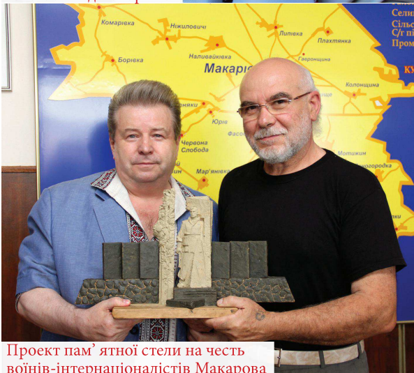
Проект пам'ятної стели на честь воїнів-інтернаціоналістів Макарова