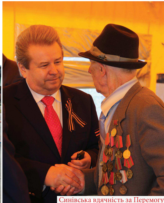
Синівська вдячність за Перемогу