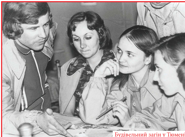
Будівельний загін у Тюмені

1993 — призначений ректором Київського державно-