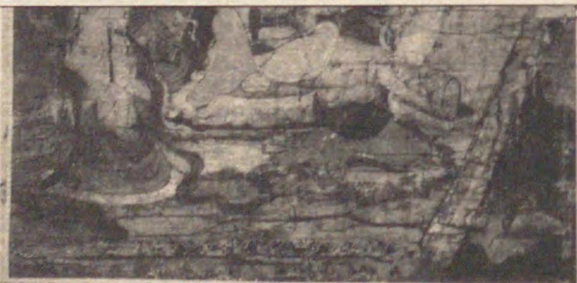
日當住寂空代修復之 道場常住物