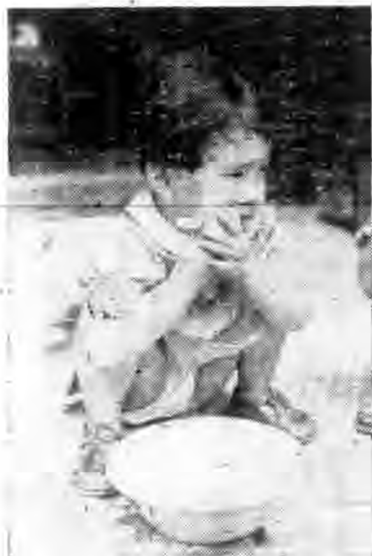
洗 洗 臉