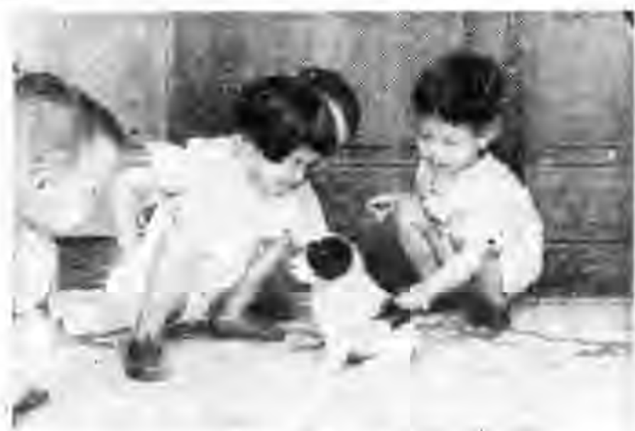
玩 小 狗