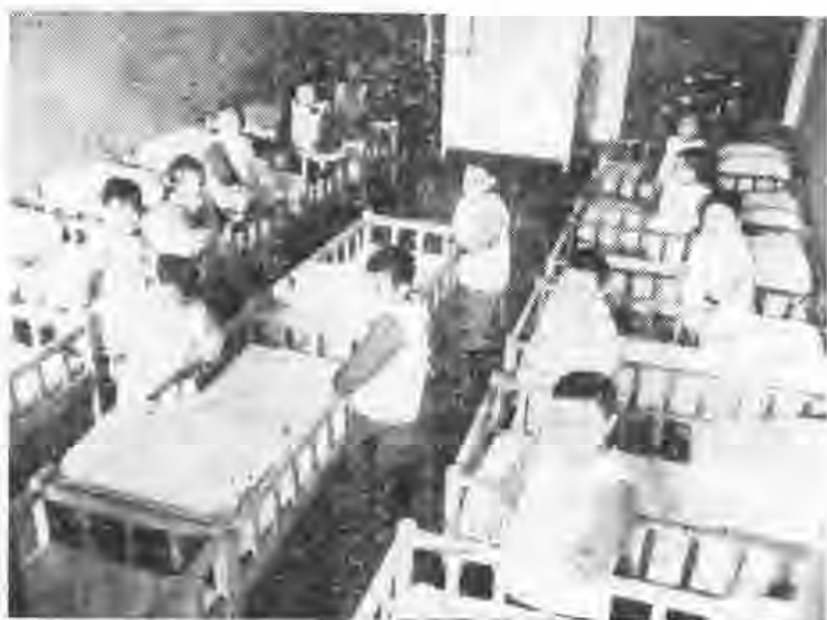
上海女青年會托兒所