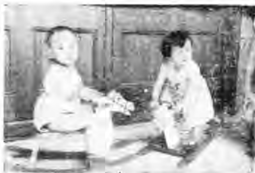
騎 木 馬