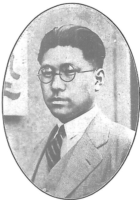
熙田武問顧會持維方地京北