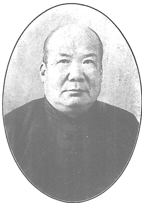
北 京 市 社 會 局 局 長 李 石 芝