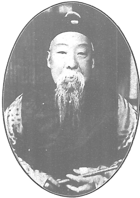
北 京 市 市 長 兼 館 長 江 宇 澄