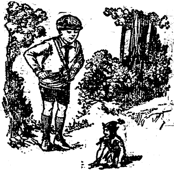
◦ 服衣綠黃着穿人小的異奇個見看烈業