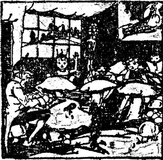
伊爾夫先生的學校