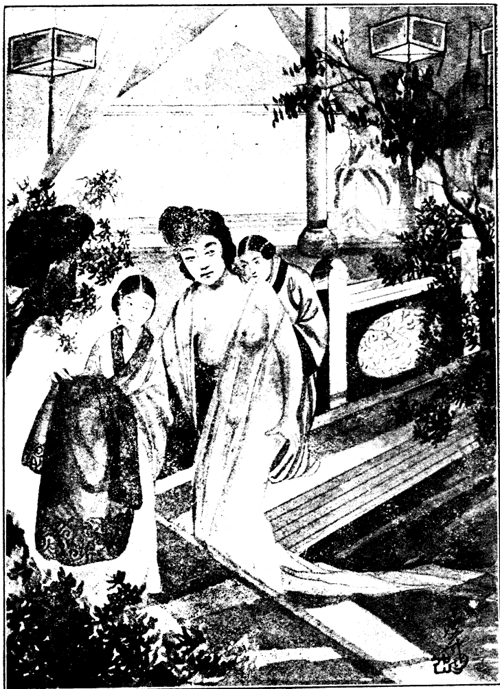
( 妃 貴 楊 )