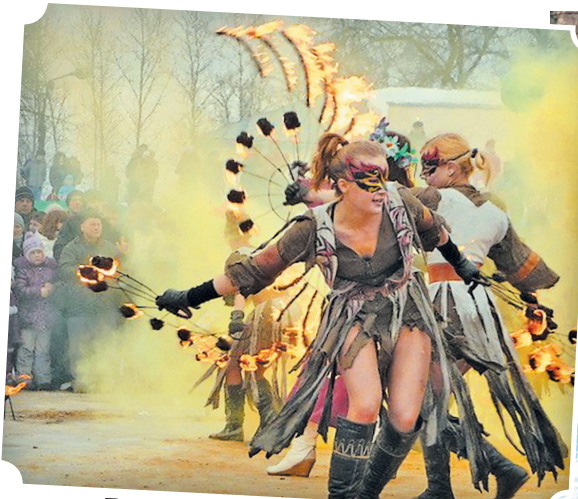
Праздник снега и огня (4 января)