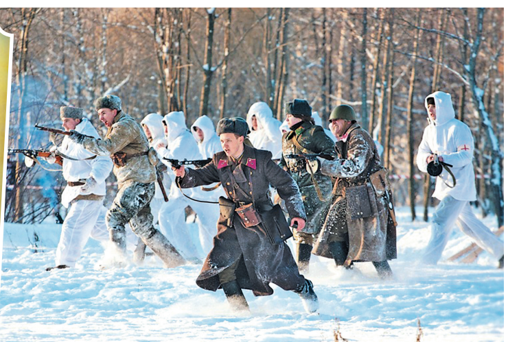
День ворошиловского стрелка (3 января)