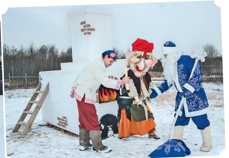
«Рождественская сказка», каша из топора (7 января)