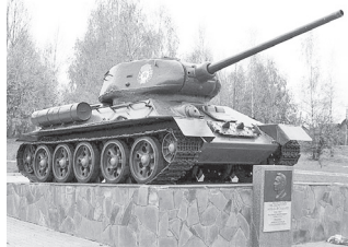
Подготовила Юлия НИКУЛИНА

- Больше танков - больше памяти пахшим за Родину воинам, - подытожил мэр. - Танк останется на месте, а к «Славичу» поставим другой.