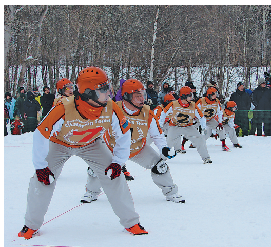
Открытый чемпионат по снегоболу (5 января)