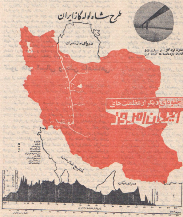
شماره ۱ به ۱۰۰ در سیدی بناب ایران روزنامه ها گشت است