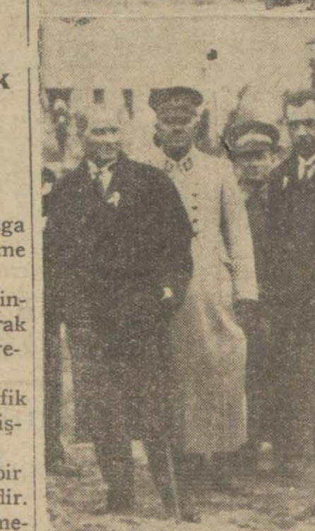
Orman çiftliğinin senesi devriye münasebetile yapılan merasimden iki intiba.

İsminin yazılmamasını rica eden doktor meb'uslarımızdan biri de tedavi ücretleri için tarife yapılmasını lüzumsuz gördü