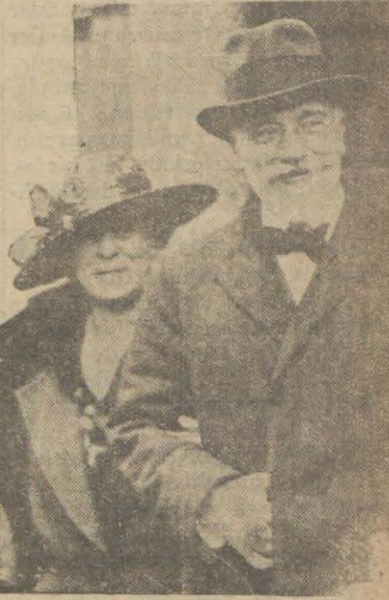
Türkiye ile bütün hesaplarını tasfiye ettiğini söyleyen fakat mübadele meselesini unutan M. Venizelos

Yeni harpler yapılmamasına imkân yoktur. Şimdiki hudutlarımız bize yeter..