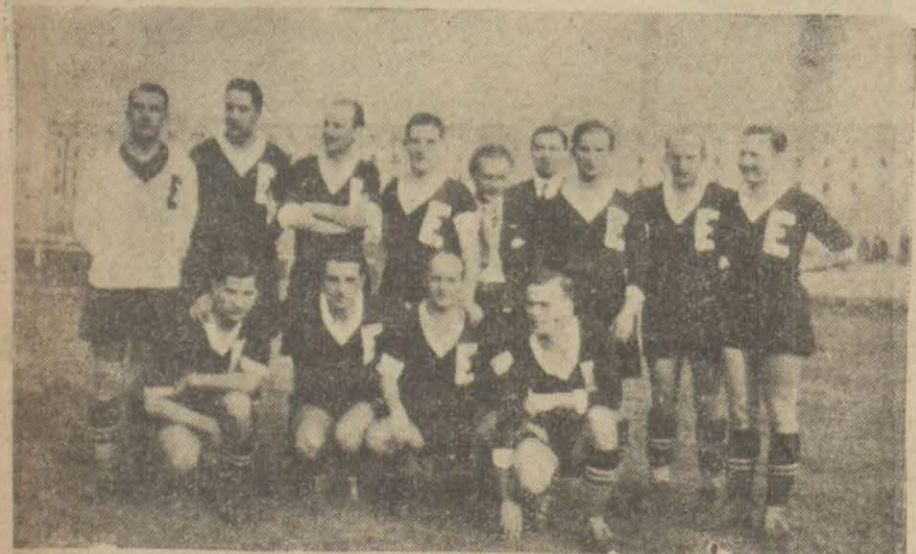
Bayramda şehrimizde üç maç yapmak üzere Peşieden gelmesi beklenen Macar futbolcuları

İlk maç cuma günü Fenerbahçe ile yapılacak..