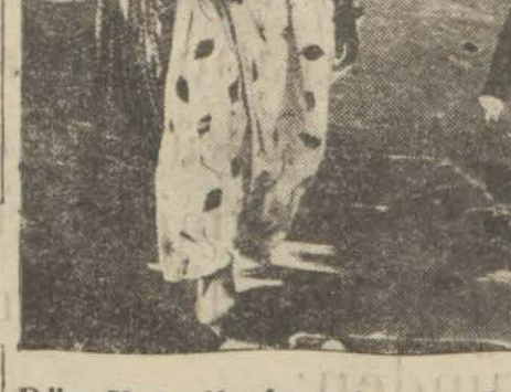
Dün Hidrellezin safasını sürenler ve iki Hidrellez şenliği!

Gayri mübaddiller cemiyeti heyeti idaresi dün haftalık içtimasını yapmıştır. Dünkü içtimada bazı evrak intaç edildikten sonra aza arasında hükümete arz edilecek bazı temenniyat etrafında müzakerat cereyan etmiştir.