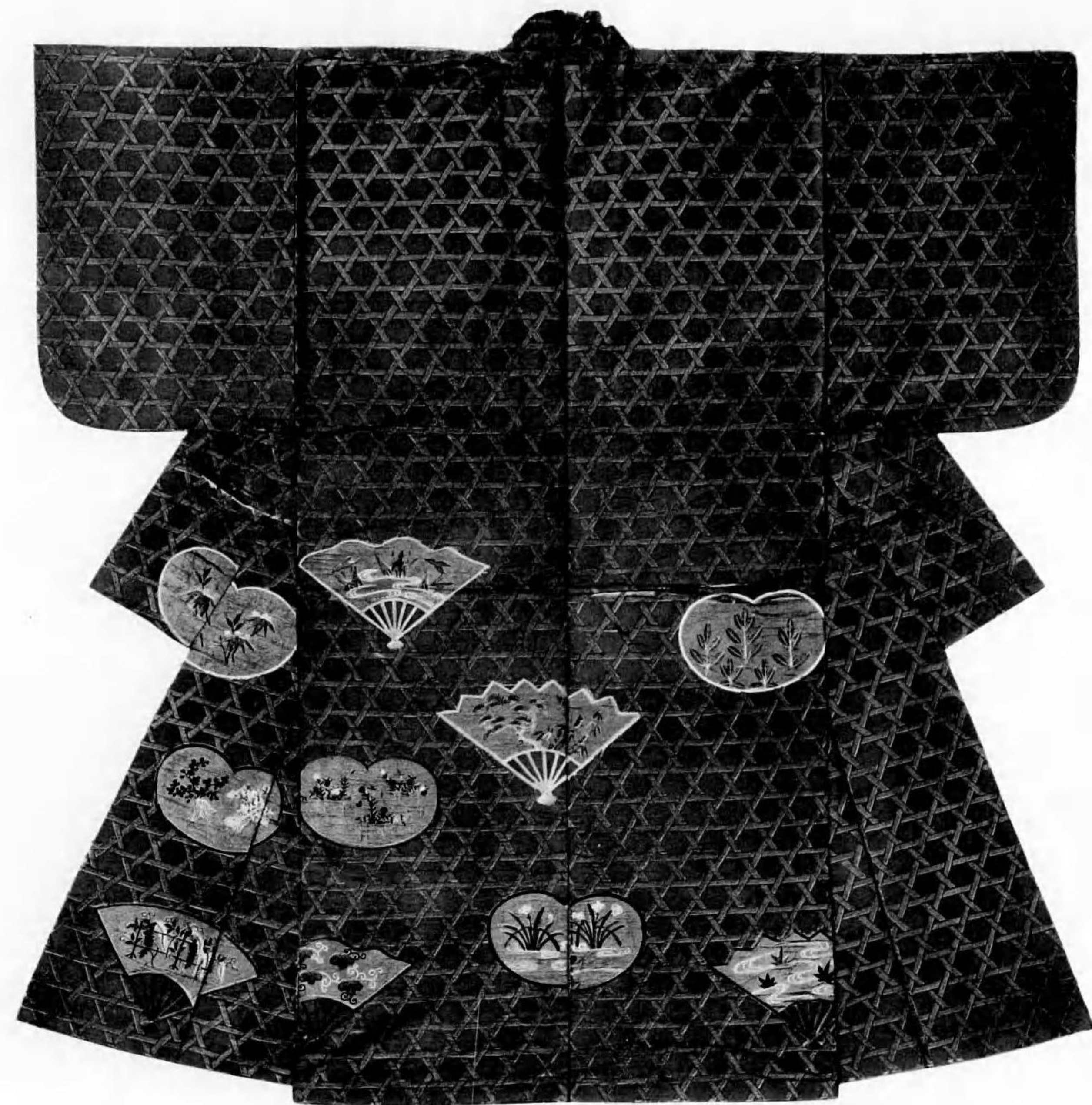
73 黒地に幾何学文様の 着物