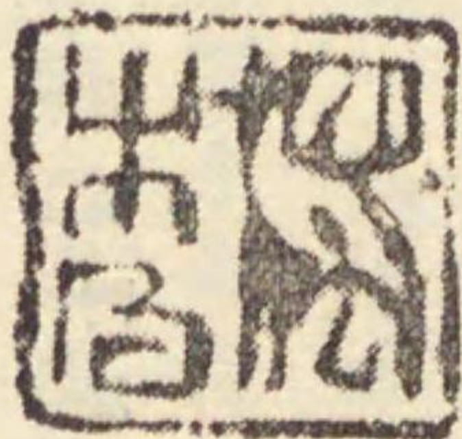
○美濃崇福寺所藏 乾才獨畫像贊