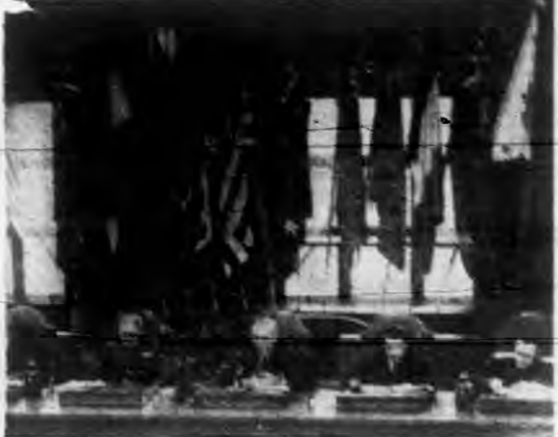
▲遠東國際軍事法庭庭內對日本第一戰犯東條英機時之情形。