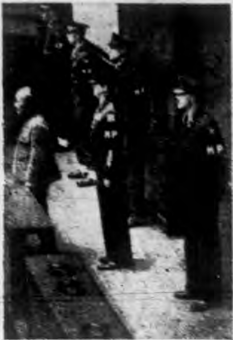
▲東京國際軍事法庭庭內對日本第一戰犯東條英機時之情形。