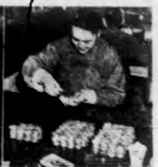
▲政府自十一月二十二日起開始對全地及取警。圖為上海中央銀行內行員↑發之新幣之全條，以發售出，買者在窗口守候(左)，及行員將新幣點數之情形。