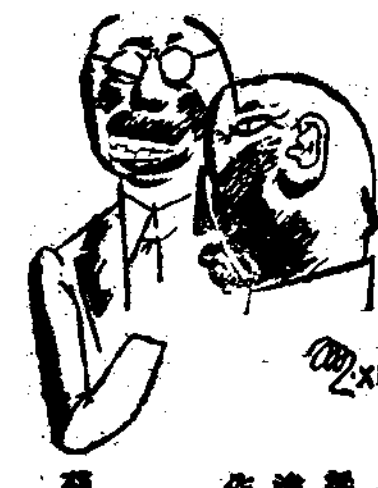
畫 作 津 榮