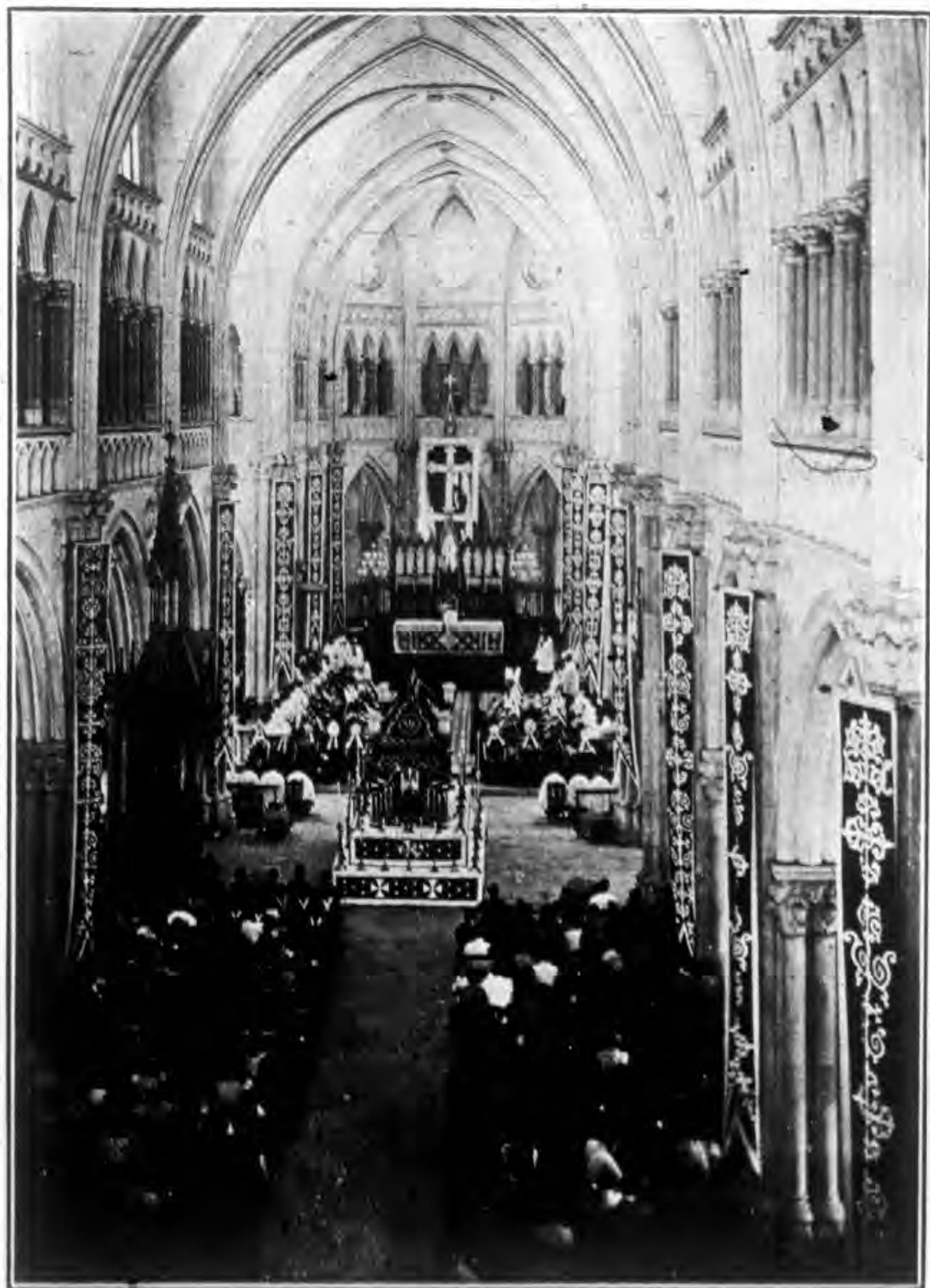
公會議員追思在華已亡眾主教影