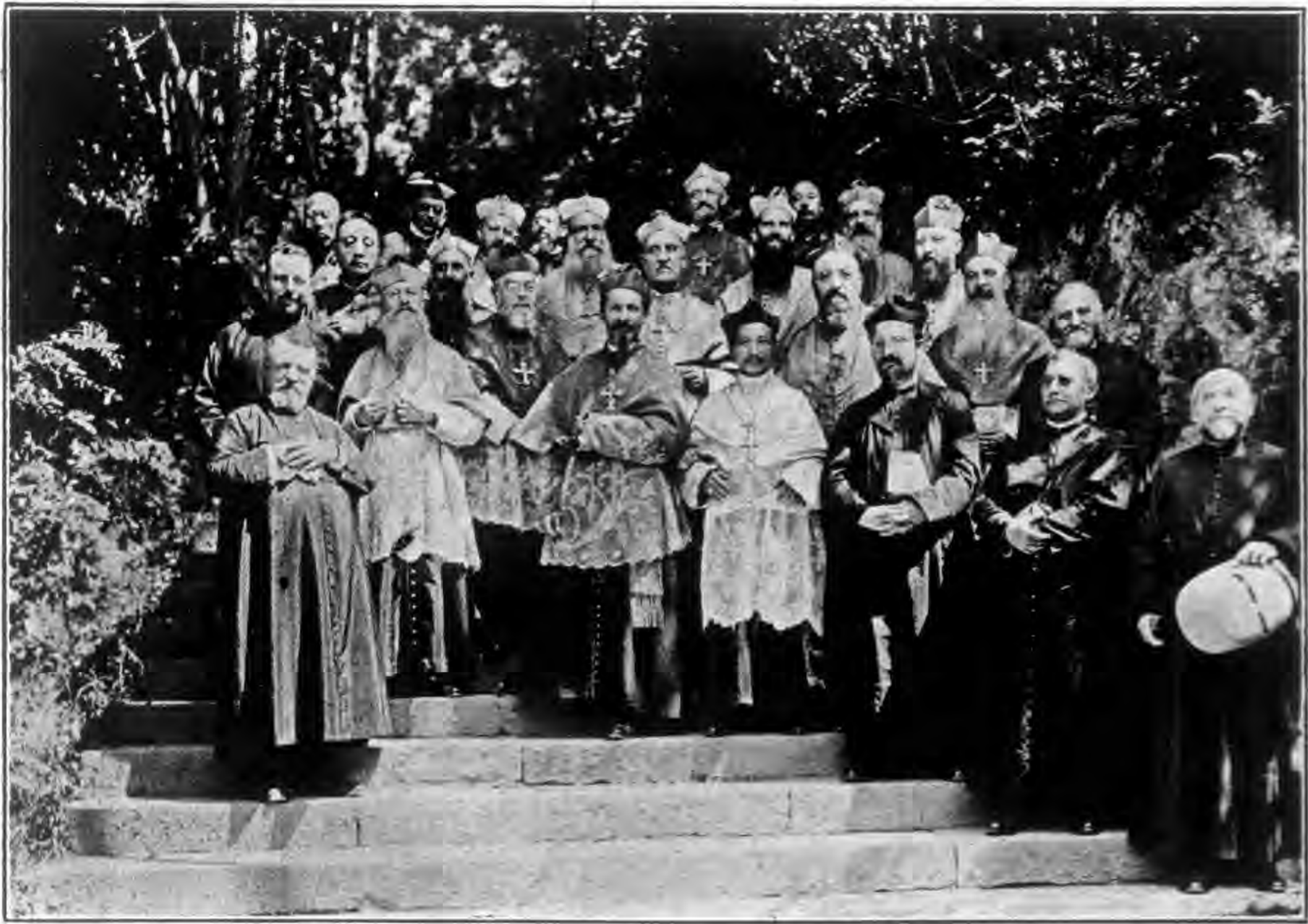
剛欽使及主教等奉獻於山聖母