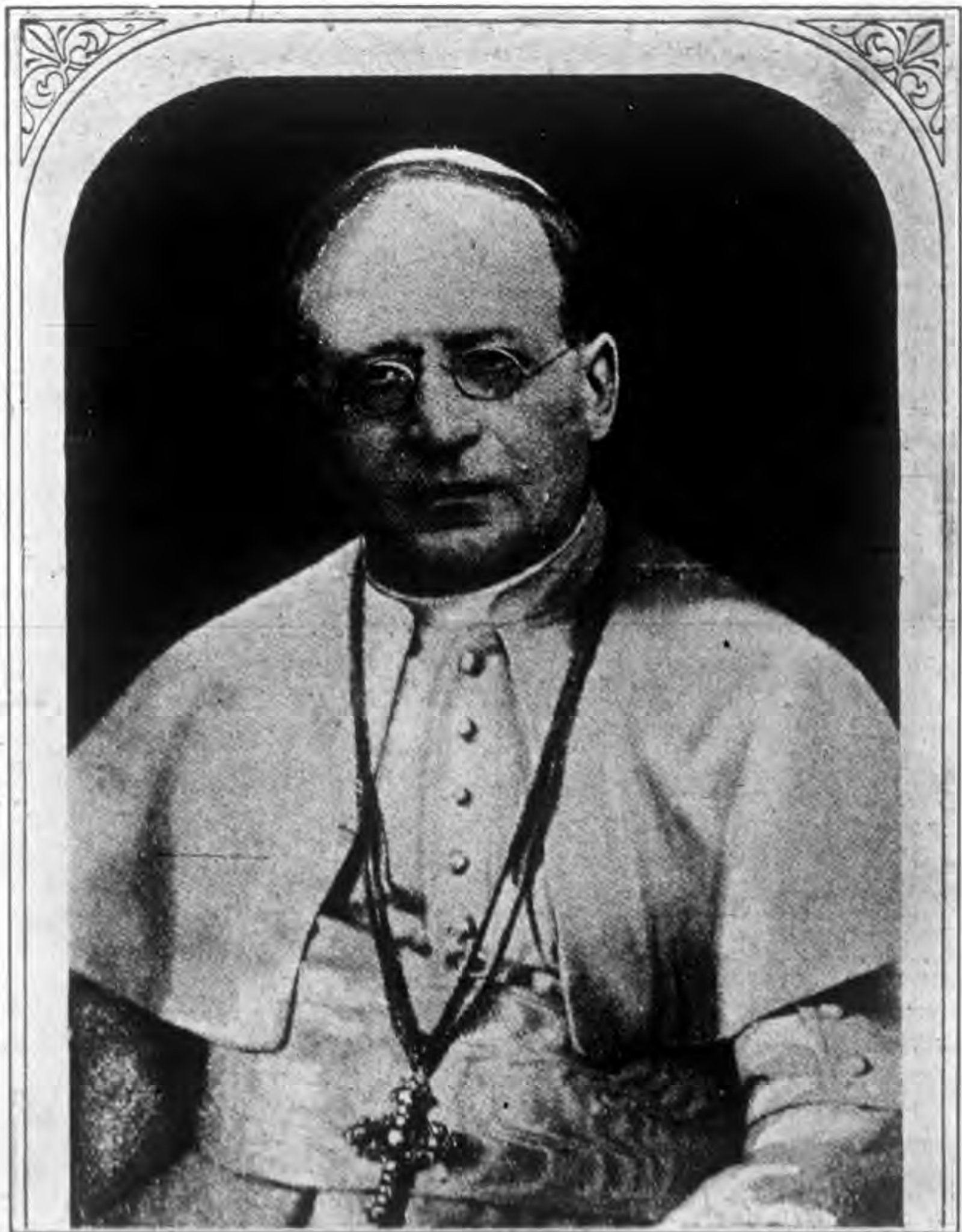
主開國中公會教皇庇護第十之一御容