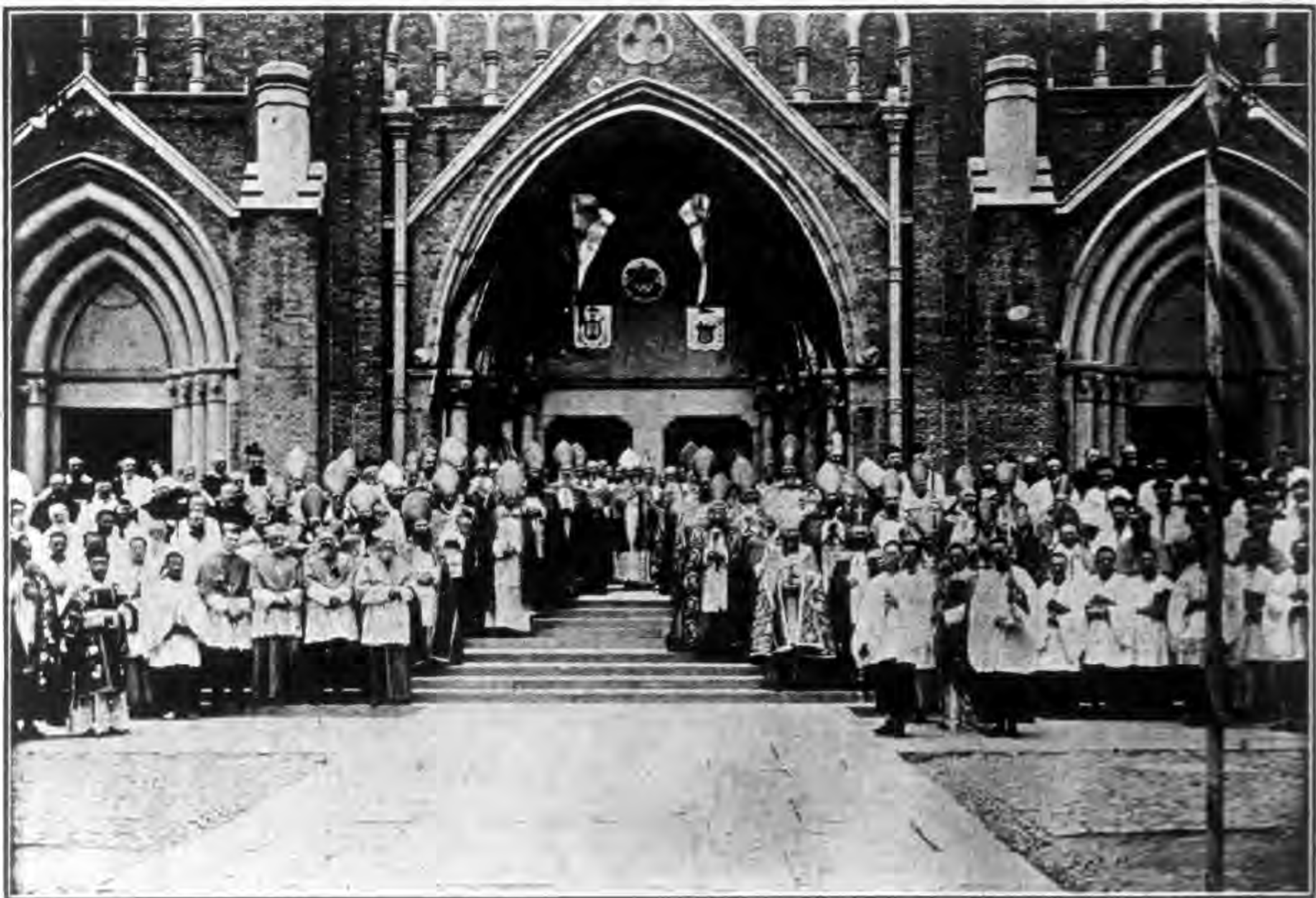
公 會 議 閉 幕 後 全 體 人 員 在 堂 前 攝 影