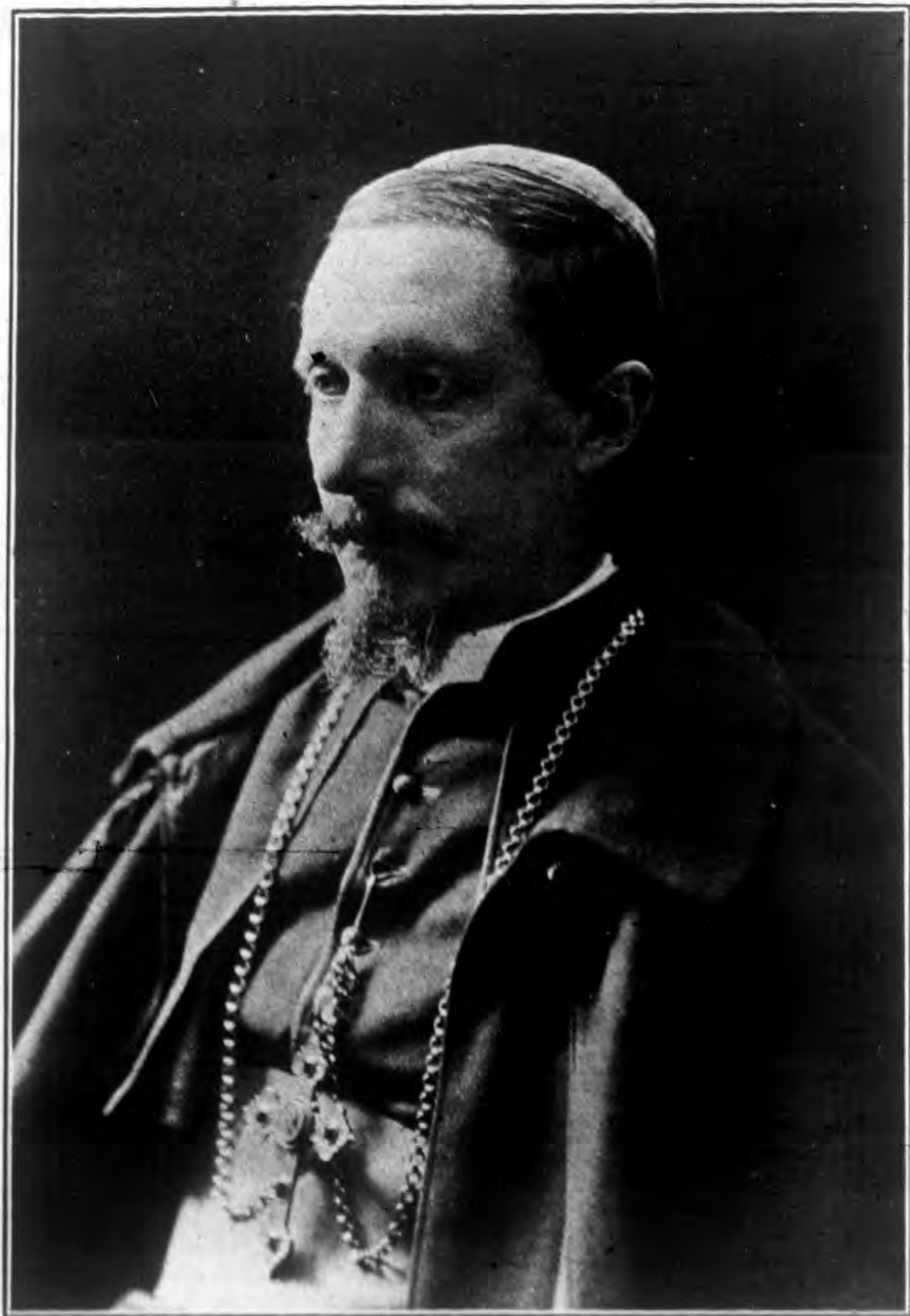
宗座欽使剛總主教