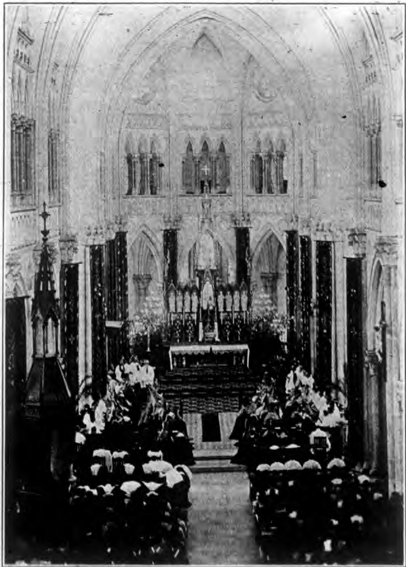
禮大幕開議會公行舉堂大滙家徐海上