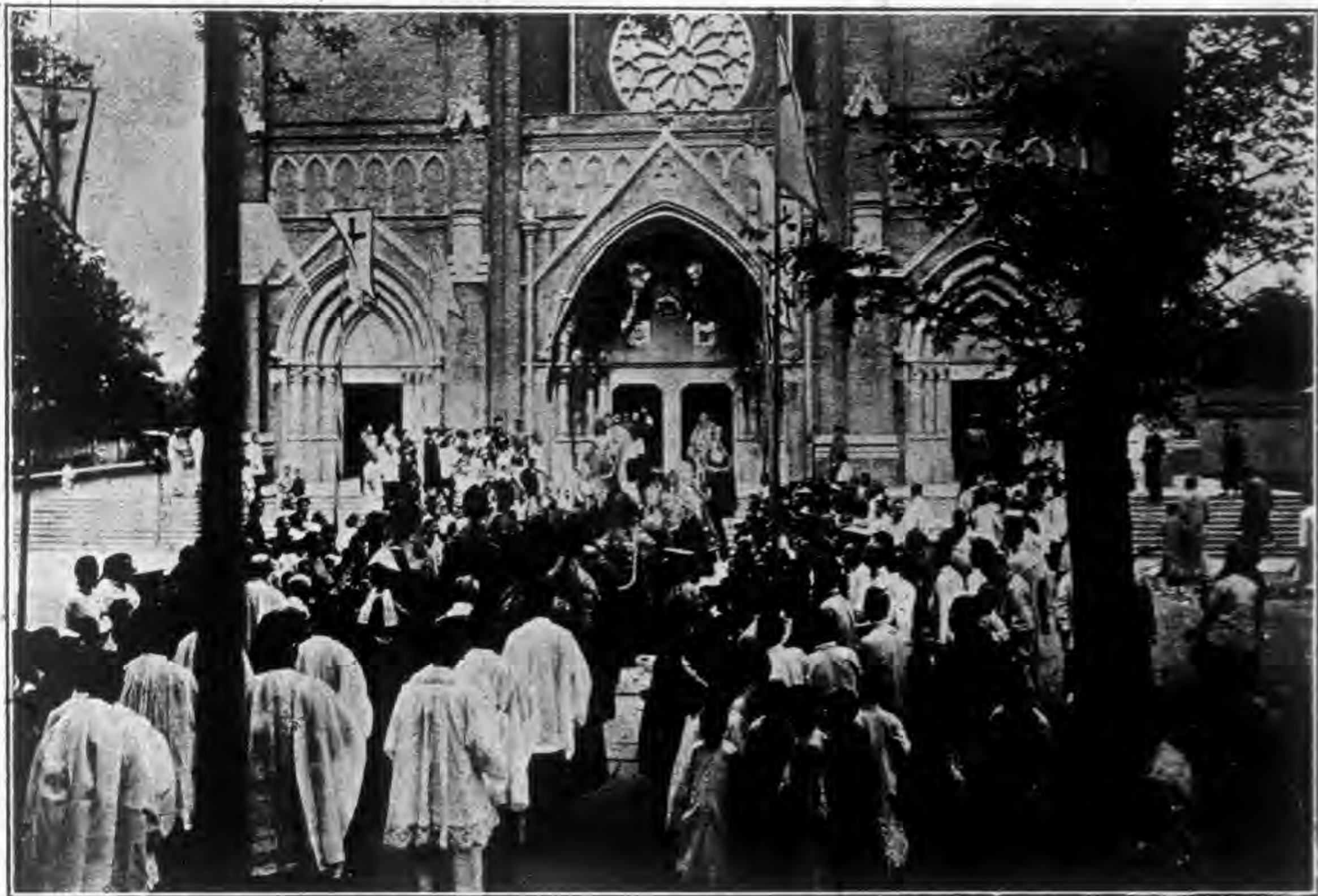
公 會 議 閉 幕 前 全 體 人 員 進 堂 時 攝 影