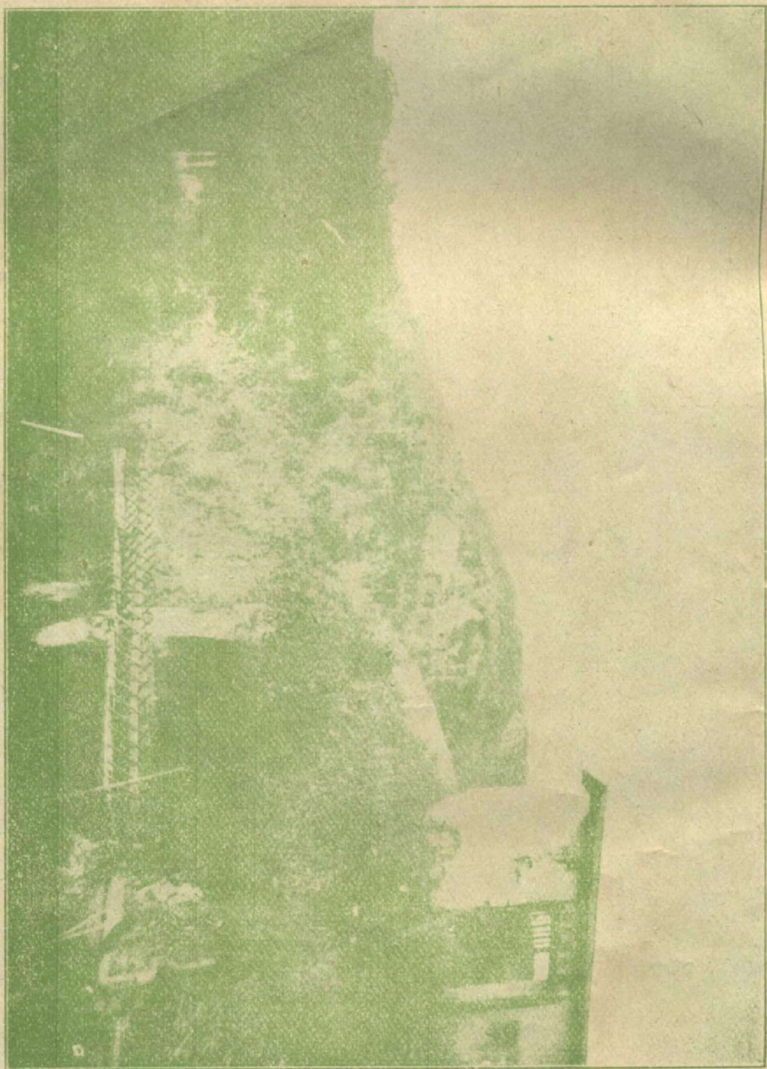
(墓 小 蘇) (橋 洽 西)