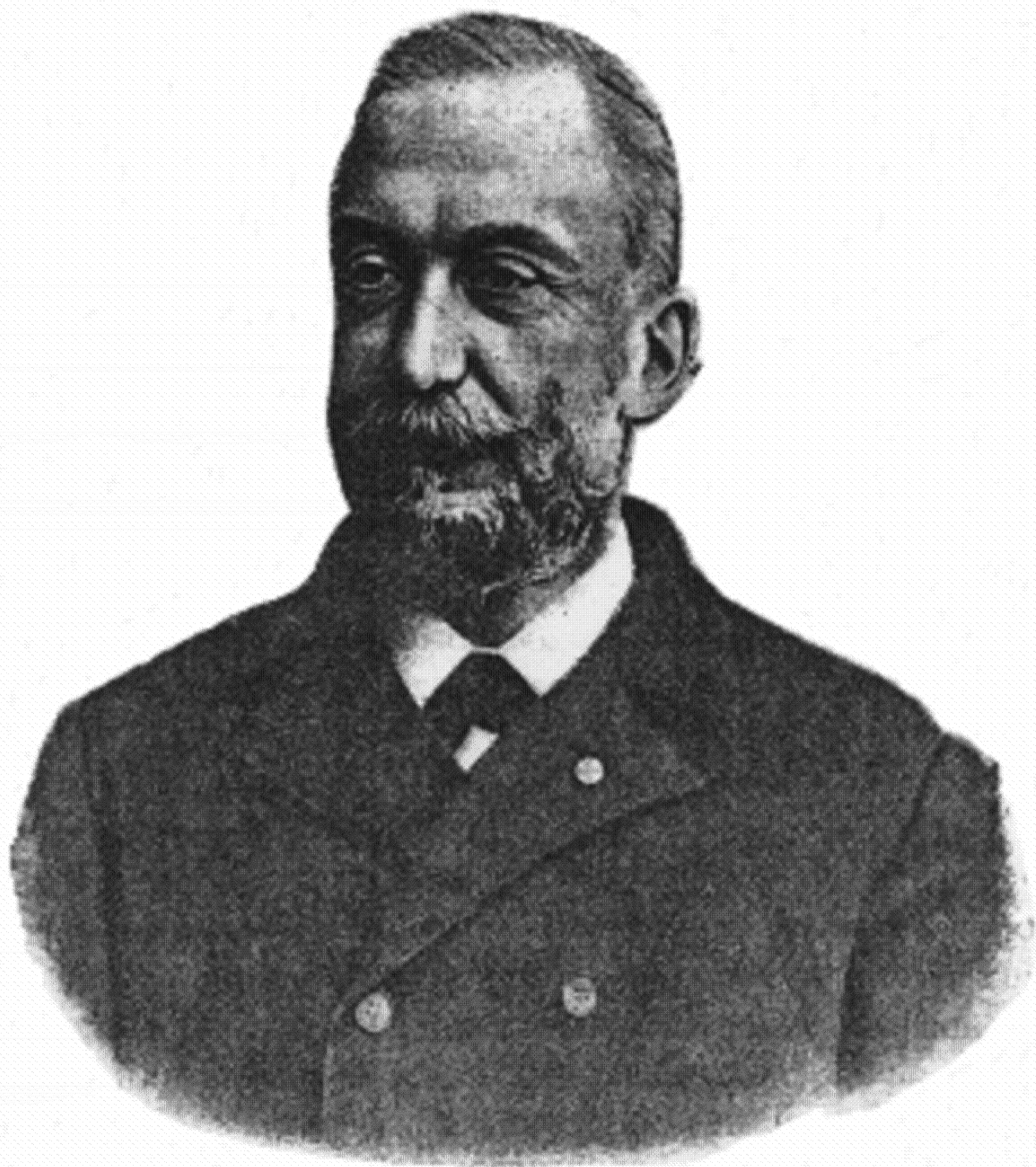
Профессоръ А. Форель.

Конечно, самое худшее зло—это физическое и умственное вырождение потомства алкоголиковъ, происходящее отъ непосредственнаго дѣйствія этого яда на сперму и половыя железы пьющихъ мужчинъ и женщинъ. Сперма-