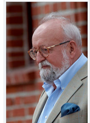
Кшиштоф Пендерецький , Гданськ, 2008

В СРСР твір вперше виконано в 1966 році . Записи цього музичного твору зробили Антоній Віт, Шимон Кавалла, Бруно Мадерна , Кшиштоф Пендерецький .