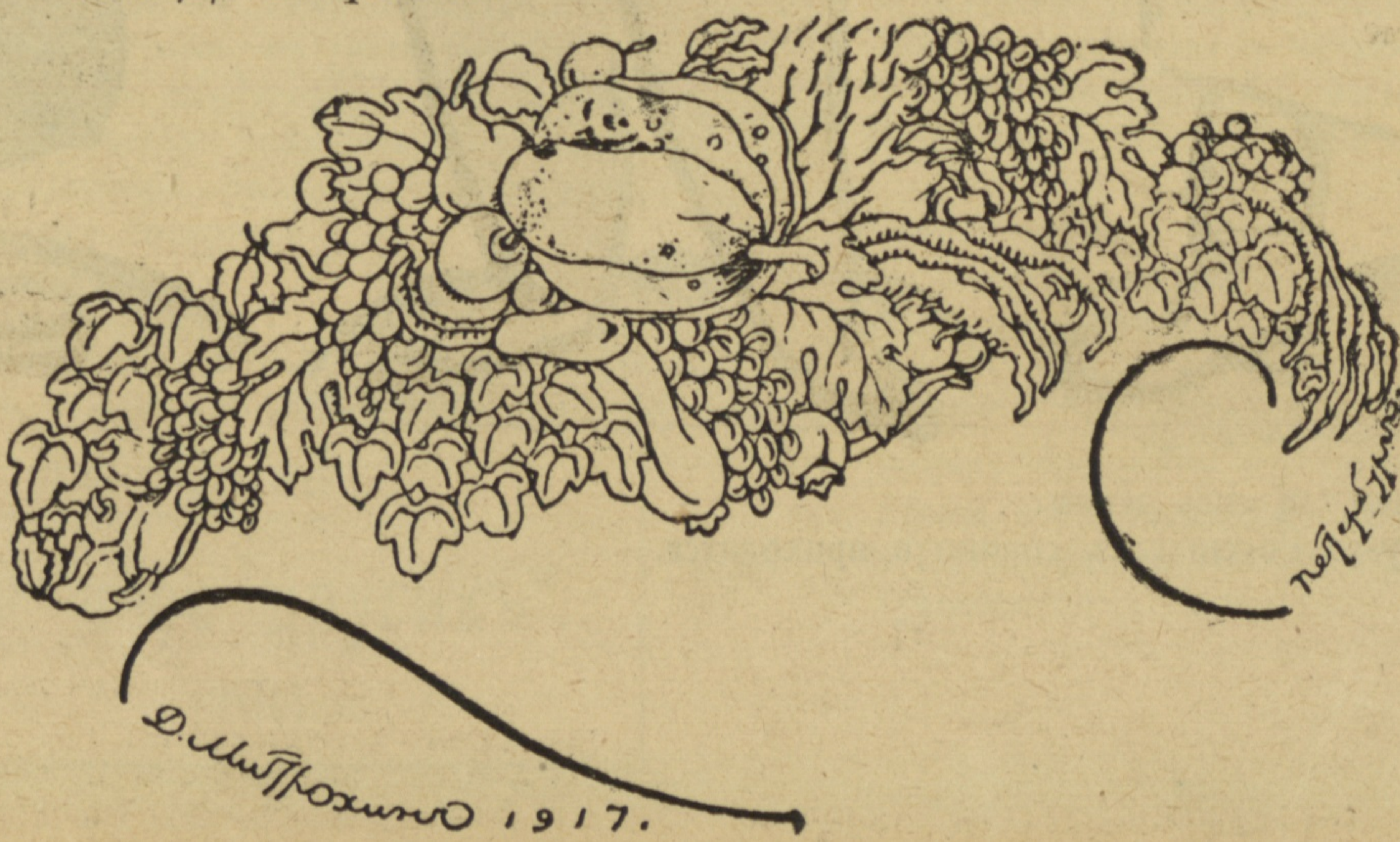
Рис. Д. Митрохина.

Въ теченіе сегодняшней ночи (12 сент.) въ уголовную милицію поступило болѣе 400 заявленій изъ комиссаріатовъ о разгромахъ и кражахъ изъ квартиръ и помѣшеній обывателей.