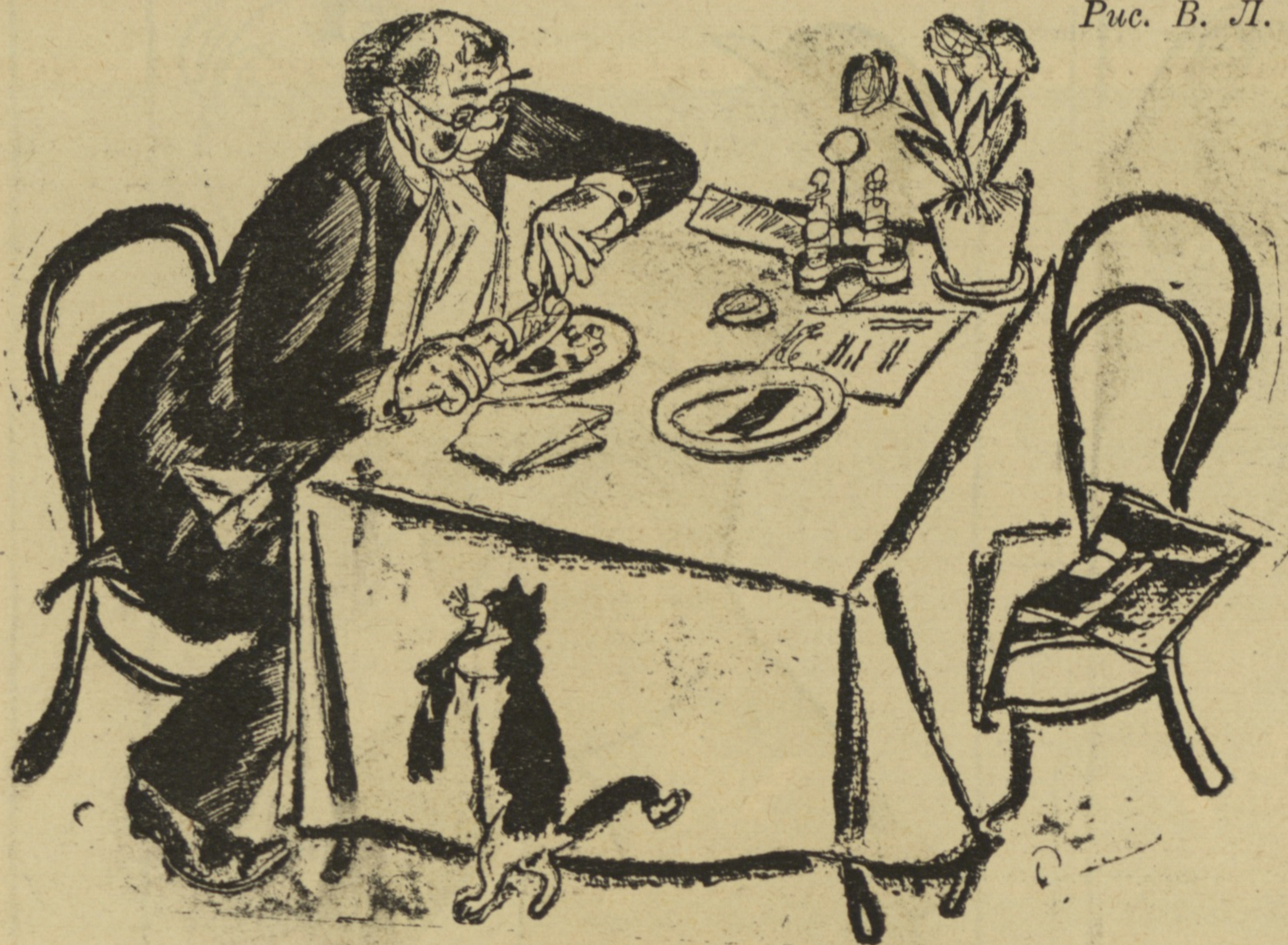
Рис. В. Л.