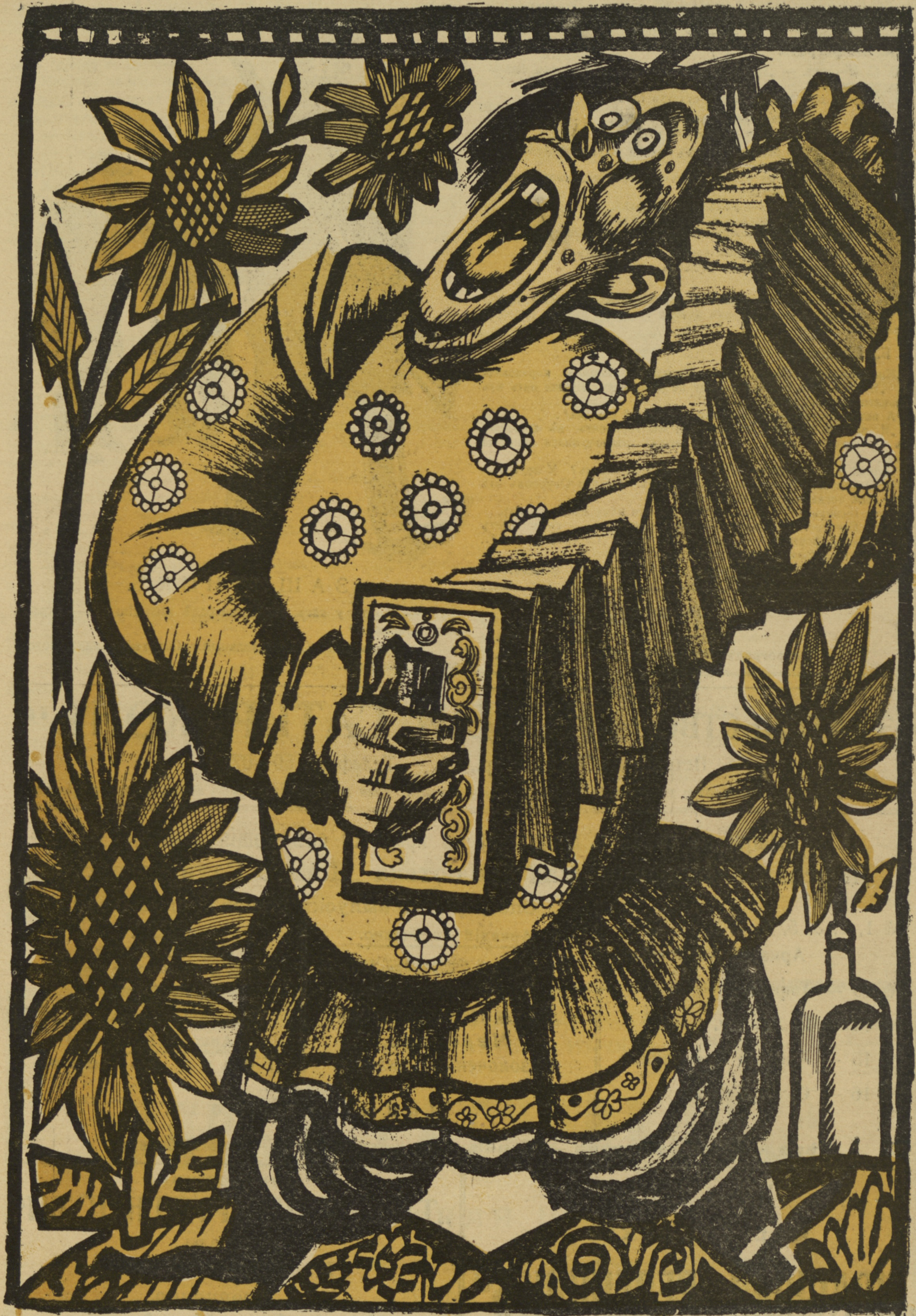
Наконецъ-то, въ російской революціи воцарилась гармонія!