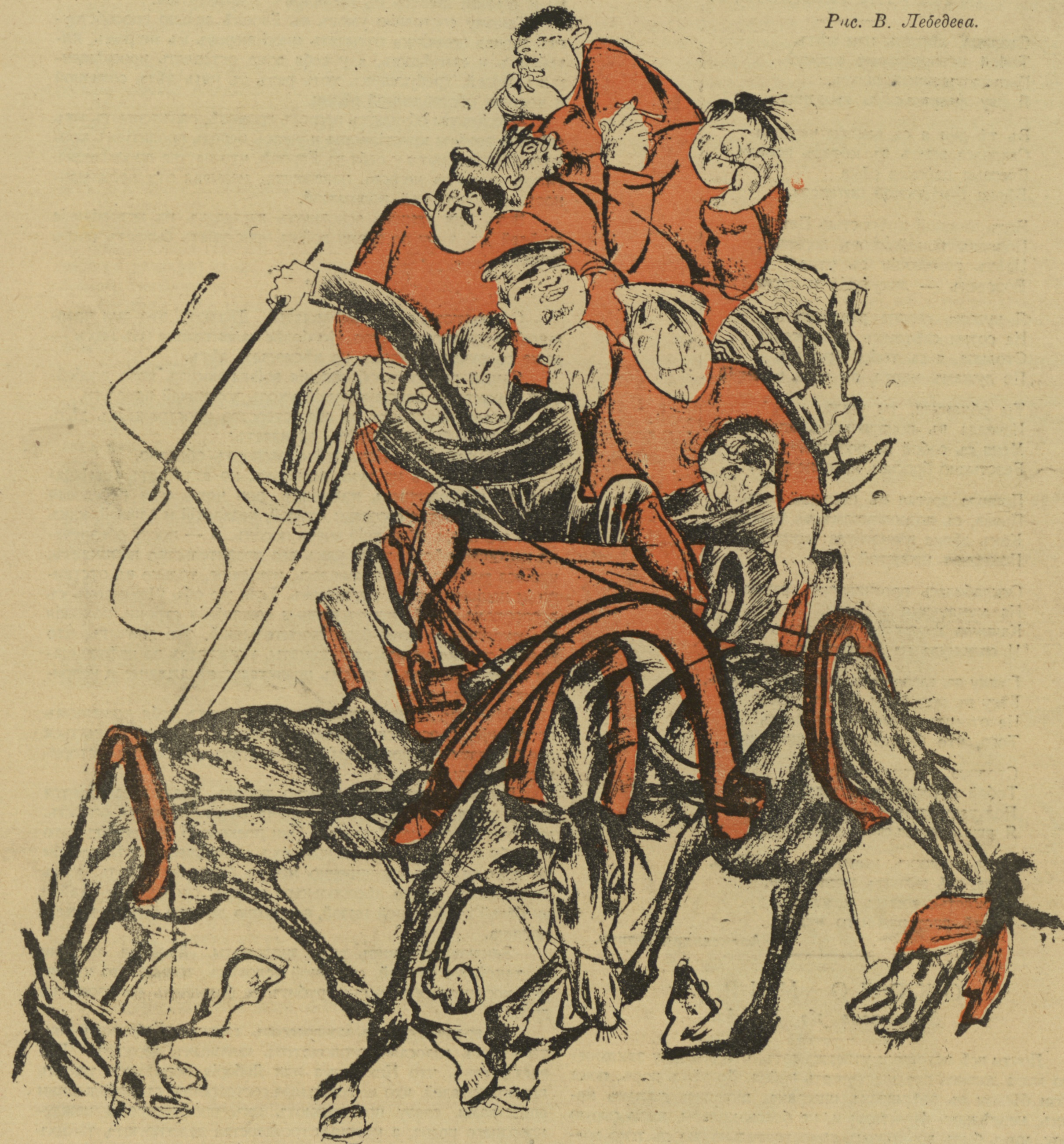
Рис. В. Лебедева.