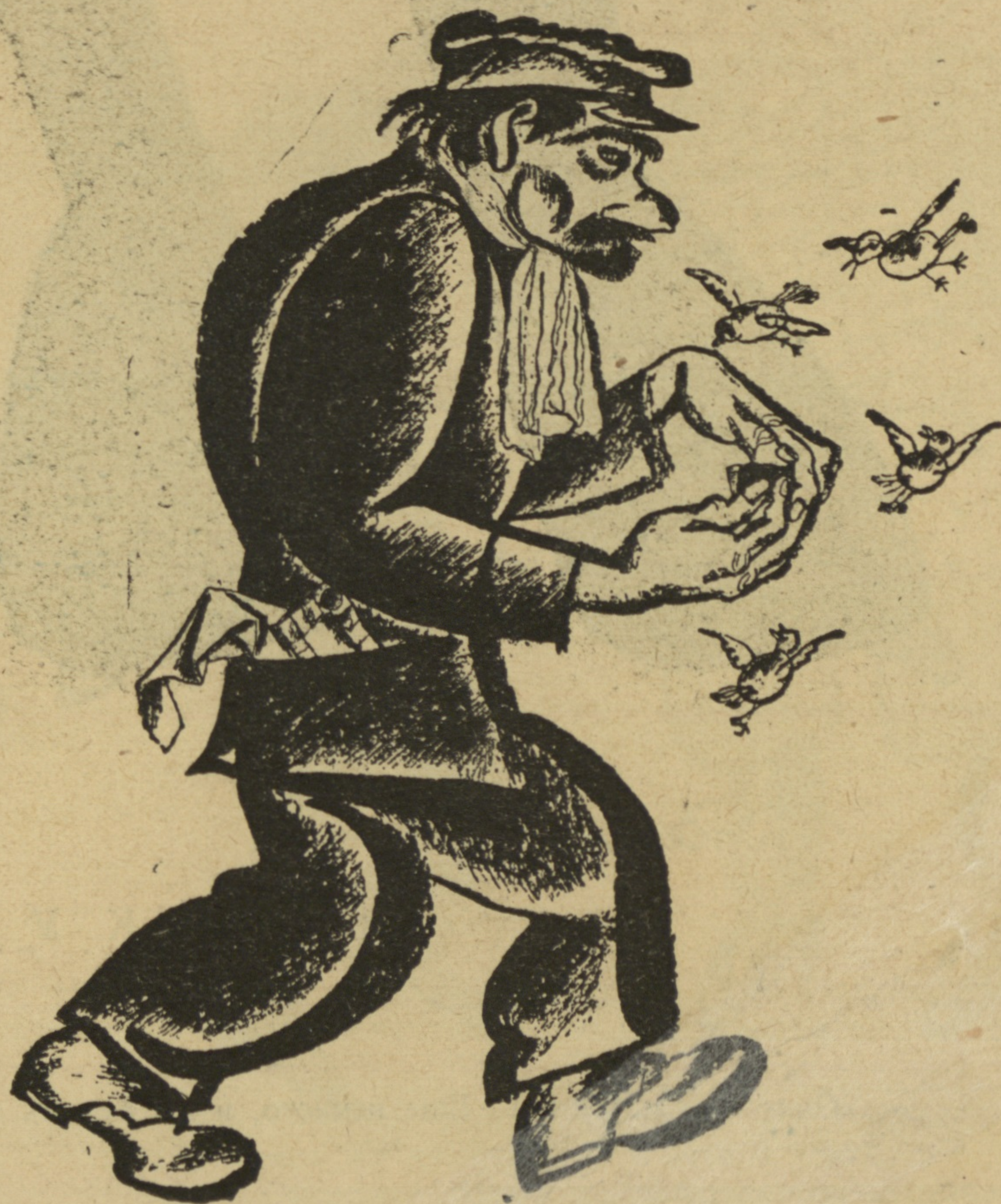
Рис. В. Лебедева.