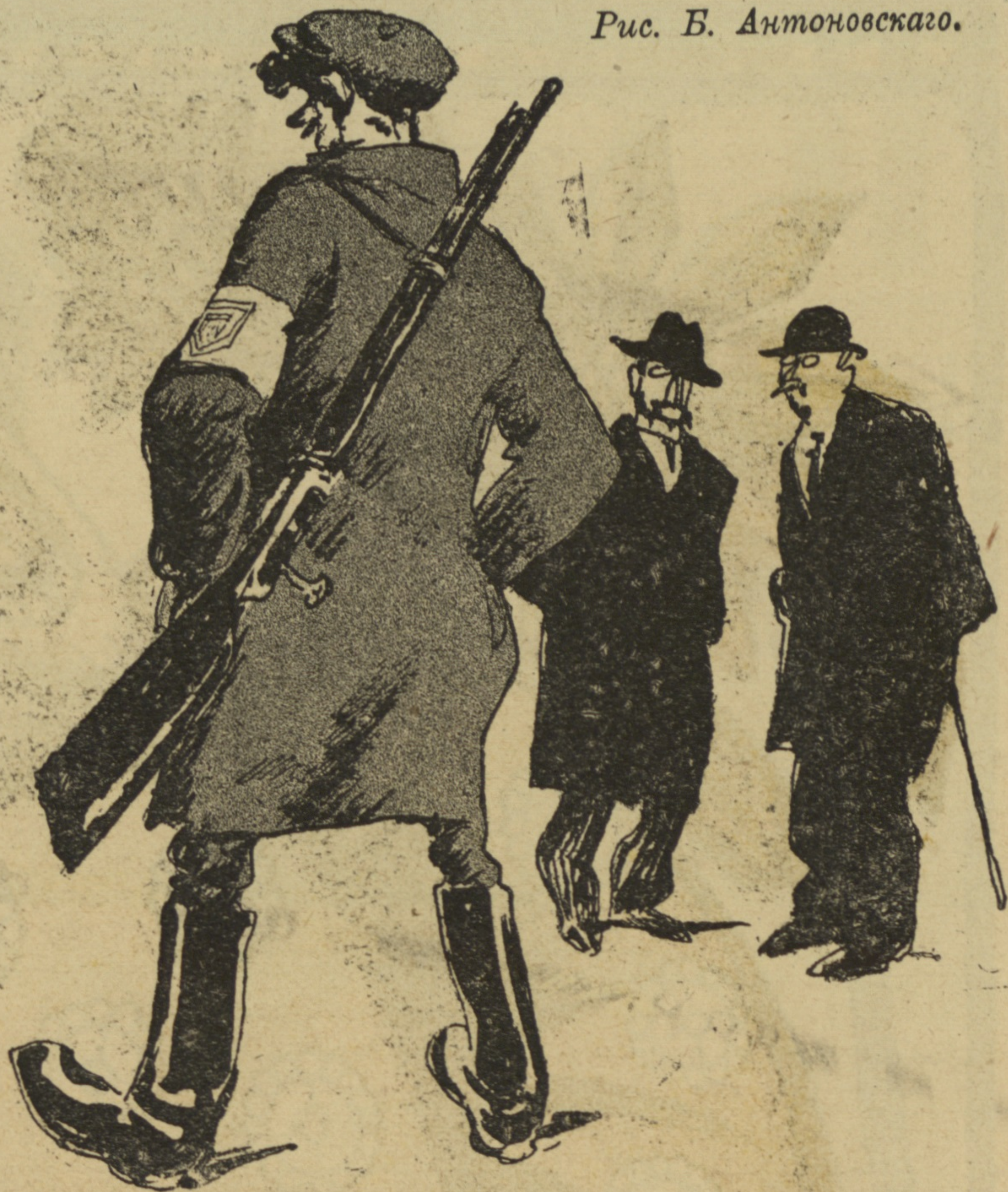
Рис. Б. Антоновскаго.

Издатель: Т-во „Н. Сатириконъ“. Петроградъ, Невскій пр., 88. — Тел. 59-07.