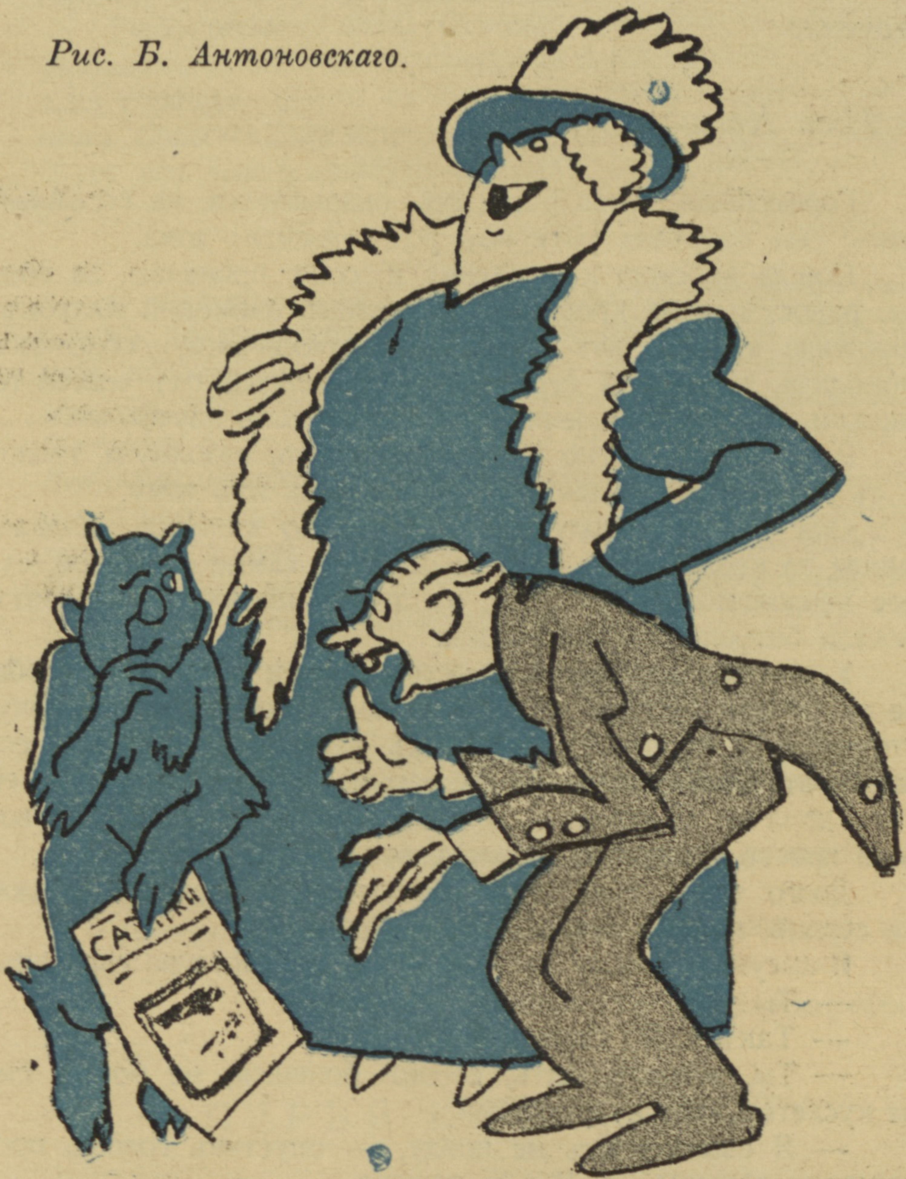
Рис. Б. Антоновскаго.

1) Когда, 9 лѣтъ тому назадъ, „Сатириконъ“ только что основался — цензоръ привелъ къ намъ тещу и сказалъ: — Вотъ вамъ! Можете писать только о ней — больше ни о чемъ.