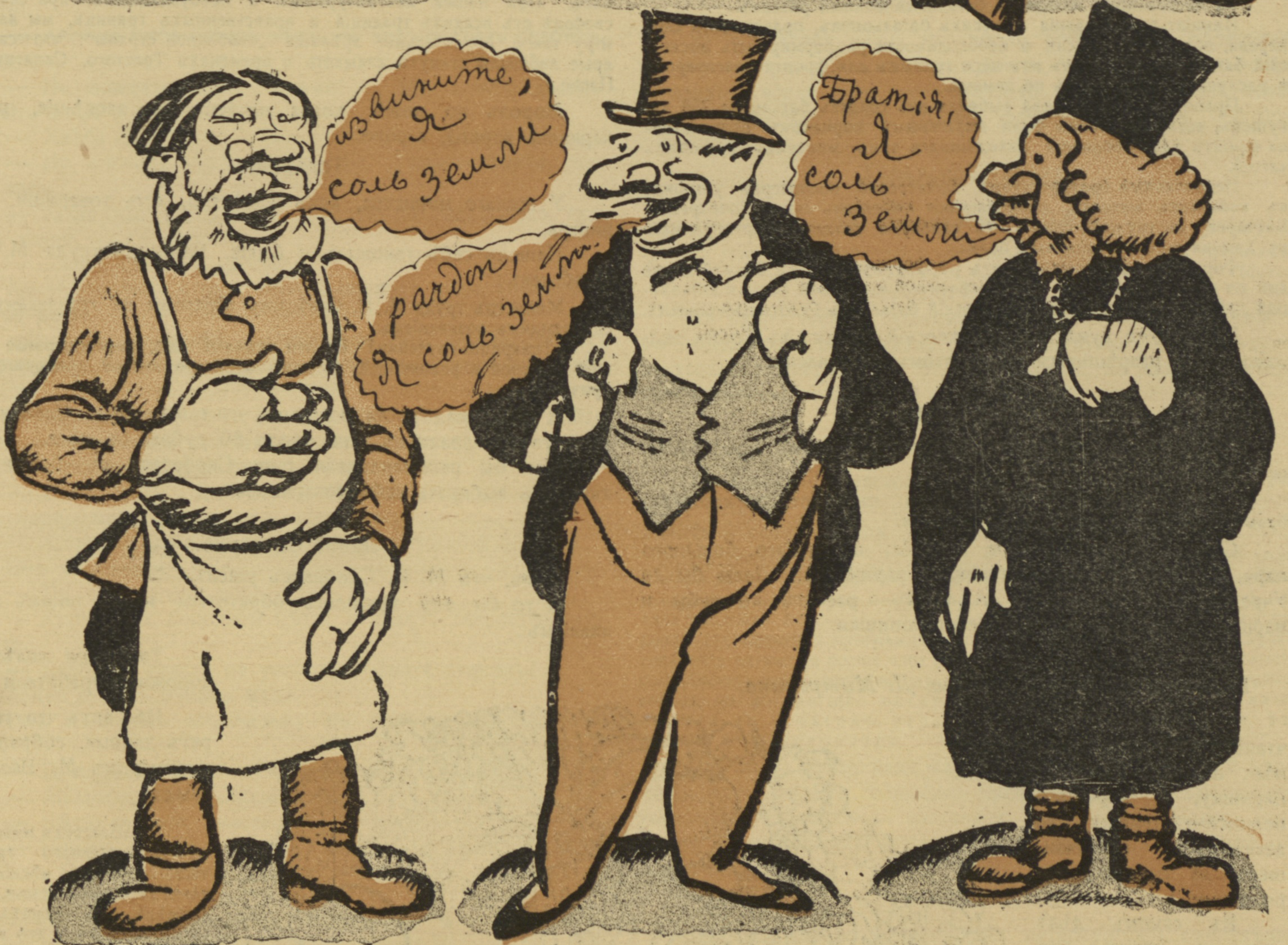
Все соль земли, да соль земли... Вотъ поэтому-то Россіи такъ солоно и приходится.