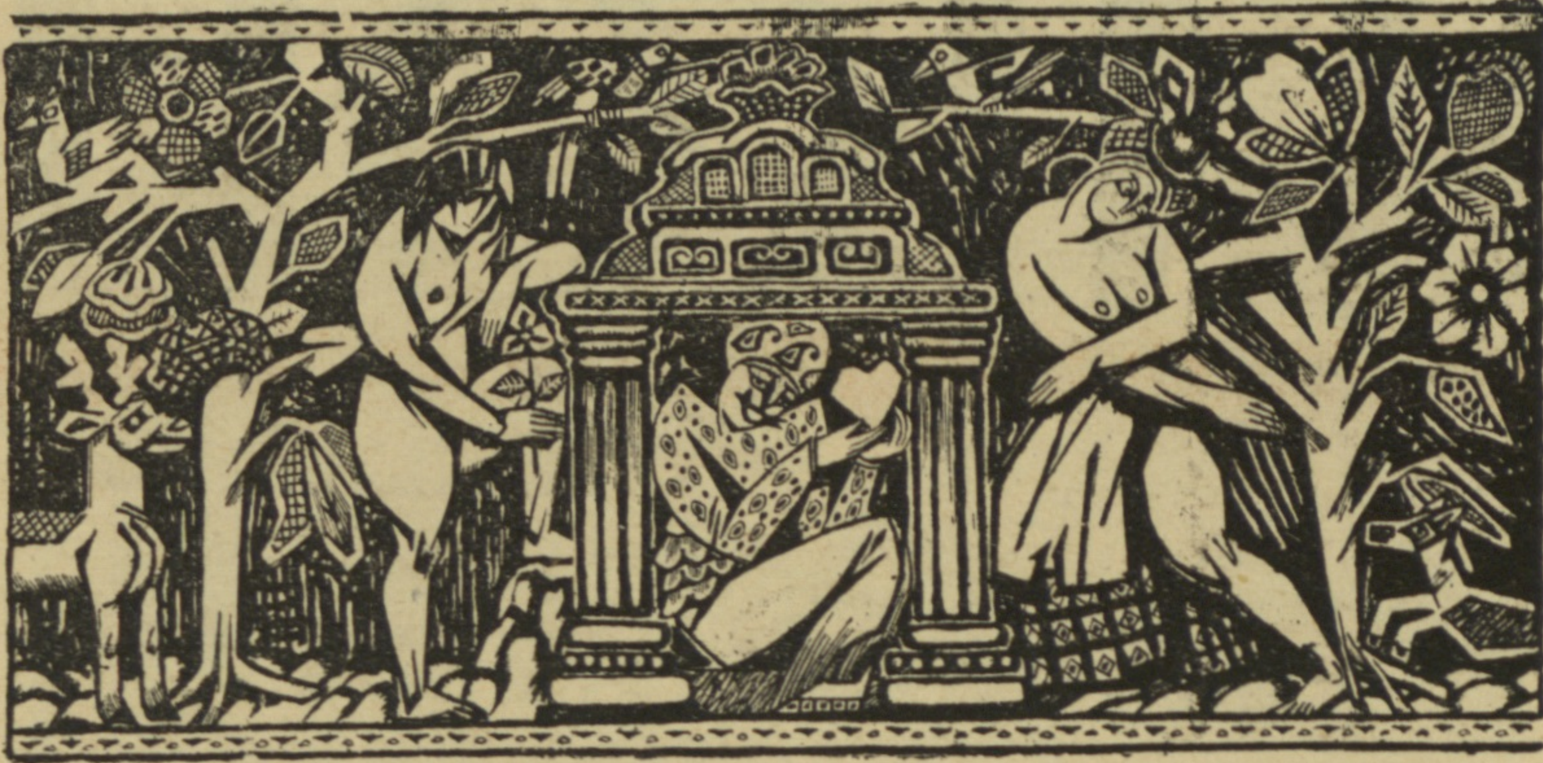
Рис. А. Радакова.