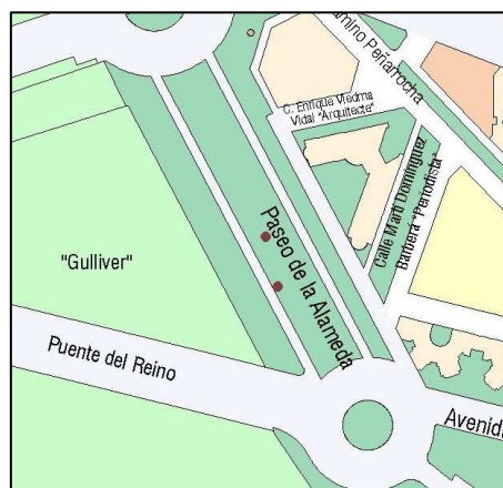
Planeamiento vigente SIGESPA

OTROS: Corrección de Errores: DOGV 03.05.1993