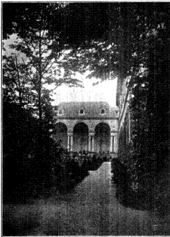
Parti fra Wallensteins Park.

Klokkeklang skærer pludselig gennem Stilheden, Orgelets sagte Nynnen bliver til et stormende Brus, og den pompøse Messe fylder det mægtige Rum. Uden at forstaa Ord eller Handling rives man med, og kun ægte nordisk Reservation, eller maaske Forlegenhed bevirker, at man ikke bøjer Knæ som de andre, men bliver staaende, underlig til overs og næsten med en Følelse af paa uværdig Maade at have tilsneget sig en smuk Oplevelse. Kun et Kvarter varer det hele, og man tør forlade sin Plads og vandre videre, op mod Kirkens Kor — og saa taler Historien paany sit tavse Sprog. Tycho Brahe læser jeg paa en Ligsten i Gulvet, og i selve Murpillen findes hans legemsstore Statue udført i Bronce. »Kodany« — Czekernes Betegnelse for Danmark — lyder en mild Stemme i mit Øre, og en smuk, gammel, hvidhaaret Prælat, der aabenbart af nogle enkelte Spørgsmaal har været i Stand til at slutte sig til min Nationalitet, opfrisker nu med stor Iver et Stykke Danmarks-historie for mig.