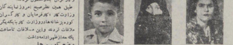
دو شیخ حاجیه حضوری برنده ۲۵۰ هزار ریال، بانوسفری امید برنده ۱۵۰ هزار ریال، آقای‌های بوی برنده ۱۵۰ هزار ریال، شهبه باجه نیابان ایران تهران شهبه بارز تهران، شهبه بارز تهران