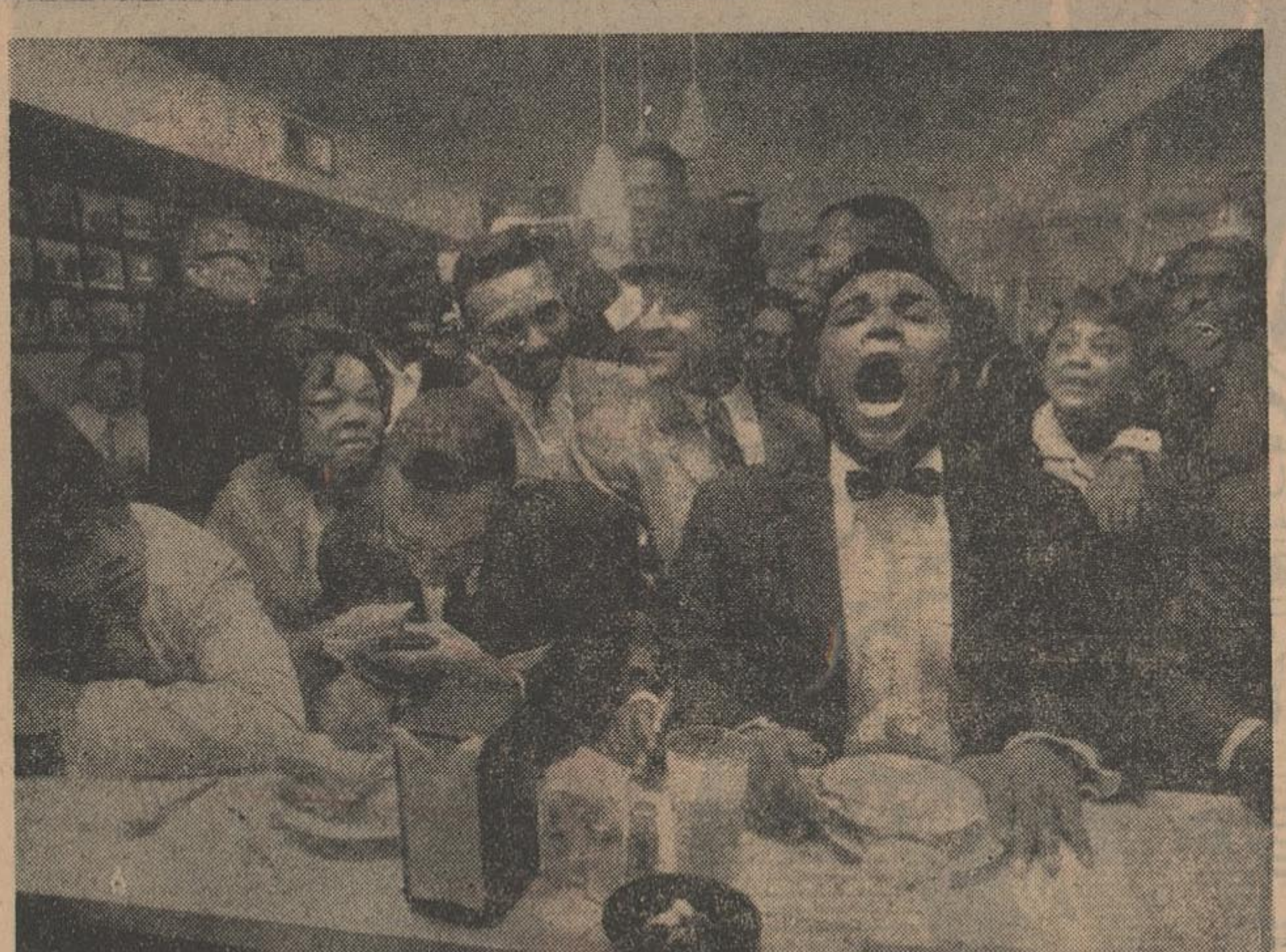
کاسیوس کلی که (پس از مسلمان شدن نام خود را محمدعلی گذاشته است) از پرحرفترین و خوشگترین ترین مشت زنان جهان است .

گاهی اوقات بخیرتکاران میگویم : «دیشب صدائی در خواب بمن گفت که در روز پنجم پیروز خواهم شد . و آنها این دروغ مرا راست می پندارند یا آنرا بحماقت تعبیر میکنند .