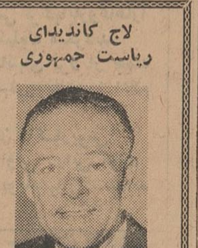
لاچ کاندیدی ریاست جمهوری

واشنگتن - هنری کابوت لاج سفیر کبیر امریکا شویت نام جنوبی آمادگی خود را برای شرکت در انتخابات ریاست جمهوری امریکا اعلام داشت.