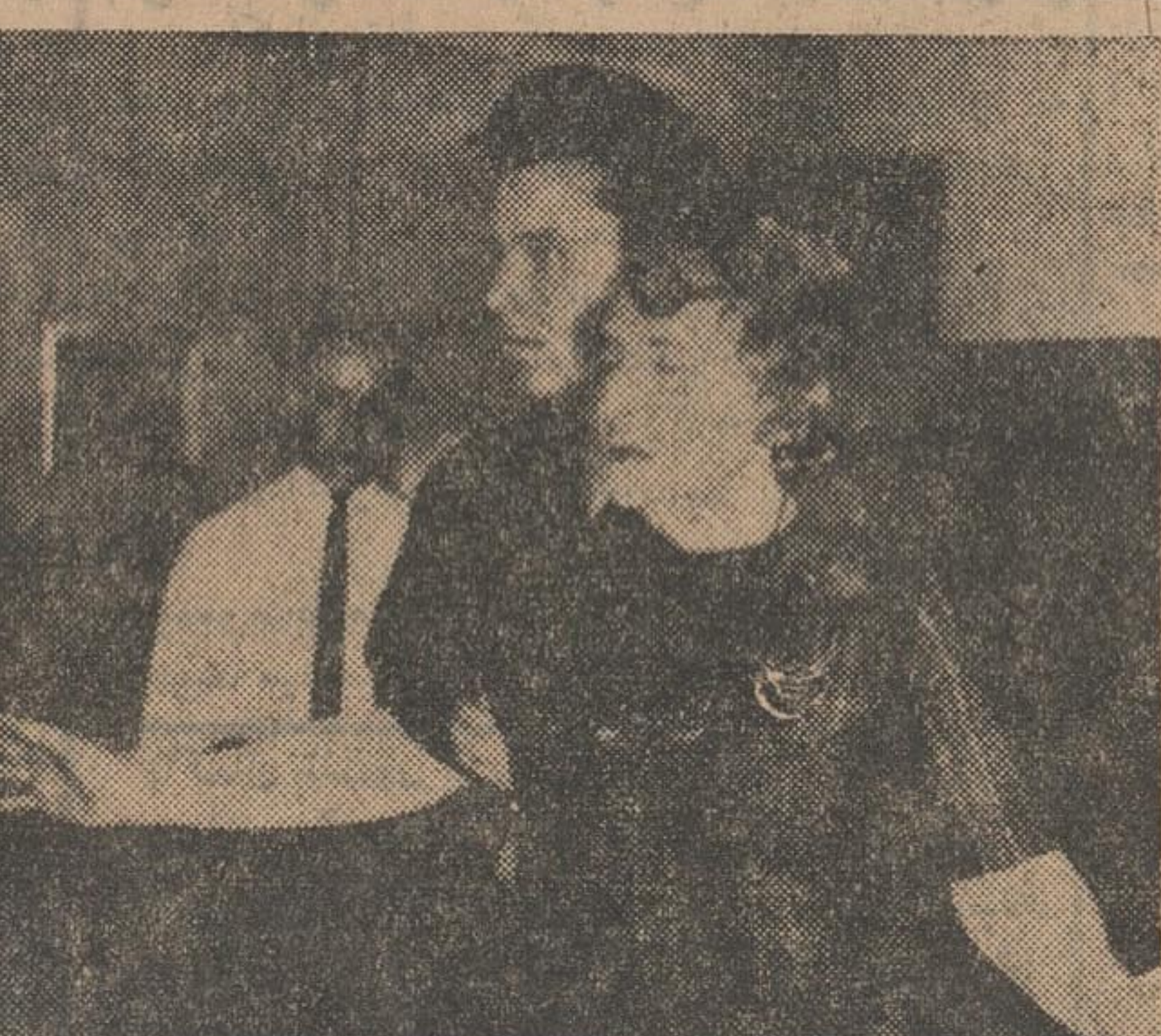
یکی از زندانیان شورشی با تهدید بوسیله اسلحه فلانی غنمی دادگاه جاثروبی را دستگیر کرده و میخواهد او را همراه خود ببرد.

بدنبال حمله زندانیان بجلسه دادگاه: جک روبی گفت احساس و حشمت میکنم همسر اسوالد گفت: حاضر نیستم قاتل شوهرم روی صندلی الکتریکی اعدام شود دو نفر از زندانیان مهاجم به دادگاه جک روبی هنوز دستگیر نشده اند در صفحه ۴