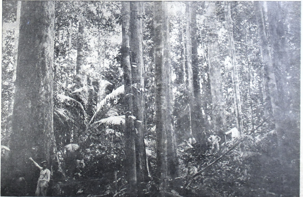
ပုဂံ ဝန်ထမ်း အဖွဲ့အစည်း အဖွဲ့