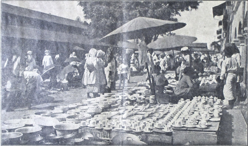
ပြည်ထောင်စု၏ အာဏာကို ဖြည့်ဆည်းပေးရန်