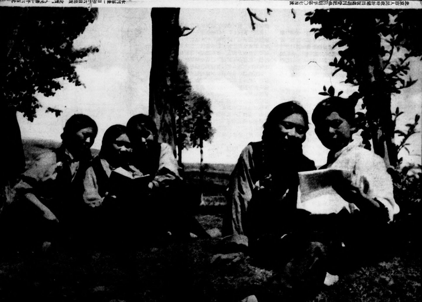
北京市人民政府新聞出版社出版 四開字號 〇七四號