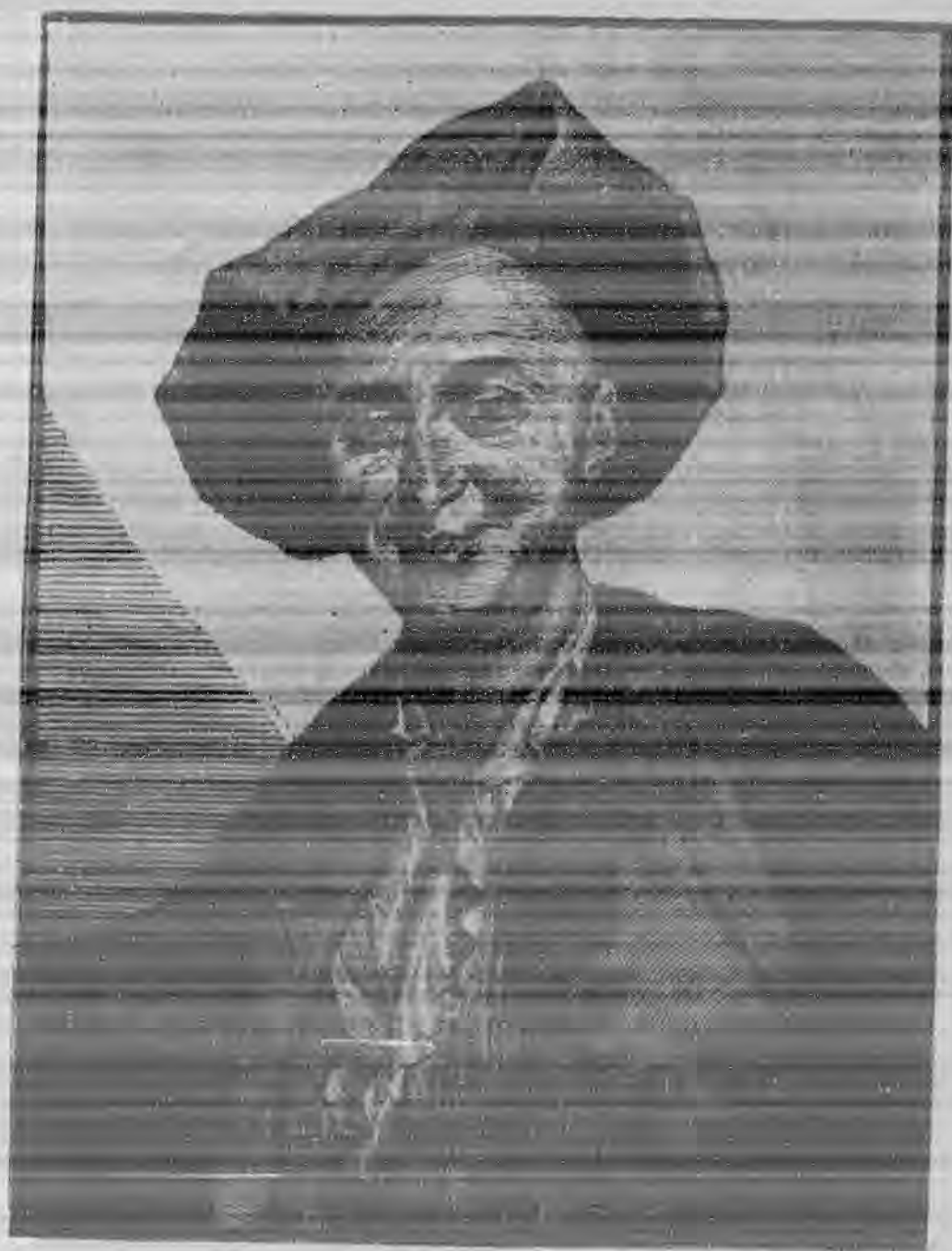
Julien offroy de la Mettrie (拉·梅特利 1709—1751)