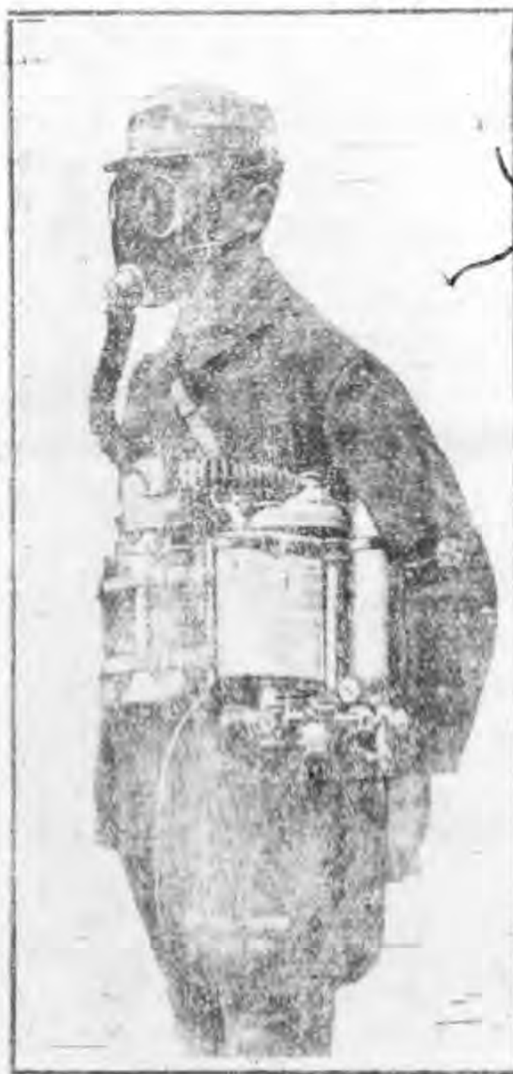
圖三十 一種德國隔絕式面具